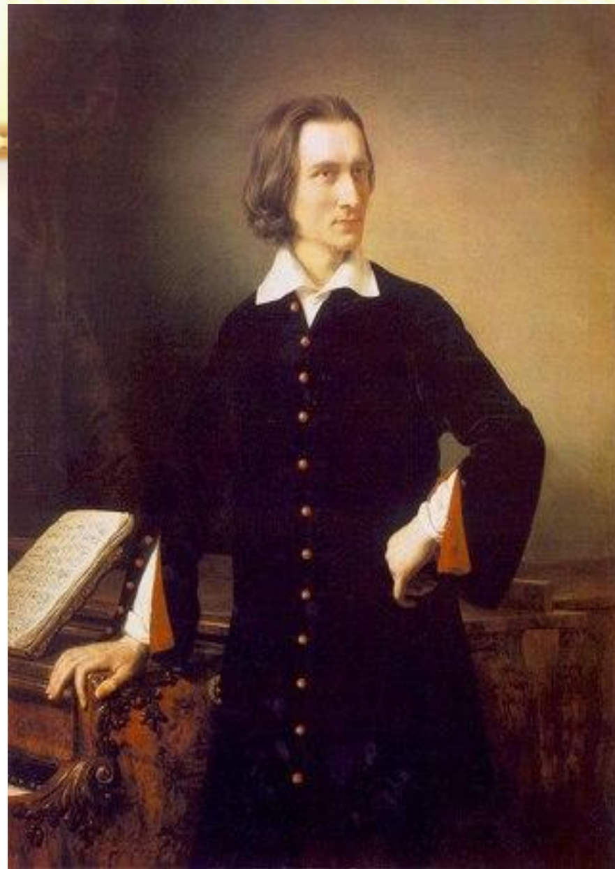
Миклош БАРАБАШ. "Портрет Ференца Листа».

Ференц Лист (1811—1886) — венгерский композитор, пианист, дирижер, педагог, общественный деятель. Венгерские рапсодии Ференца Листа принадлежат к числу наиболее ярких оригинальных его художественных созданий.