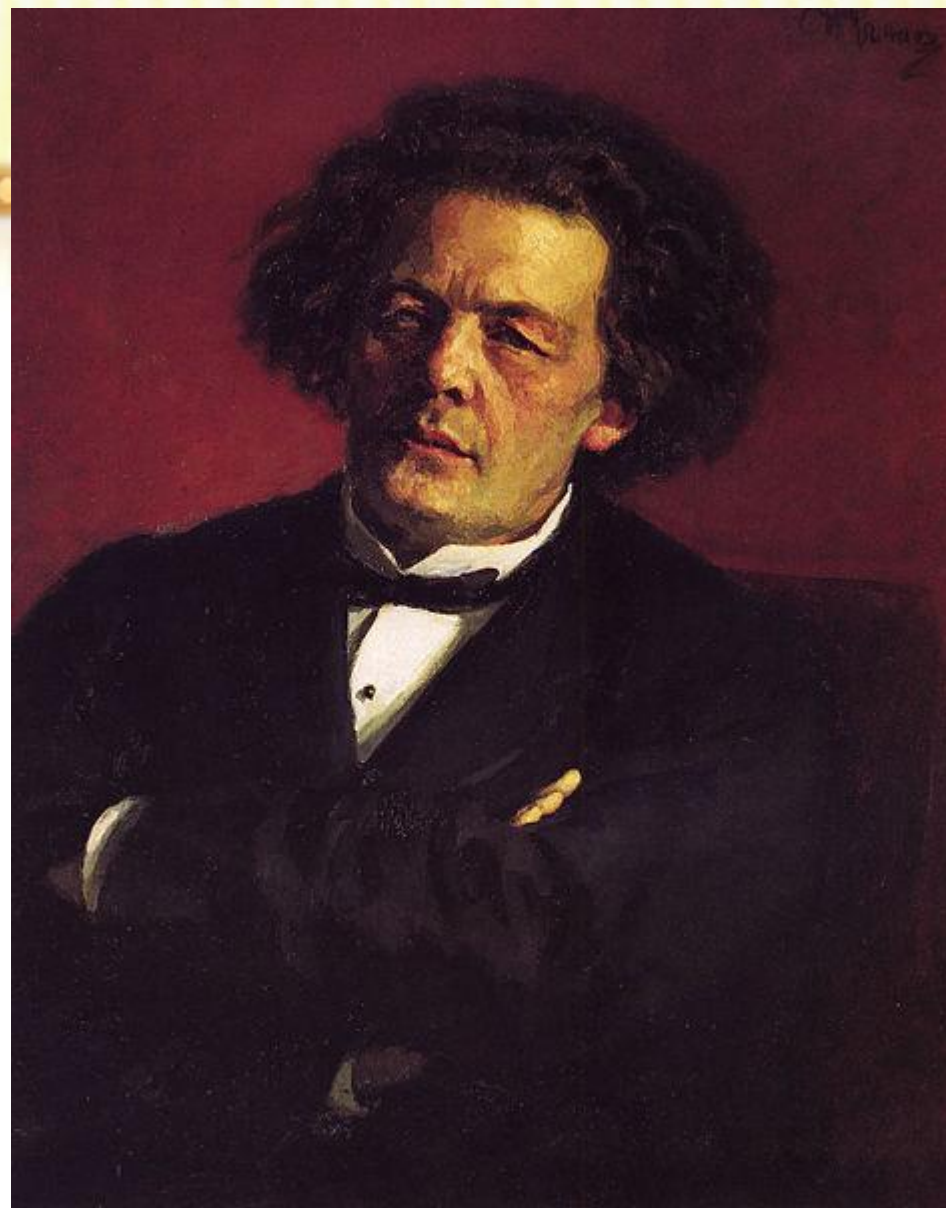
Портрет Рубинштейна работы И.Е. Репина (1881)

Вошедший был немного выше среднего роста и довольно широк в кости, но не полн. Держался он с такой изящной, неуловимо небрежной и в то же время величавой простотой, которая свойственна только людям большого света. Сразу было видно, что этот человек привык чувствовать себя одинаково свободно и в маленькой гостиной, и перед тысячной толпой, и в залах королевских дворцов. Всего замечательнее было его лицо - одно из тех лиц, которые запечатлеваются в памяти на всю жизнь с первого взгляда: большой четырехугольный лоб был изборожден суровыми, почти гневными морщинами; глаза, глубоко сидевшие в орбитах, с повисшими над ними складками верхних век, смотрели тяжело, утомленно и недовольно; узкие бритые губы были энергичны и крепко сжаты, указывая на железную волю в характере незнакомца, а нижняя челюсть, сильно выдвинувшаяся вперед и твердо обрисованная, придавала физиономии отпечаток властности и упорства. Общее впечатление довершала длинная грива густых, небрежно заброшенных назад волос, лежавшая эту