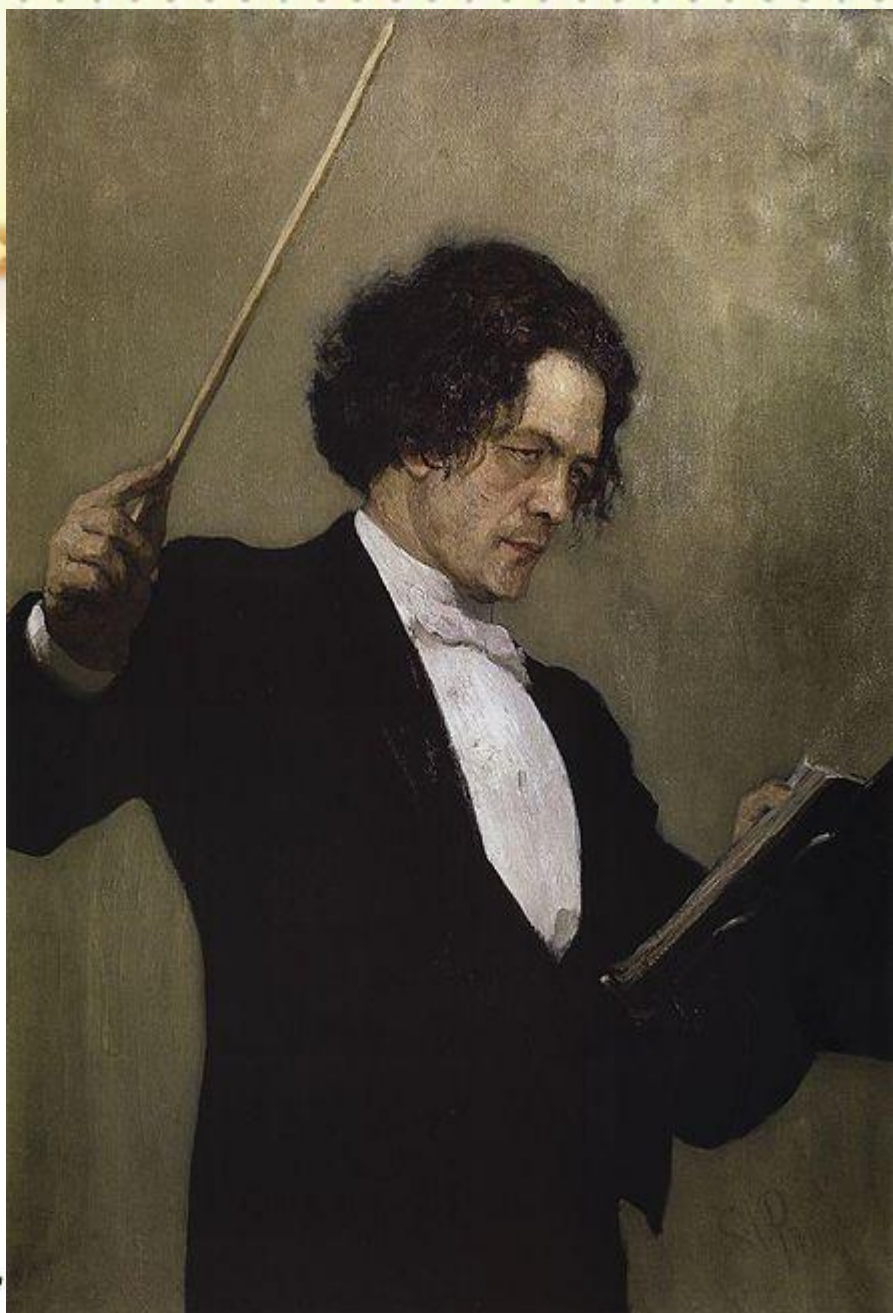
Портрет Рубинштейна работы Ильи Репина

Антон Григорьевич Рубинштейн (1829—1894) — композитор, пианист, дирижёр, музыкальный педагог. Как пианист Рубинштейн стоит в ряду величайших представителей фортепианного исполнительства всех времён. Он также является основоположником профессионального