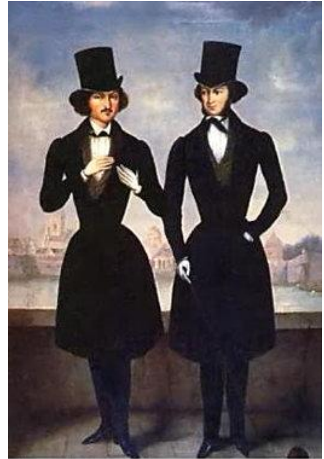
Неизвестный художник первой половины XIX века. Пушкин и Гоголь