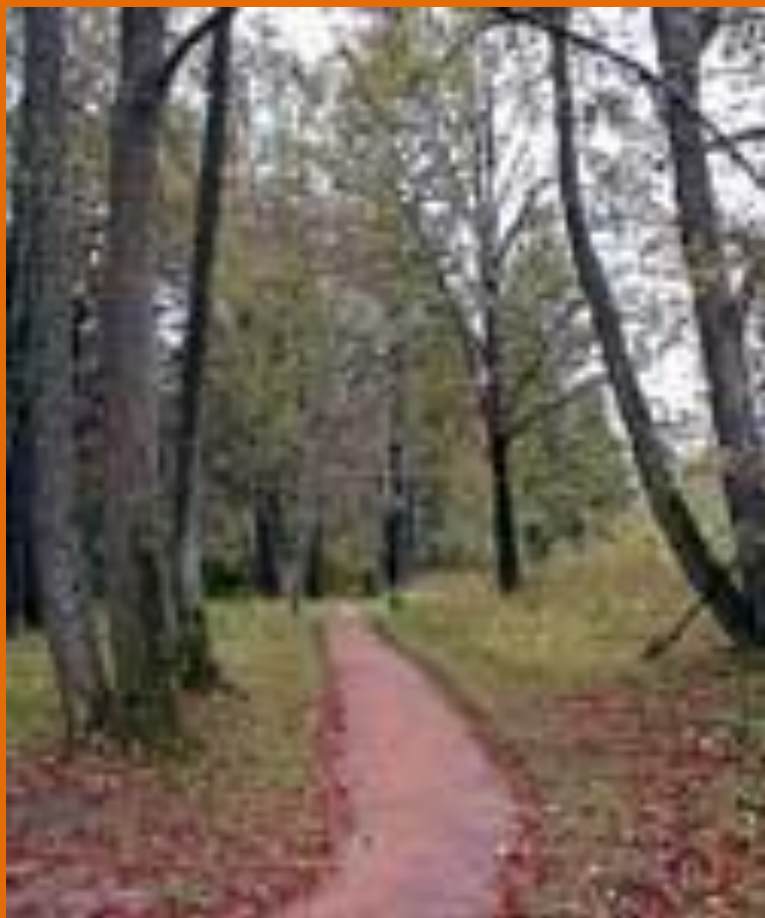
Парк. Липовая аллея.