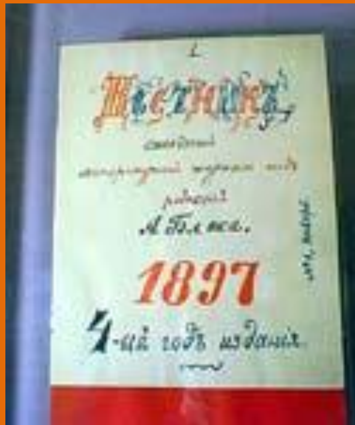
Домашний журнал «Вестник».