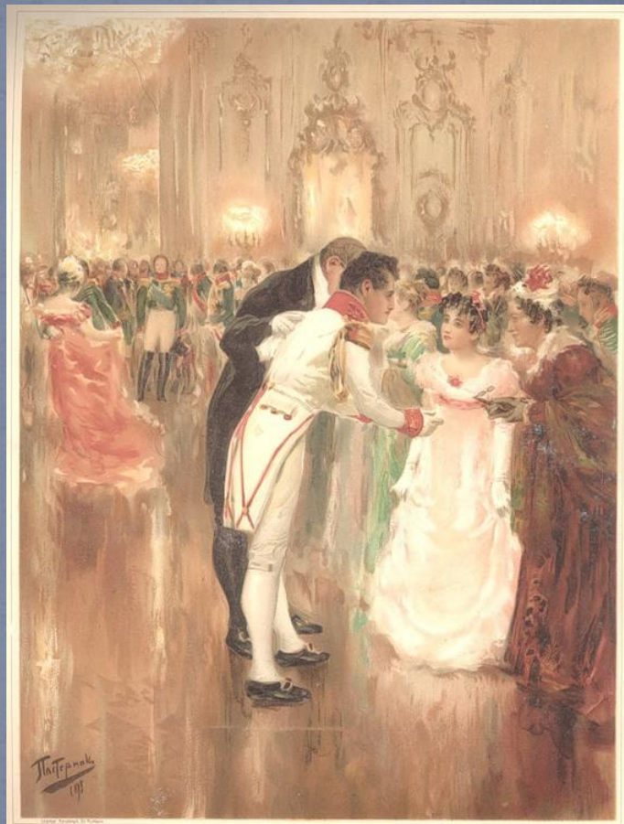
«НАТАША РОСТОВА НА ПЕРРОЖЕ БАЛУ» Александр А. О. Пастернак