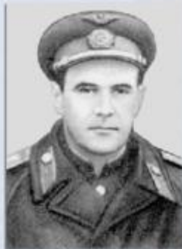
И.П.Уткин 1903 - 1944 г.

Я вам жить завещаю, - Что я больше могу? Завещаю в той жизни Вам счастливым быть И родимой Отчизне С честью дальше служить. Горевать - горделиво, Не склоняясь головой, Ликовать - нехвастливо В час победы самой. И беречь её свято, Братья, счастье своё - В память воина-брата, Что погиб за неё.