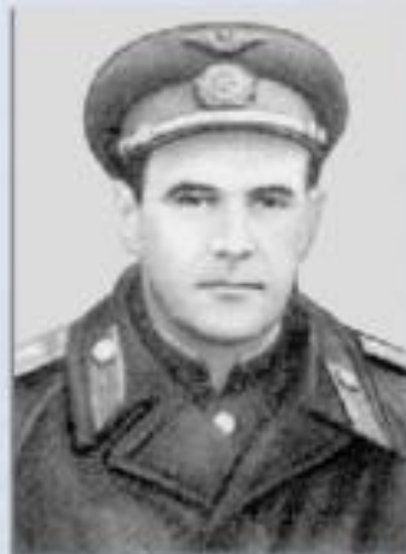
И.П.Уткин 1903 - 1944 г.

Я вам жить завещаю, - Что я больше могу? Завещаю в той жизни Вам счастливым быть И родимой Отчизне С честью дальше служить. Горевать - горделиво, Не склоняясь головой, Ликовать - нехвастливо В час победы самой. И беречь её свято, Братья, счастье своё - В память воина-брата, Что погиб за неё.