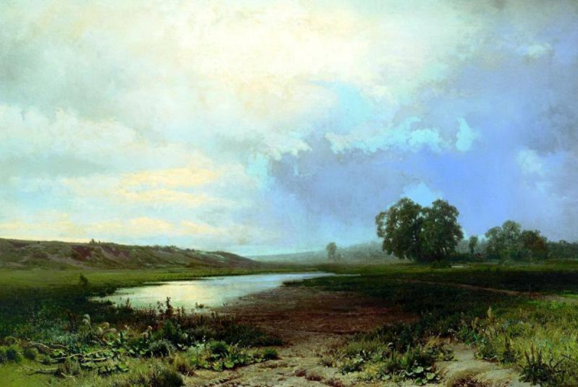
Федор Александрович Васильев. Мокрый луг.