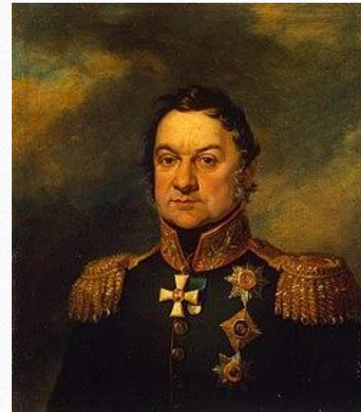
Дми́трий Серге́евич Дохтуро́в - русский военачальник. Во время Отечественной войны 1812 года руководил обороной Смоленска от французов. Под Бородином командовал сначала центром русской армии, а потом левым крылом.