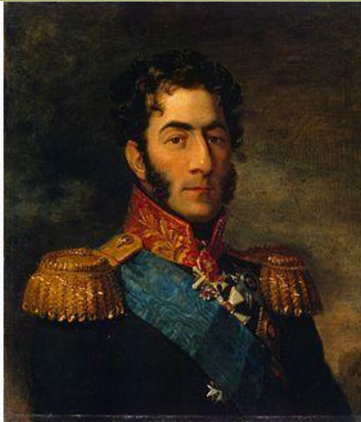
Пётр Ива́нович Багратио́н - русский генералглавнокомандующий 2-й Западной армией в начале Отечественной войны 1812 года.

В красочном образе безымянного полковника, могут прочитываться черты личности Петра Багратиона, раненного на поле боя, а затем и генерала Дмитрия Дохтурова.