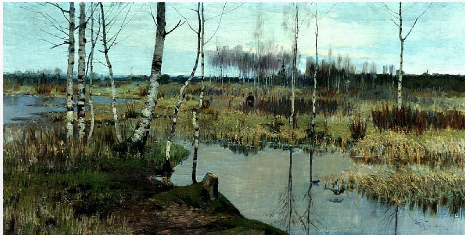
БЕРГГОЛЬЦ Ричард - Весенний пейзаж