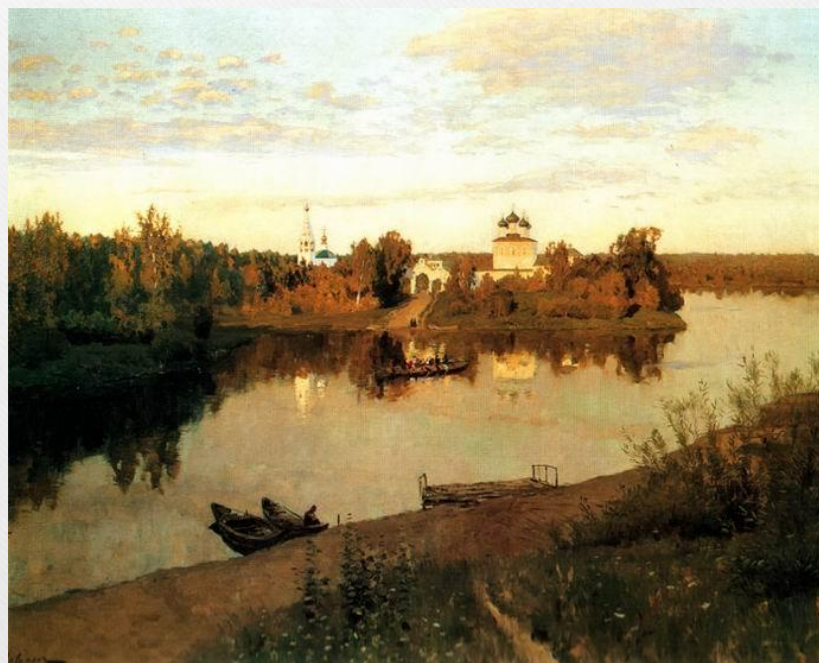
Исаак Левитан – Вечерний звон