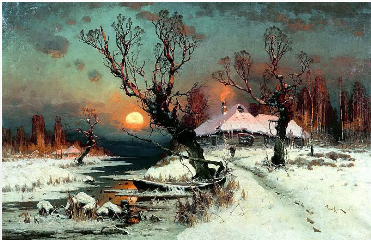
КЛЕВЕР Юлий - Закат солнца зимой