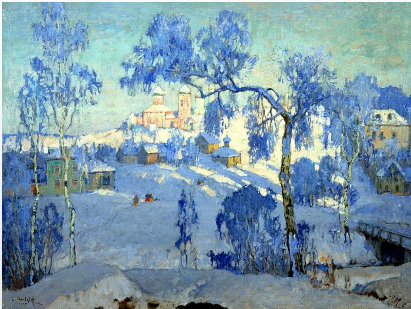
ГОРБАТОВ Константин - Зимний пейзаж с церковью.