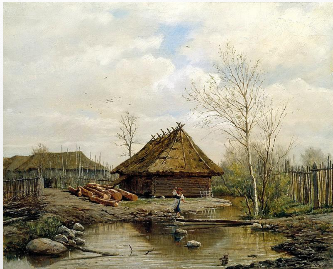
БРЮЛЛОВ Павел - Весна