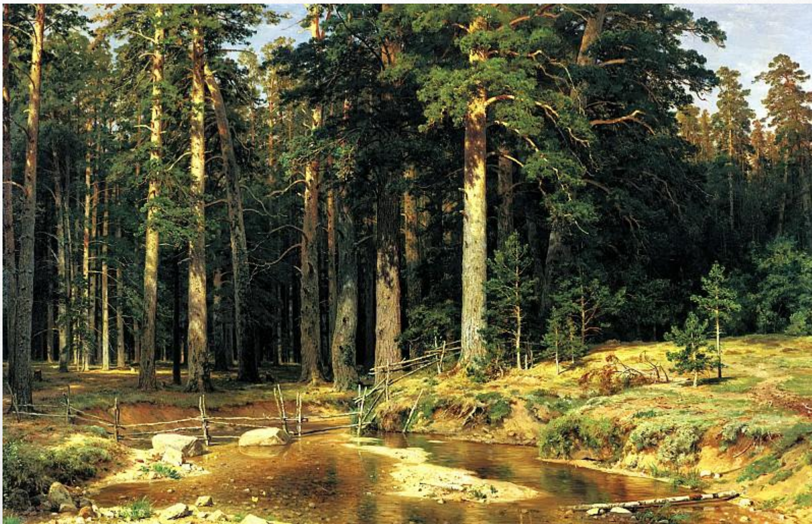
ШИШКИН Иван - Корабельная роща