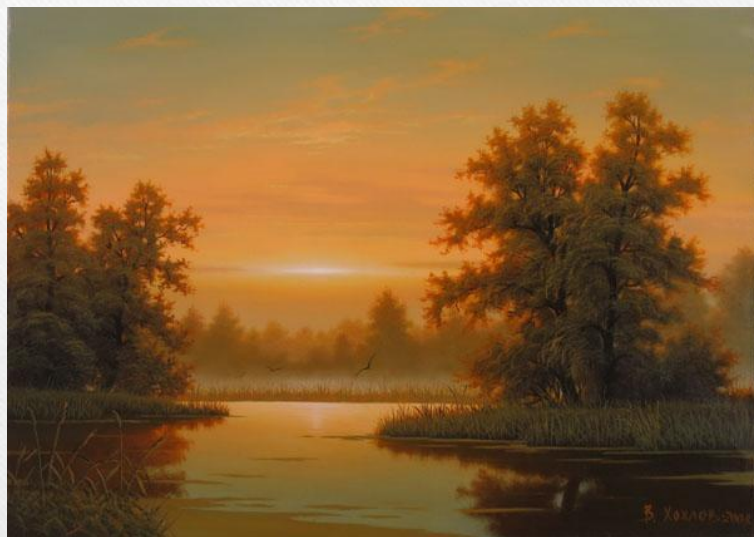
Владимир Хохлов Летний вечер

Последние лучи заката Лежат на поле сжатой ржи. Дремотой розовой объята Трава некошенной межи.