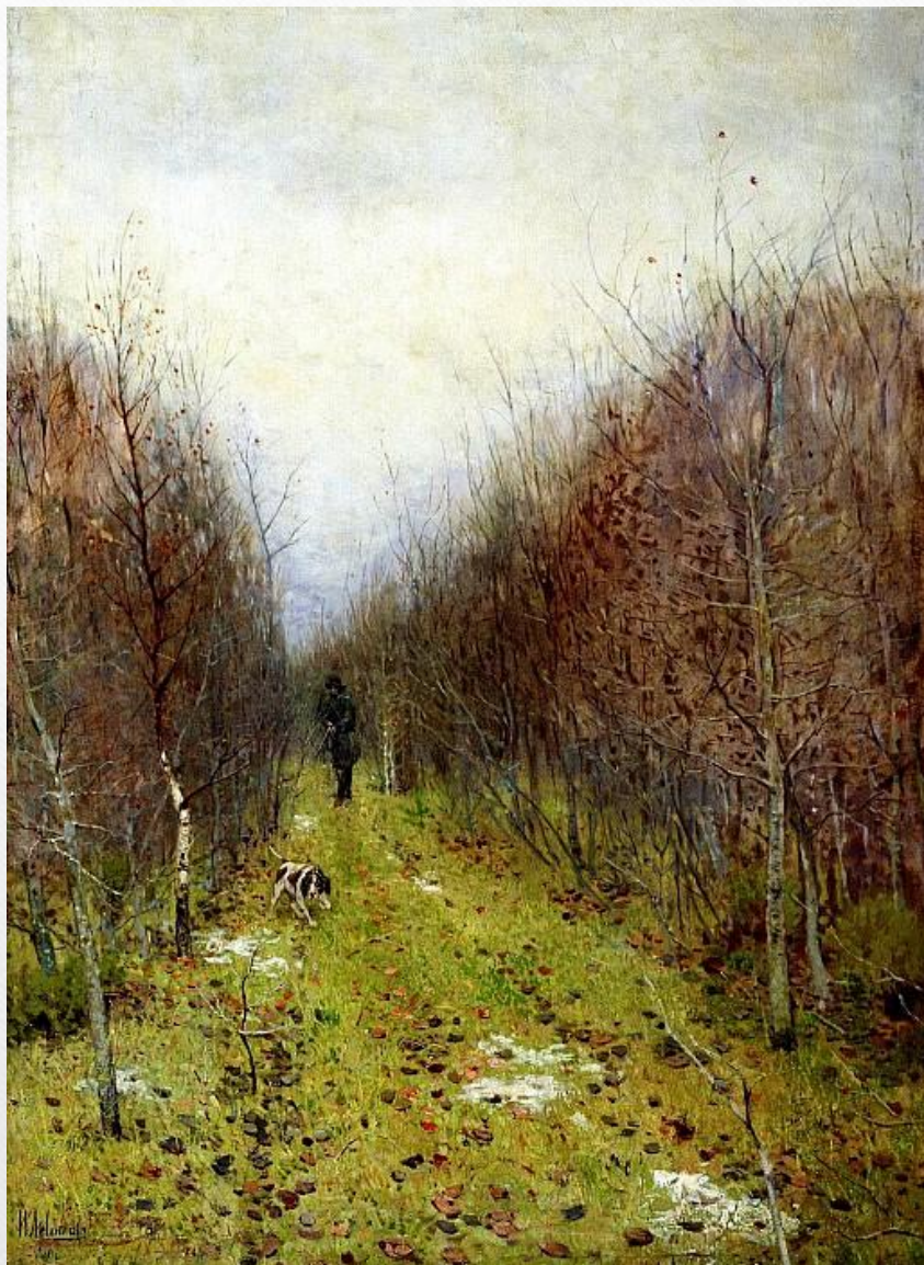
ЛЕВИТАН Исаак - Осенний пейзаж