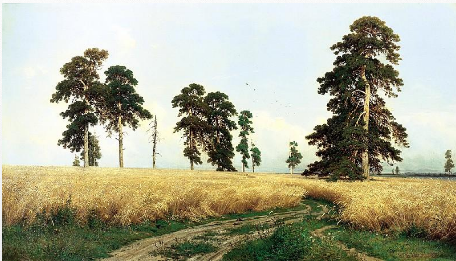
ШИШКИН Иван - Рожь