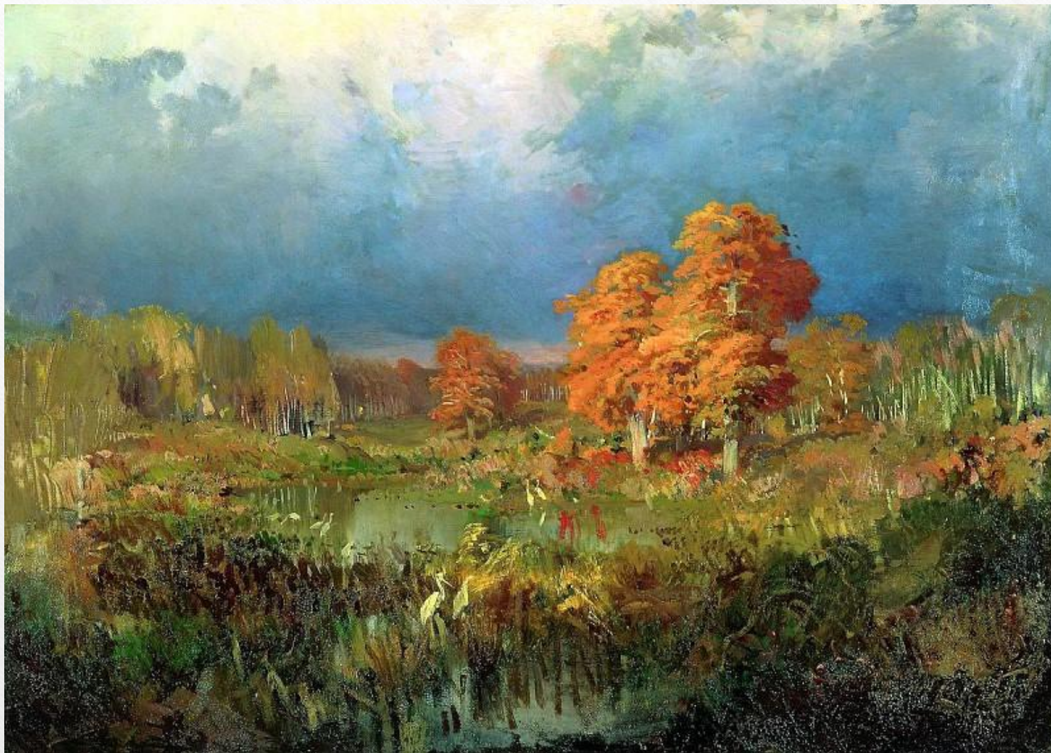
ВАСИЛЬЕВ Фёдор - Болото в лесу. Осень