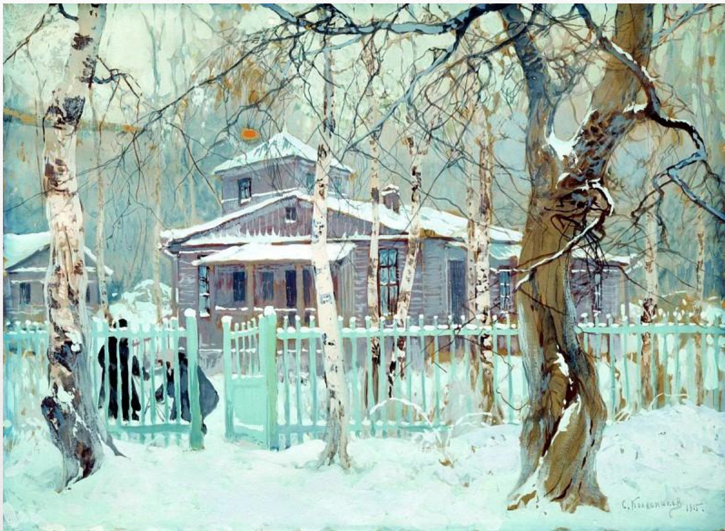
КОЛЕСНИКОВ Степан - Зимний пейзаж