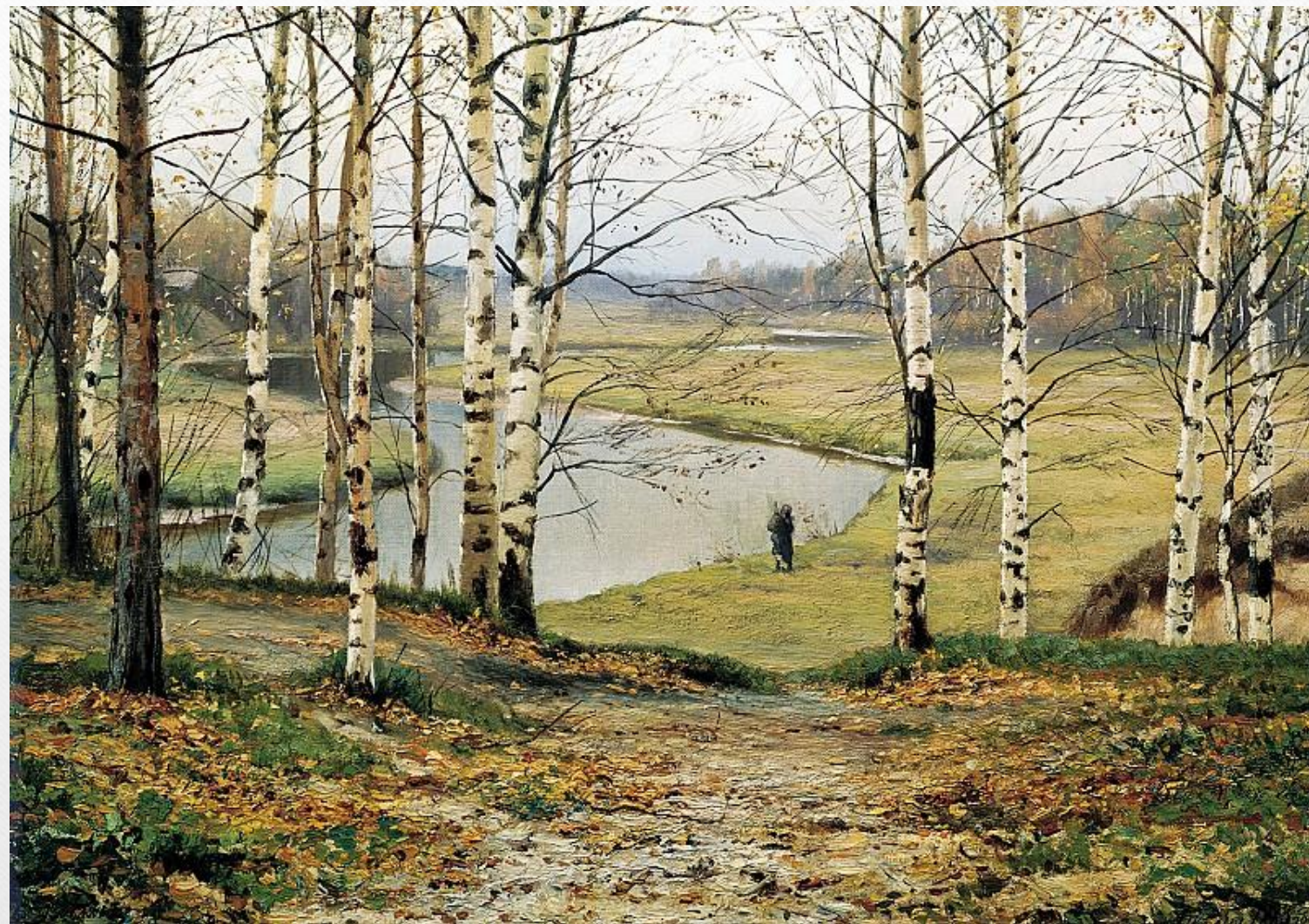
ВОЛКОВ Ефим - Октябрь