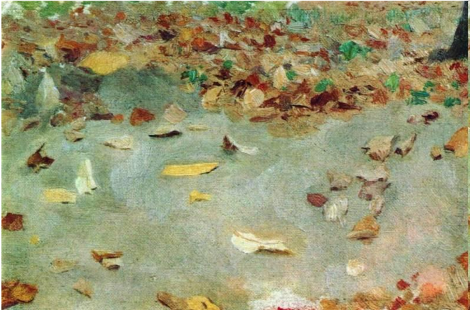
Левитан Исаак: Осенние листья.