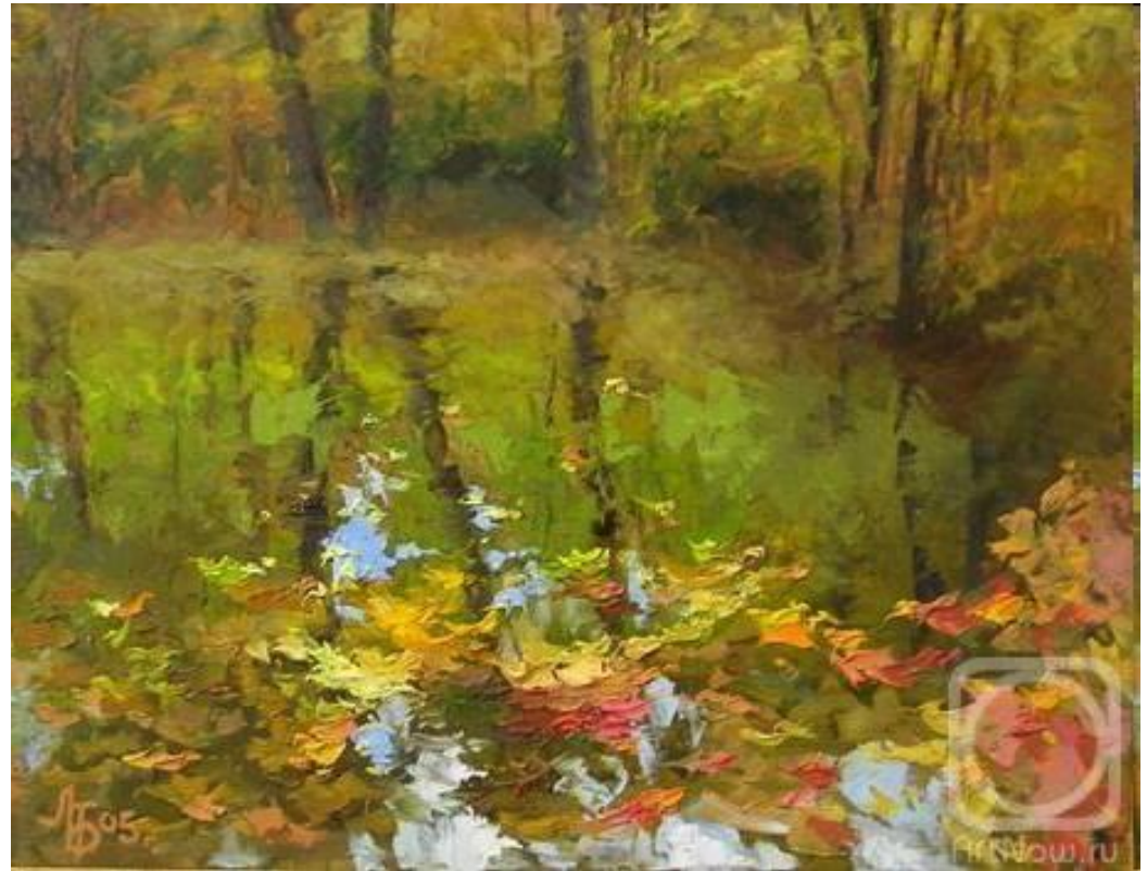
"Осенние листья в пруду". Болотская Людмила.