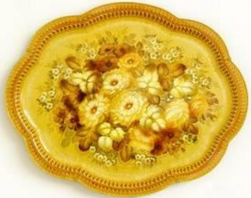
Художник - Домникова М. Е. Жостовский поднос "Осенний мотив".