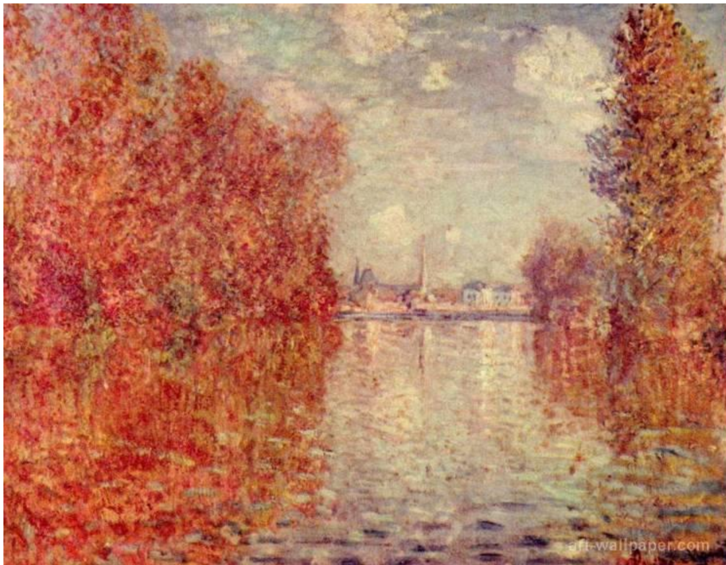
Клод Моне - Осенняя река.