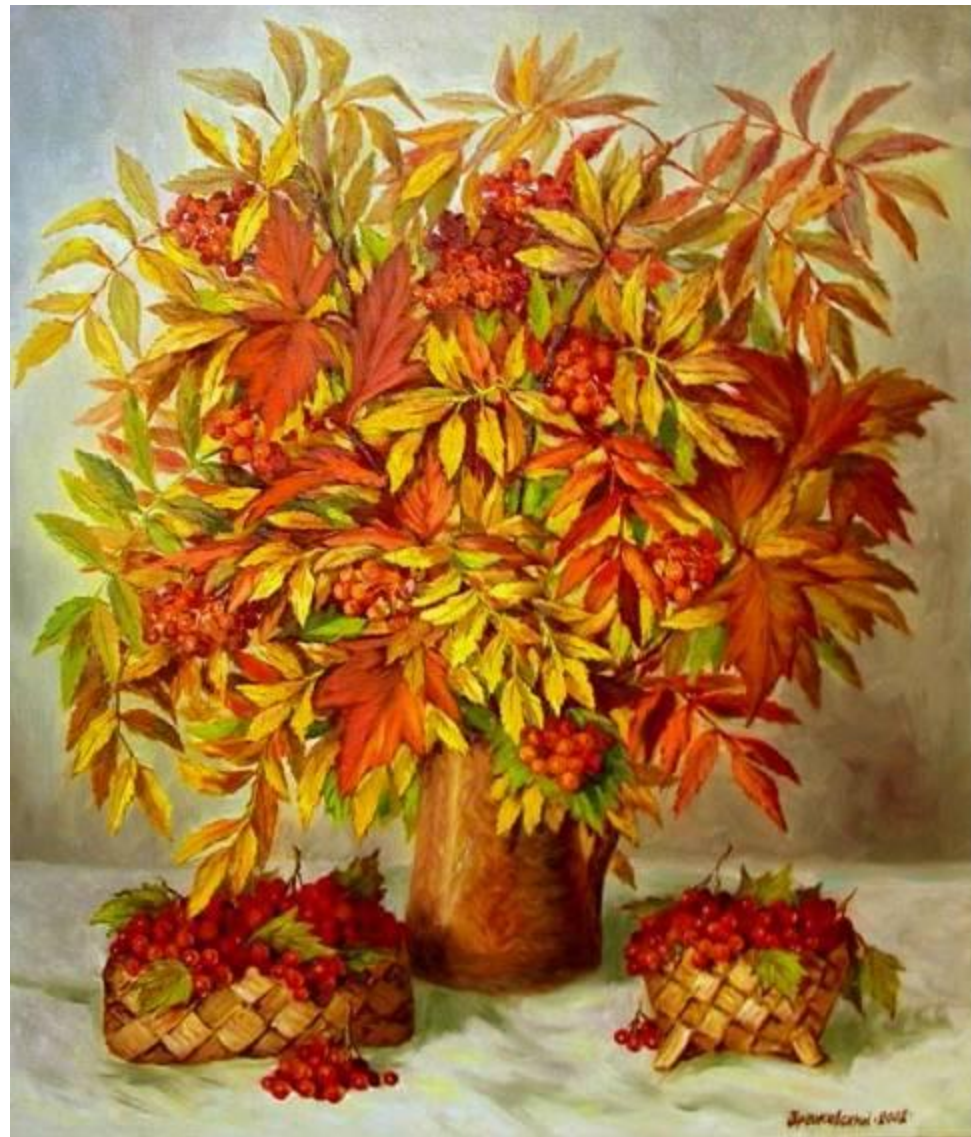
Аркадий Зражевский. Листья рябины.