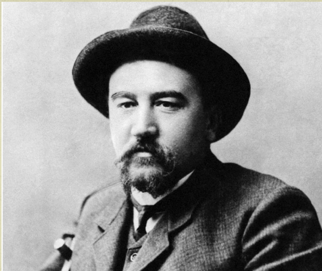
Александр Иванович Куприн