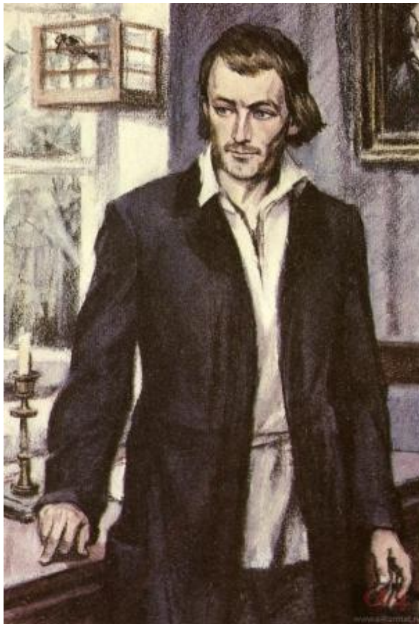
Художник Давид Львович Боровский- Бродский