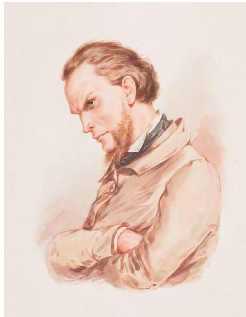
Художник Пётр Михайлович Боклевский