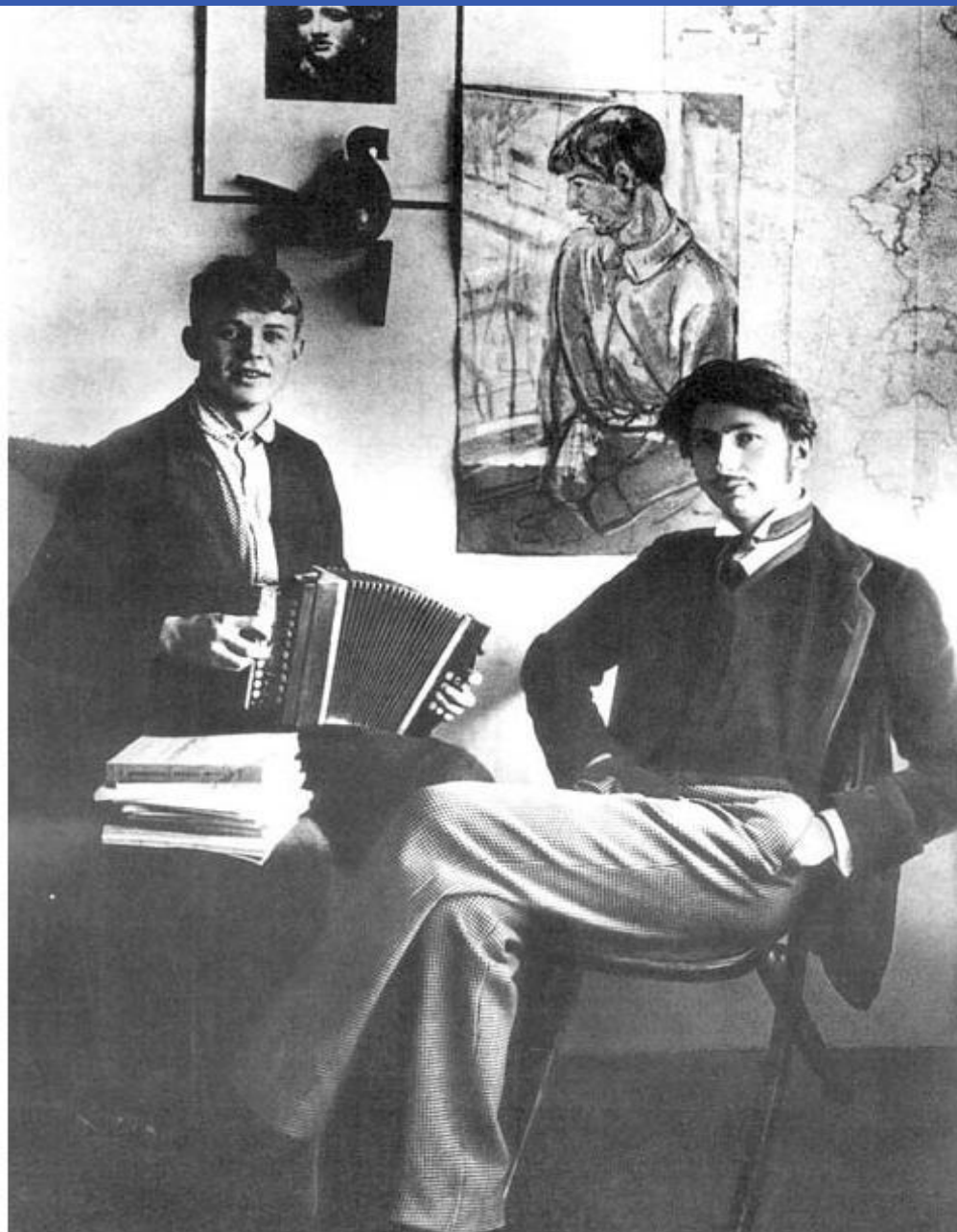
Сергей Есенин и Сергей Городецкий, фото - 1919.