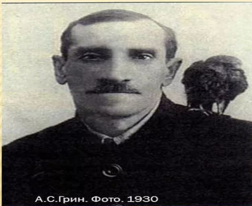
А.С.Грин. Фото. 1930

«Александра Грина отличали дар могучего воображения, чистота чувств и застенчивая улыбка» (К.Паустовский).