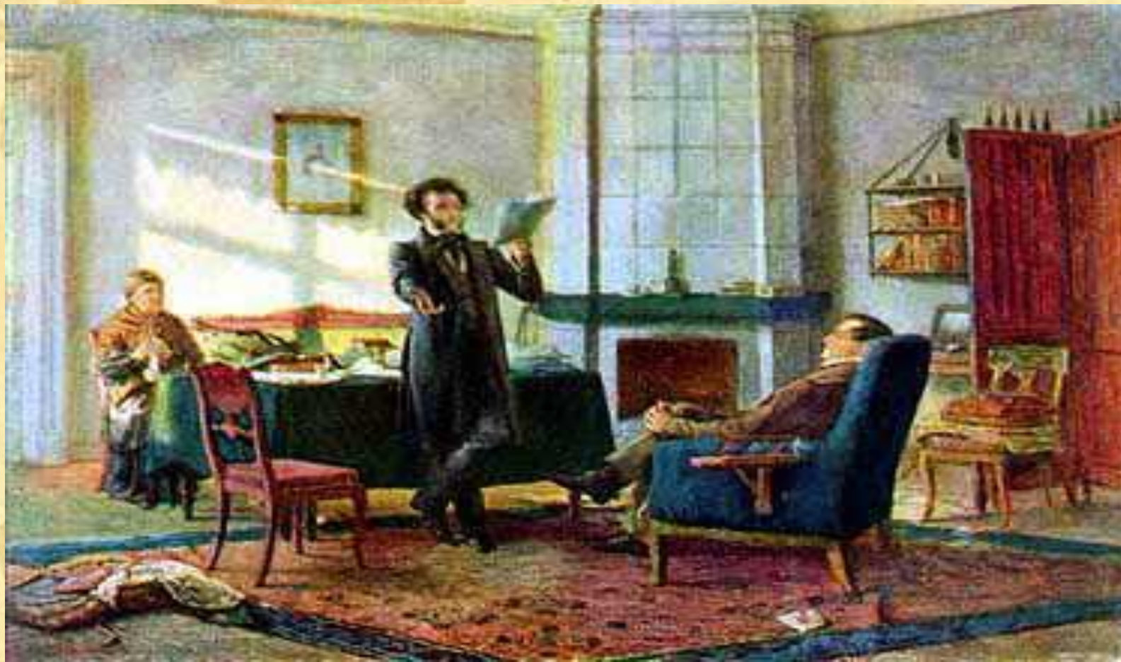
Пушкин в селе Михайловском (Пушкин у Пушкина). Н.Н. Ге. 1875 г.

Там его навещают близкие друзья. Он им читает свои стихи. А рядом – любимая няня.