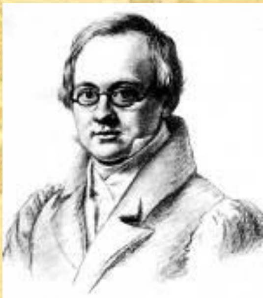
Антон Антонович Дельвиг