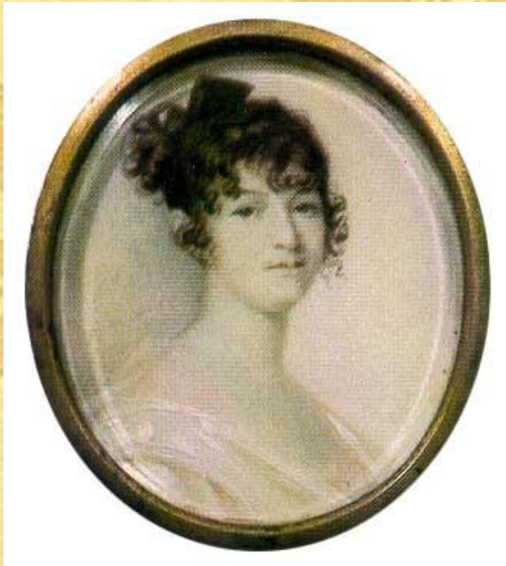
Н.О. Пушкина. 1800-е гг.

Мать, Надежда Осиповна , приходилась внучкой арапу Петра I, впоследствии русскому генералу Ганнибалу.