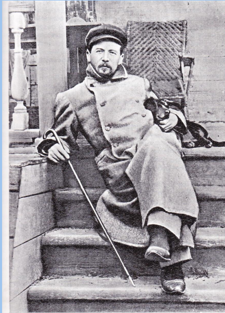
А. П. Чехов на крыльце дома в Мелихове