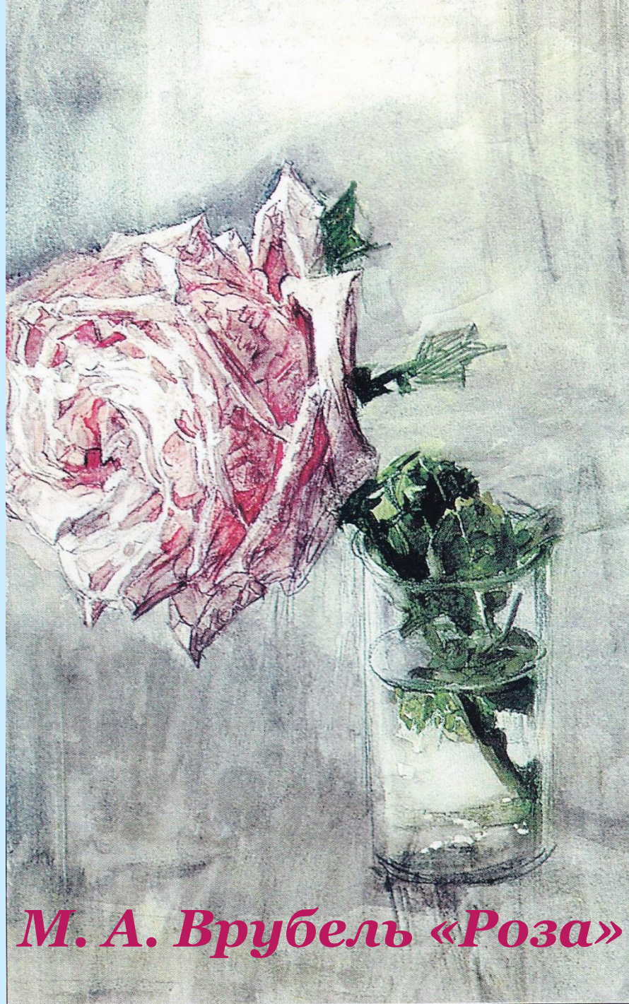
М. А. Врубель «Роза»