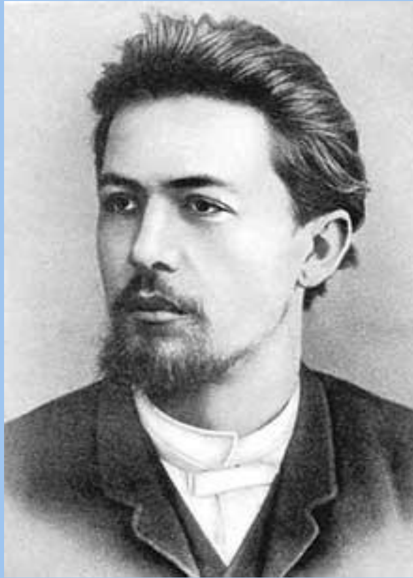
А. П. Чехов