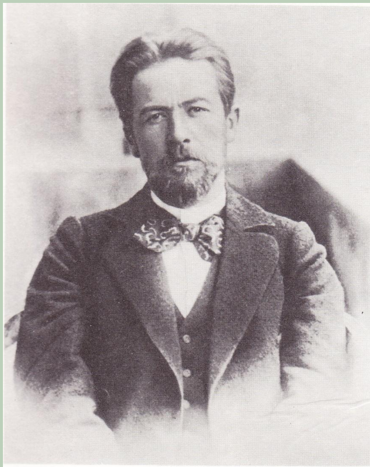
А. П. Чехов в 1890-е годы