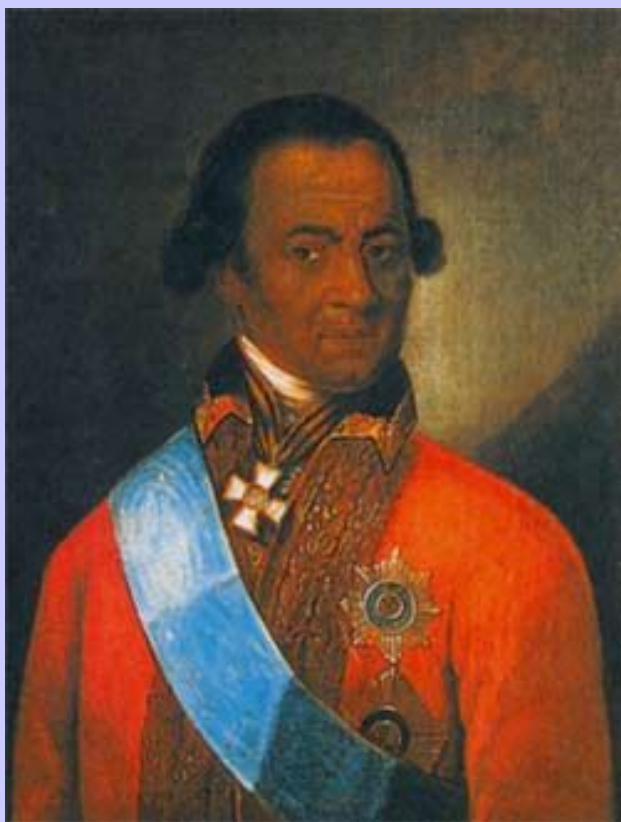
Прадед Александра Сергеевича — знаменитый «арап» Ибрагим (Абрам) Ганнибал, крестник Петра Великого. Портрет неизвестного художника

Ганнибал обладал природным умом и выказал недюжинные способности как инженер. Вёл мемуары на французском языке, но уничтожил их. По преданию, возможностью избрать военную карьеру Суворов был обязан Ганнибалу, убедившему отца его уступить наклонностям сына.