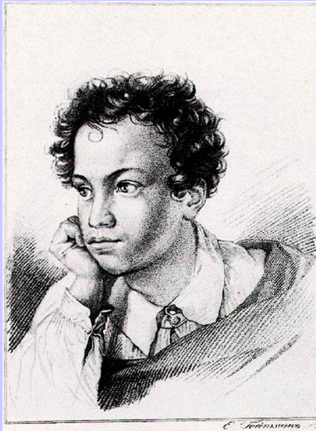
Е. Гейтман. Портрет А.С. Пушкина