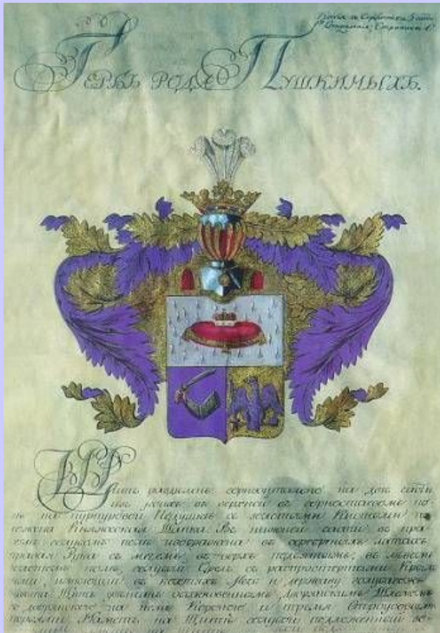
Герб рода Пушкиных

Пушкины — русский дворянский род, происходящий от легендарного выходца «из немец» мужа честна Ратши, современника Александра Невского потомок которого в 7-м колене, Григорий Александрович, прозванный Пушка, был родоначальником Пушкиных. О службе родоначальника ничего неизвестно, но поскольку один из его сыновей был боярином, Григорий был незаурядным служилым человеком, обладавший большими вотчинами. Род достаточно рано разделился на множество ветвей, многие из которых захудали.