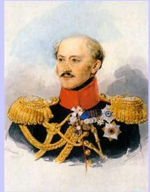
А.Х.Бенкендорф, начальник тайной Полиции. Портрет П.Ф.Соколова

А.С.Пушкин, будучи в то время государственным чиновником, в значительной степени зависел от начальника III Отделения и должен был докладывать о всех своих перемещениях, ведь ему уже сделано строгое замечание за несанкционированную поездку в Москву, резкий выговор за вояж на Кавказ, затем следует известная история с отставкой Пушкина и многие другие унижения.