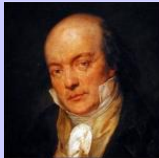
Пьер - Жан Беранже (1780 — 1857) французский поэт и сочинитель сатирических песен.

Идея «Простолюдина»: «Все ж я – отчизны верный сын», «Я дорожу народа счастьем», «На бедняков гляжу с участием», оказалась, видимо, настолько близкой А.С.Пушкину, что даже своей композицией «Моя родословная» схоже произведением Беранже.