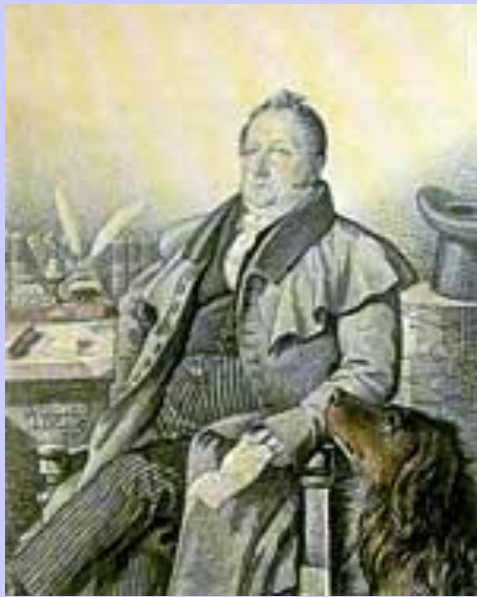
Отец, Сергей Львович Пушкин (1770 - 1838г.)