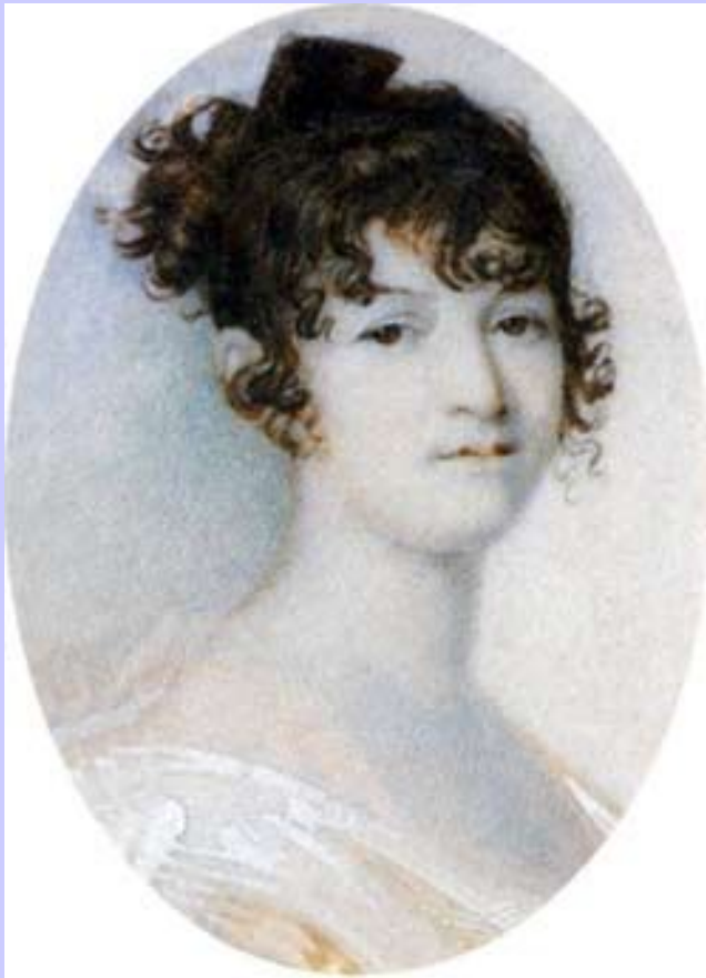
Надежда Осиповна Пушкина, рожд. Ганнибал (1775-1836), мать поэта. Художник Ксавье де Местр. 1800-е гг.

Исследователи отмечают настораживающий факт: во всей поэзии Пушкина нет ни одного прямого упоминания родителей. Да и вообще дом родной он вспоминает очень редко. “Он был человек без детства”, – говорит Юрий Лотман.