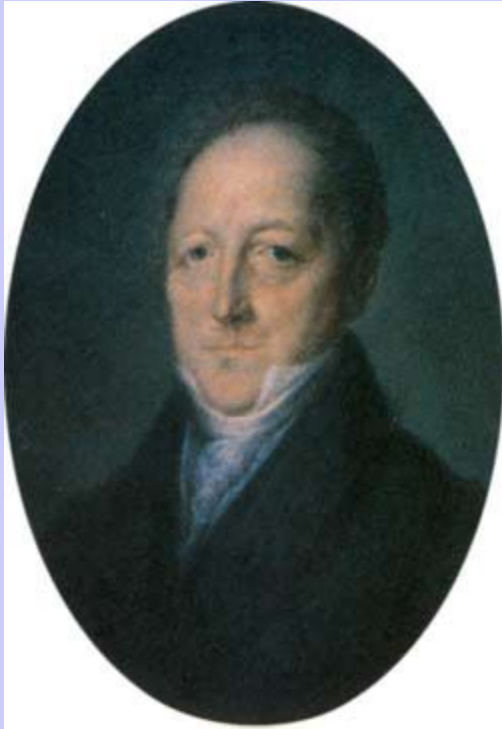
Сергей Львович Пушкин (1770-1848), Неизвестный художник. 1810-е годы

"... Я чрезвычайно дорожу именем моих предков, ЭТИМ единственным наследством, доставшимся мне от них."