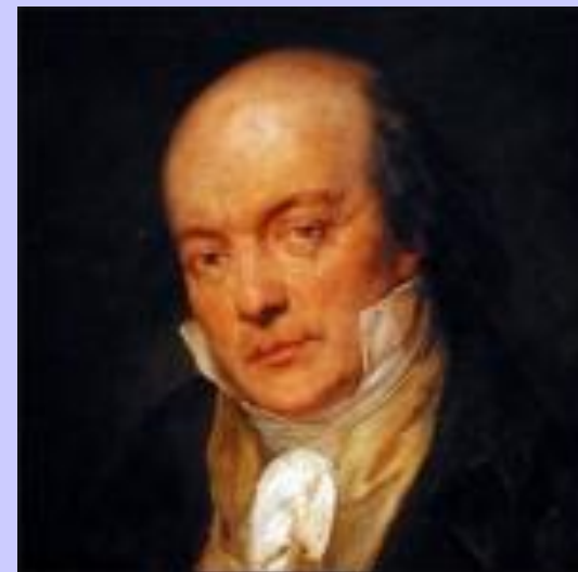
Пьер - Жан Беранже (1780 — 1857) французский поэт и сочинитель сатирических песен.

Идея «Простолюдина»: «Все ж я – отчизны верный сын», «Я дорожу народа счастьем», «На бедняков гляжу с участием», оказалась, видимо, настолько близкой А.С.Пушкину, что даже своей композицией «Моя родословная» схоже произведением Беранже.