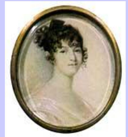
Мать, Надежда Осиповна Пушкина (1775-1836г.)