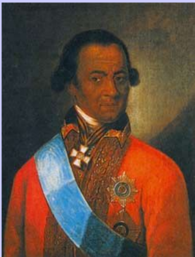
Прадед Александра Сергеевича — знаменитый «арап» Ибрагим (Абрам) Ганнибал, крестник Петра Великого. Портрет неизвестного художника

Ганнибал обладал природным умом и выказал недюжинные способности как инженер. Вёл мемуары на французском языке, но уничтожил их. По преданию, возможностью избрать военную карьеру Суворов был обязан Ганнибалу, убедившему отца его уступить наклонностям сына.