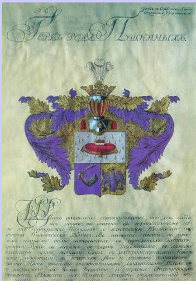
Герб рода Пушкиных

Пушкины — русский дворянский род, происходящий от легендарного выходца «из немец» мужа честна Ратши, современника Александра Невского потомок которого в 7-м колене, Григорий Александрович, прозванный Пушка, был родоначальником Пушкиных. О службе родоначальника ничего неизвестно, но поскольку один из его сыновей был боярином, Григорий был незаурядным служилым человеком, обладавший большими вотчинами. Род достаточно рано разделился на множество ветвей, многие из которых захудали.