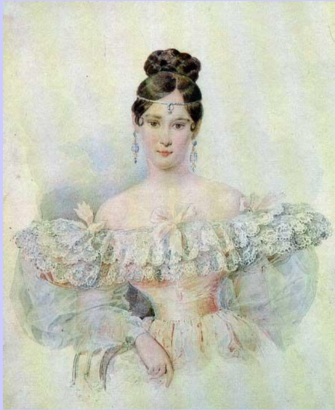
Наталья Николаевна Пушкина, жена поэта. Акварель А.П.Брюллова. 1831 – 1832 гг.

Почти в 30 – летнем возрасте, став взрослым человеком, Пушкин попытался создать семью такой, какой она соответствовала его представлениям о доме, тепле, красоте и чести. Свою будущую жену, Наталью Гончарову, поэт встретил в декабре 1828 года, а в апреле 1829 сделал ей предложение. Ответ матери Гончаровой был неопределённым: ни да, ни нет. 6 апреля 1830 года Пушкин сделал предложение во второй раз, согласие на брак было получено