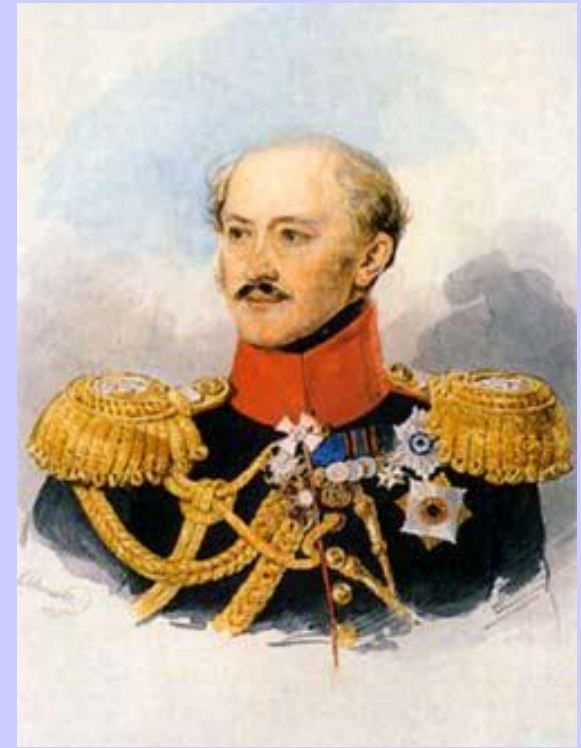
А.Х.Бенкендорф, начальник тайной Полиции. Портрет П.Ф.Соколова

А.С.Пушкин, будучи в то время государственным чиновником, в значительной степени зависел от начальника III Отделения и должен был докладывать о всех своих перемещениях, ведь ему уже сделано строгое замечание за несанкционированную поездку в Москву, резкий выговор за вояж на Кавказ, затем следует известная история с отставкой Пушкина и многие другие унижения.