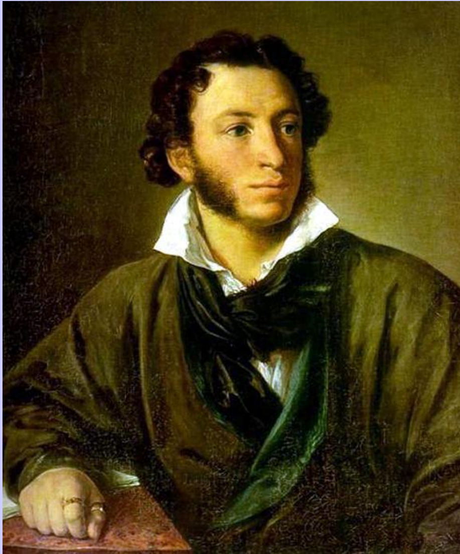
Александр Пушкин, портрет работы В. А. Тропинина. 1827