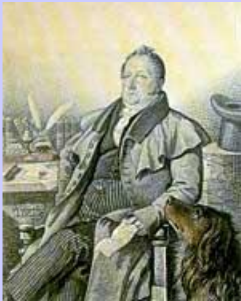
Отец, Сергей Львович Пушкин (1770 - 1838г.)