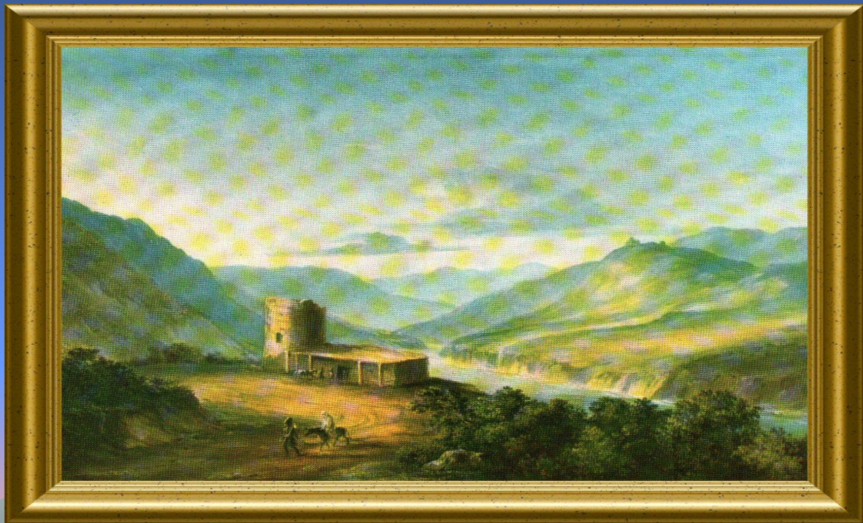
М.Ю. Лермонтов 1837 г.