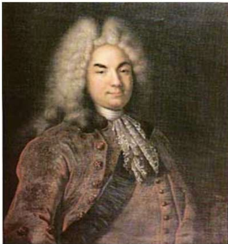
Портрет графа Петра Андреевича Толстого.

Неизвестный русский художник XVIII в. Холст, масло.