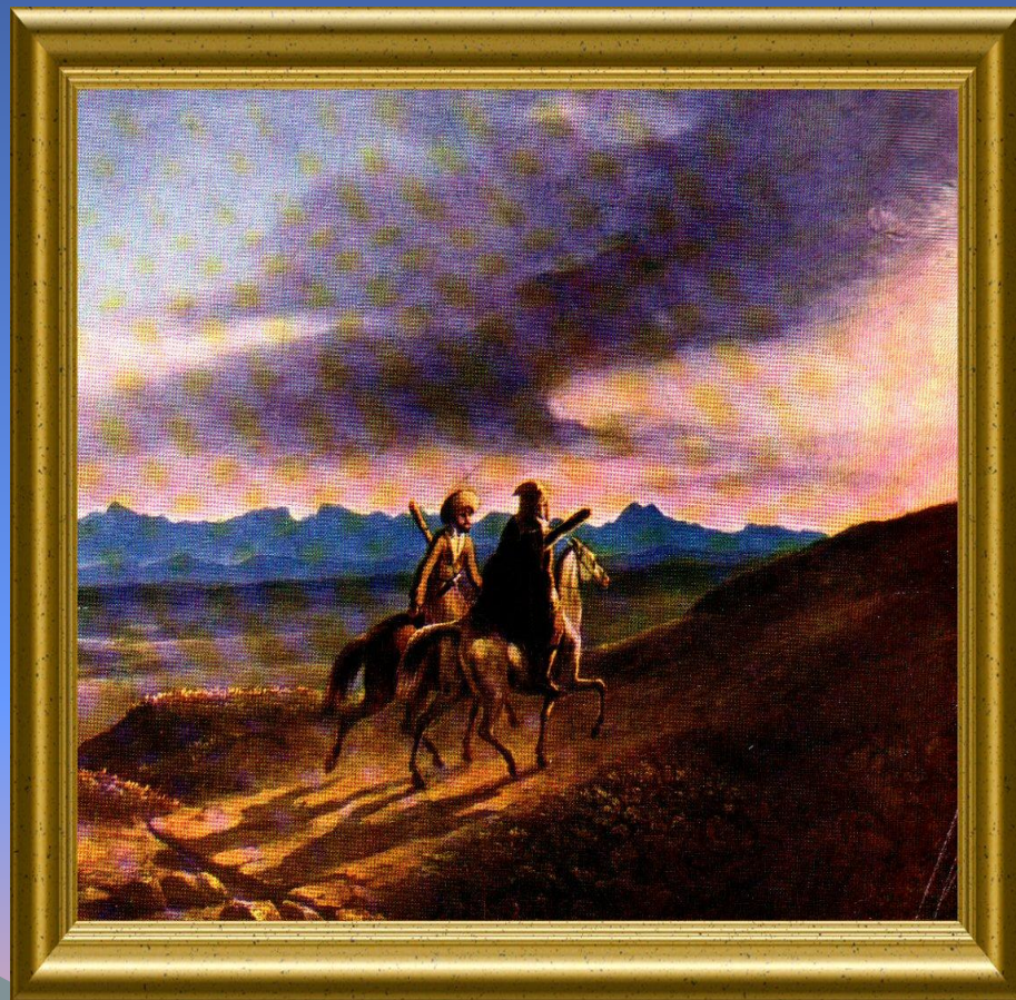
Воспоминание о Кавказе 1838 г.