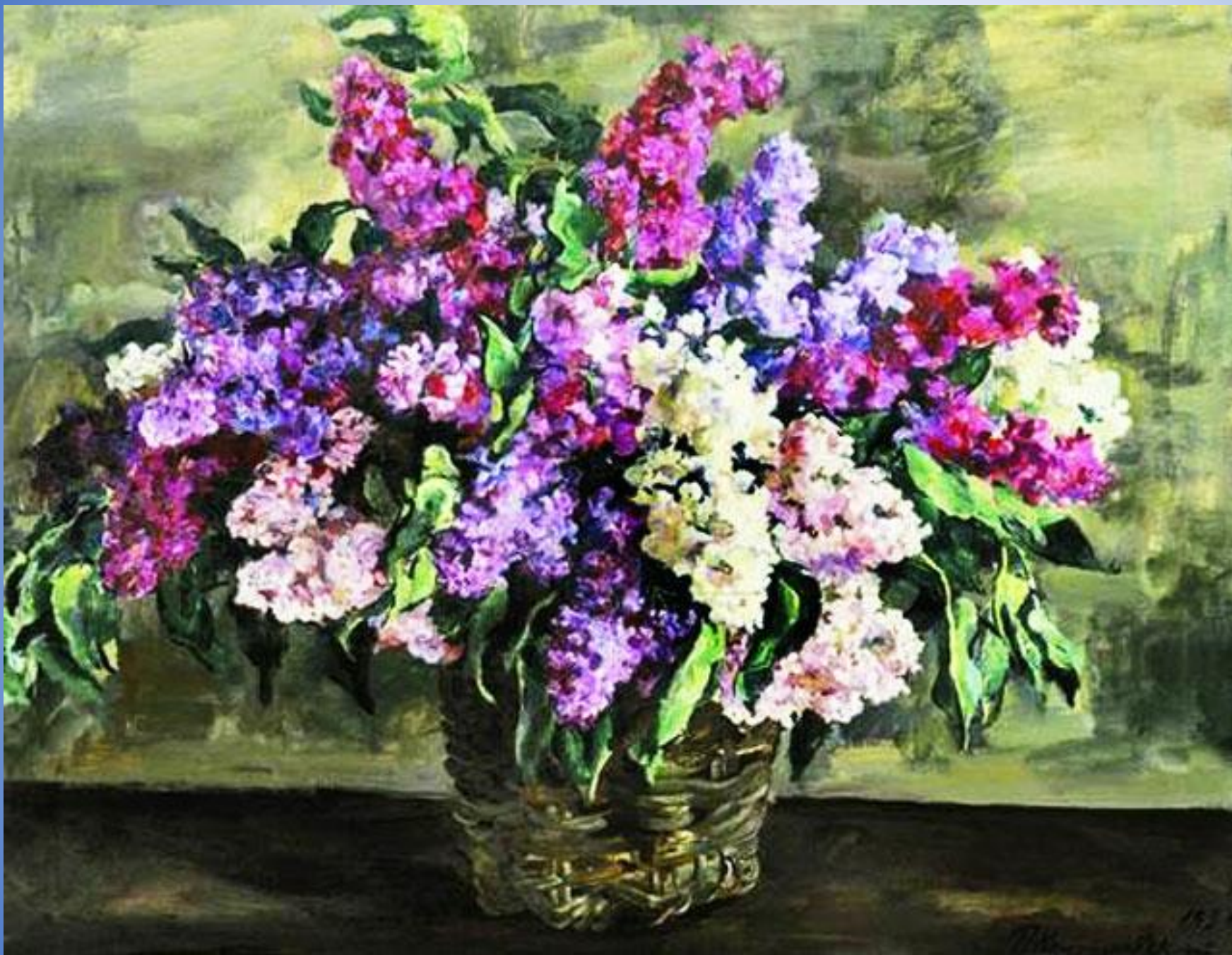
Пётр Кончаловский (1876-1956)