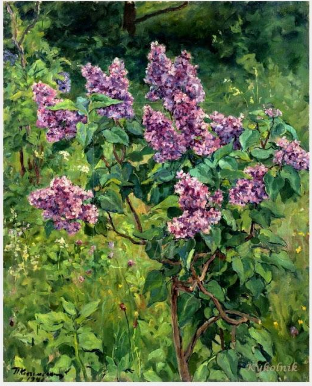
«Куст сирени» 1941 год