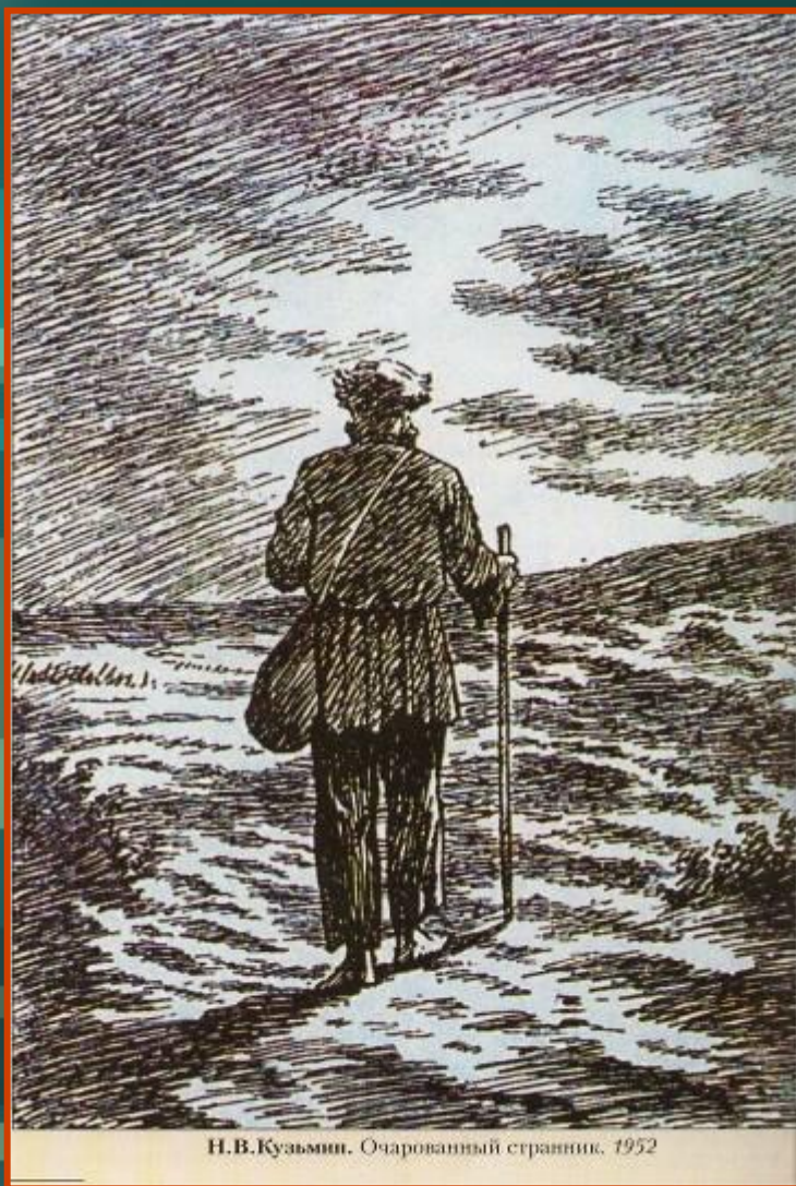
Н.В.Кузьмин. Очарованный странник. 1952

Вся жизнь Флягина прошла в пути, он странник, и странствия его ещё далеко не закончены. Его жизненный путь – путь к вере, к тому миропониманию и душевному состоянию, в котором мы видим героя на последних страницах повести: