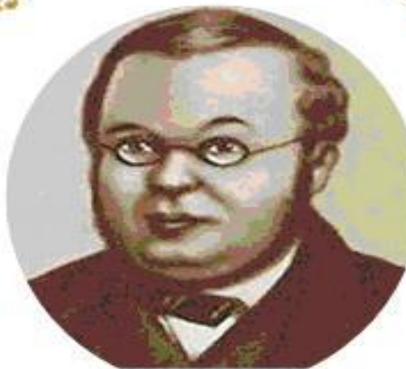
П.П. Ершов 1815 - 1869

П. П. ЕРШОВ (1815—1869) ПЕТР ПАВЛОВИЧ ЕРШОВ РОДИЛСЯ 22 ФЕВРАЛЯ (6 МАРТА) 1815 ГОДА В ДЕРЕВНЕ БЕЗРУКОВО ТОБОЛЬСКОЙ ГУБЕРНИИ ИШИМСКОГО УЕЗДА В СЕМЬЕ ЧИНОВНИКА. ДЕТСКИЕ ГОДЫ БУДУЩЕГО ПОЭТА ПРОШЛИ В ГОРОДЕ БЕРЕЗОВО.