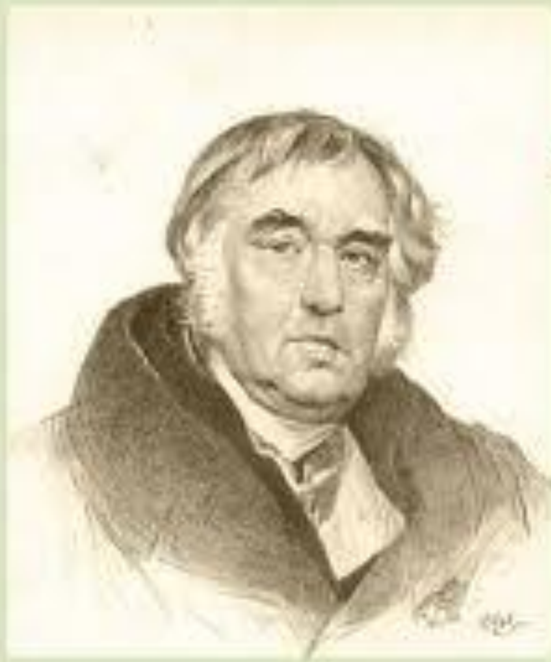
Иван Андреевич Крылов