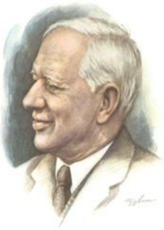
Корней Иванович Чуковский [1882—1969]

Корней Иванович Чуковский (имя при рождении — Николай Васильевич Корнейчуков, 19 (31) марта 1882, Санкт-Петербург — 28 октября 1969, Москва) — русский и советский поэт, публицист, критик, также переводчик и литературовед, известен в первую очередь детскими сказками в стихах и прозе. Отец писателей Николая Корнеевича Чуковского и Лидии Корнеевны Чуковской.