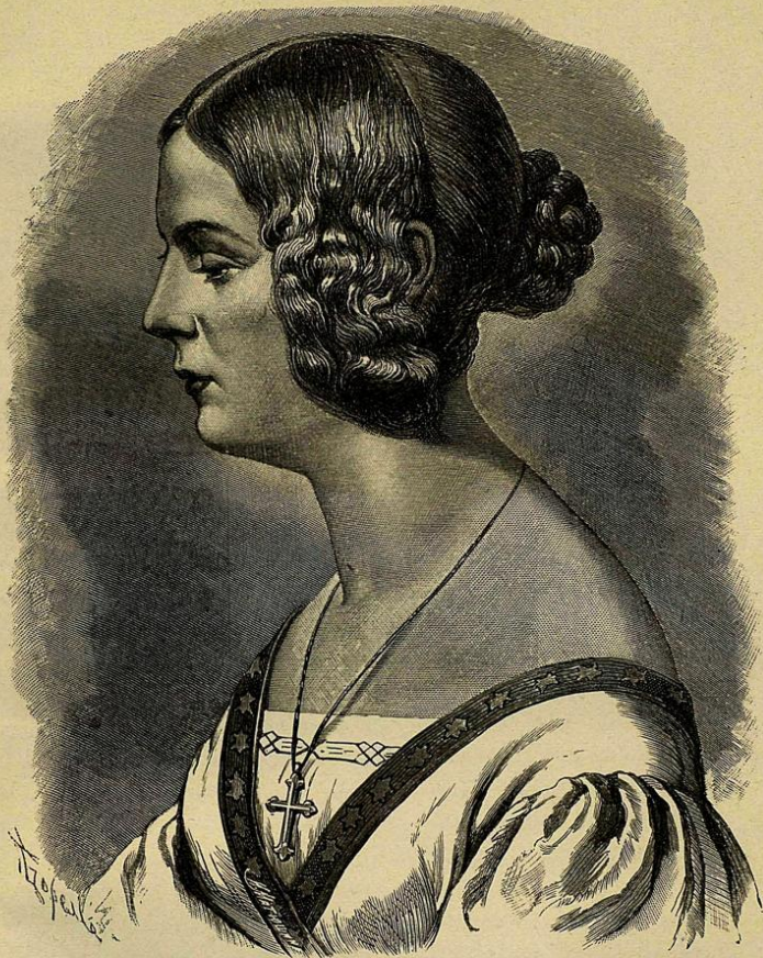
ЕЛИСАВЕТА АЛЕКСѢВНА ЖУКОВСКАЯ, рожд. Рейтернъ, СУПРУГА ПОВТА В. А. ЖУКОВСКАГО.