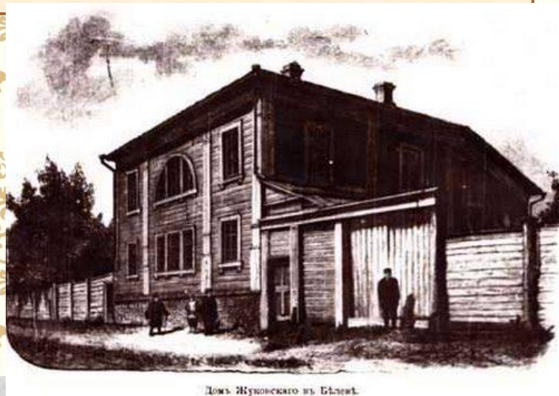
Дом Жуковского в Бѣлзѣ.