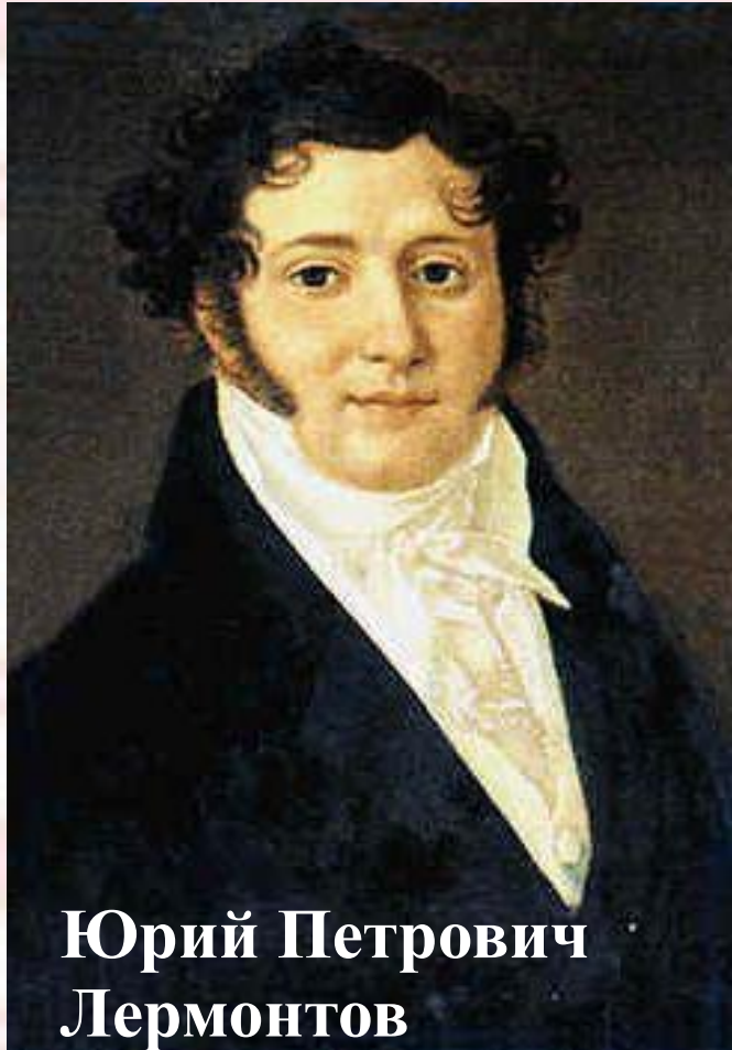
Юрий Петрович Лермонтов