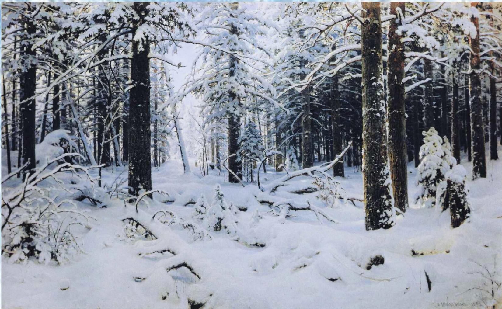
И.И. Шишкин «Зима»