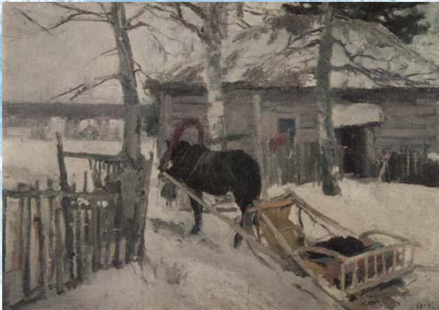
К.А. Коровин «Зимой»