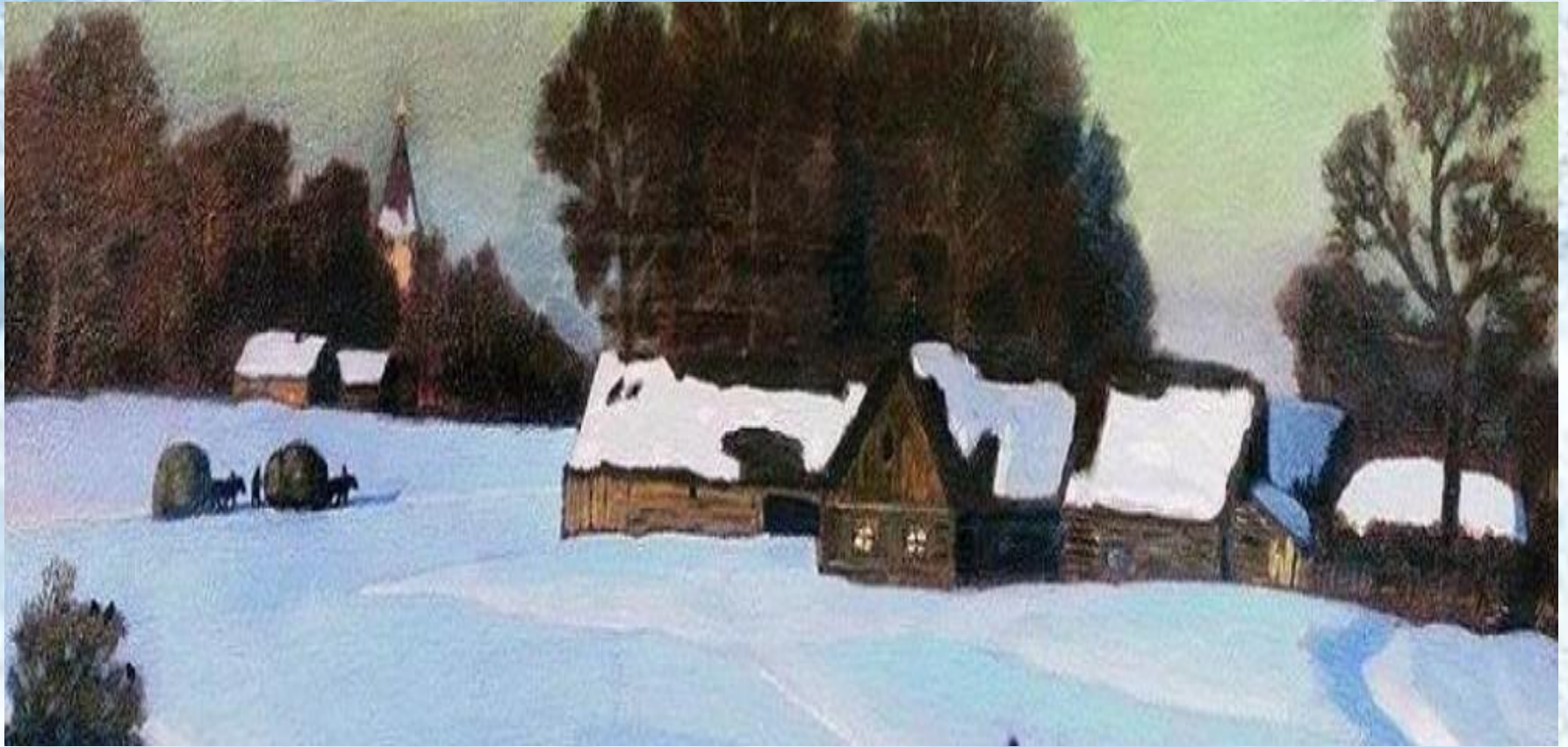
Н.П. Крымов «Зимний вечер»