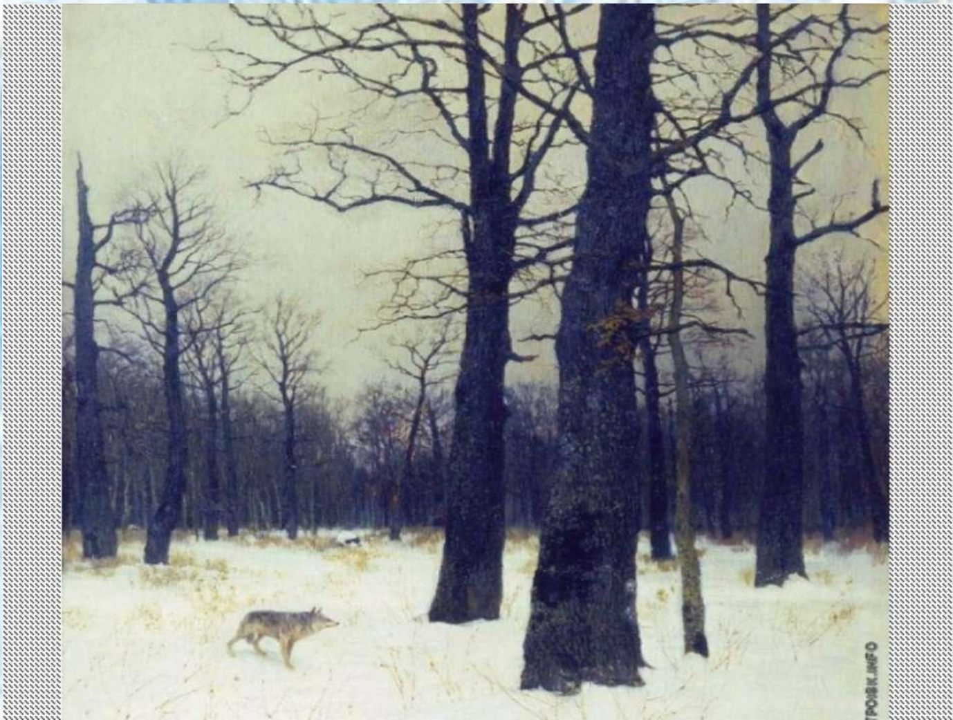
И.И. Левитан «Зима в лесу»