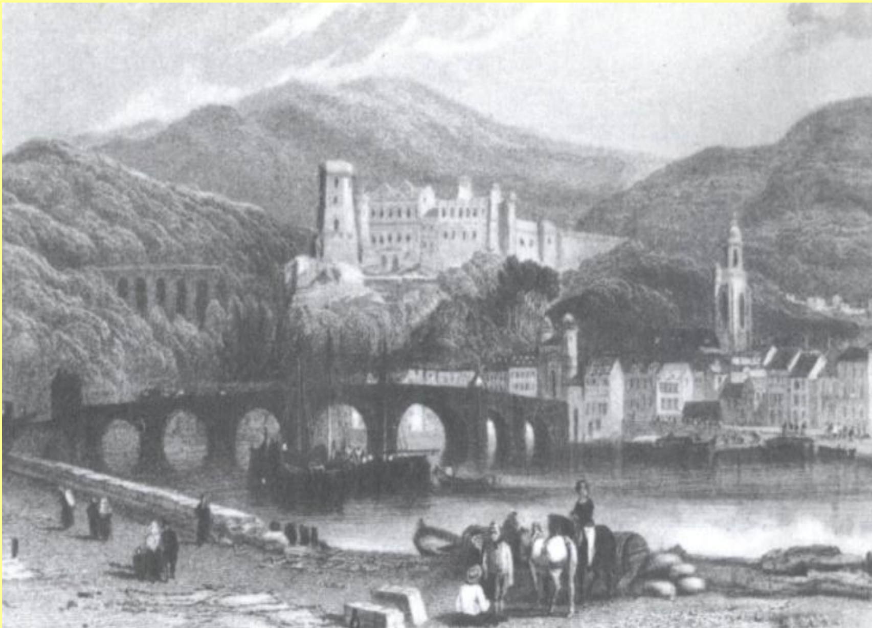
Старинный замок на берегу Рейна.