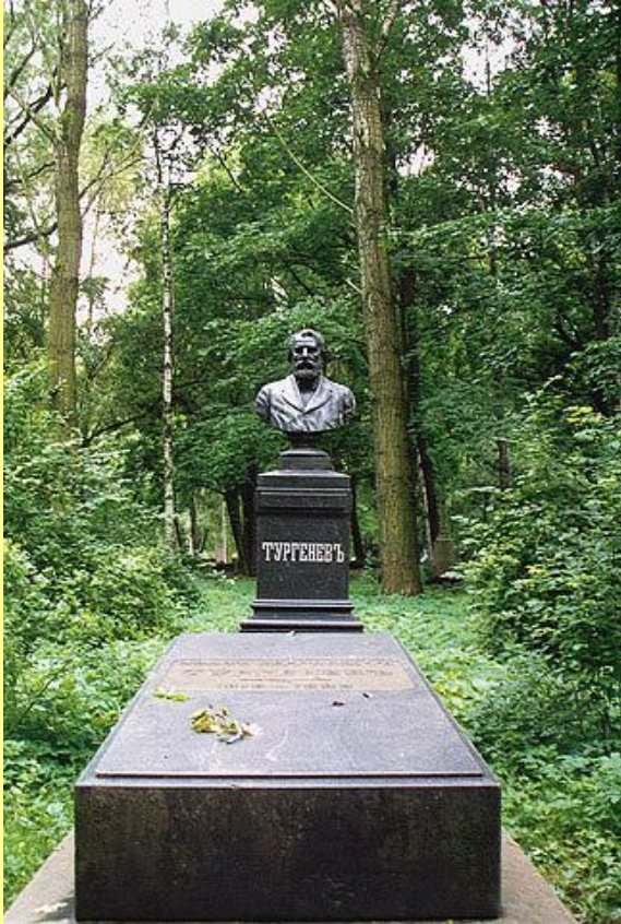
Памятник на могиле Тургенева.