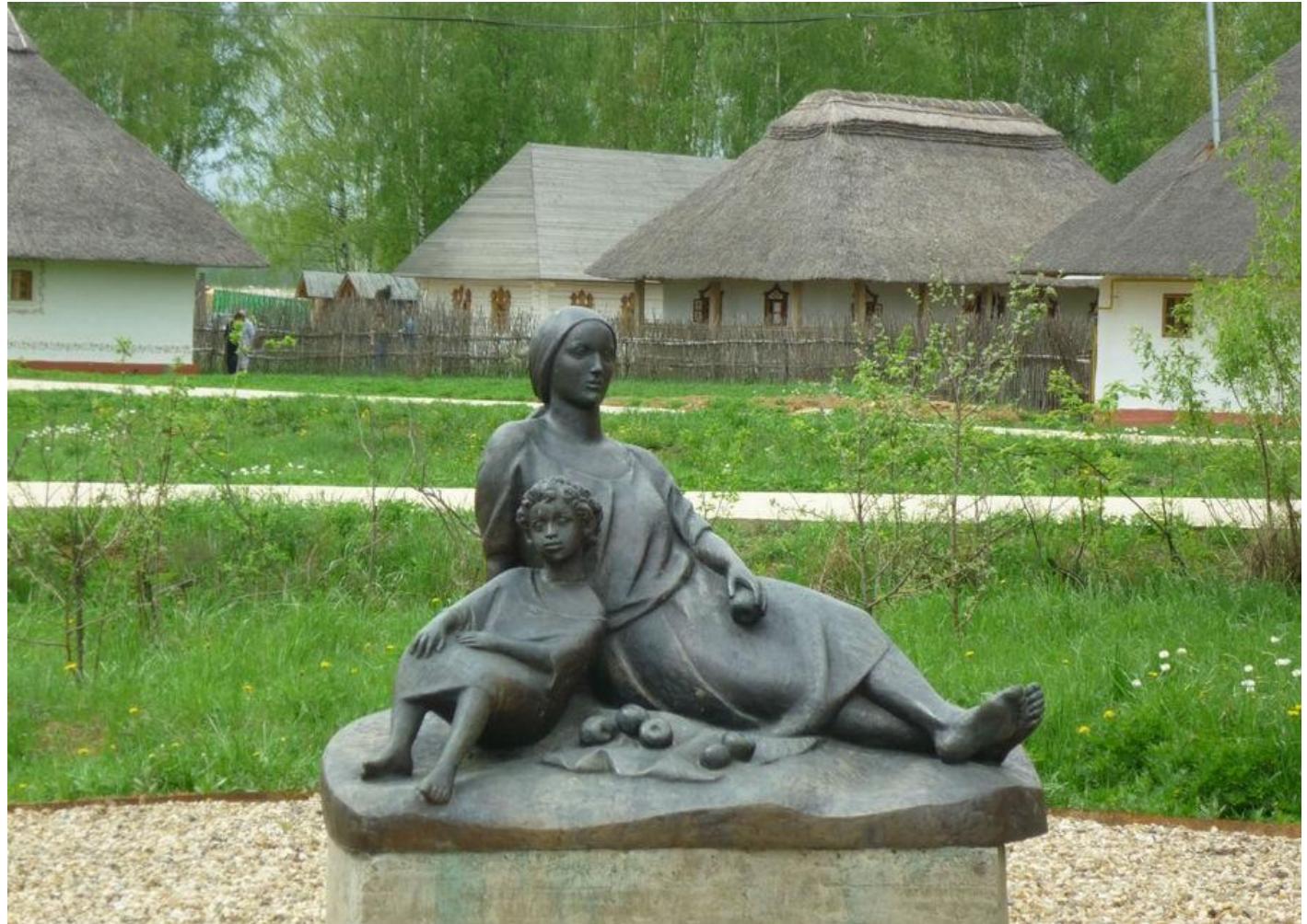
Памятник А. С. Пушкину и его няне Арине Родионовне в музее-заповеднике «Болдино»

«Если грядущее поколение будет чтить мое имя, должна быть не забыта и эта бедная старушка».