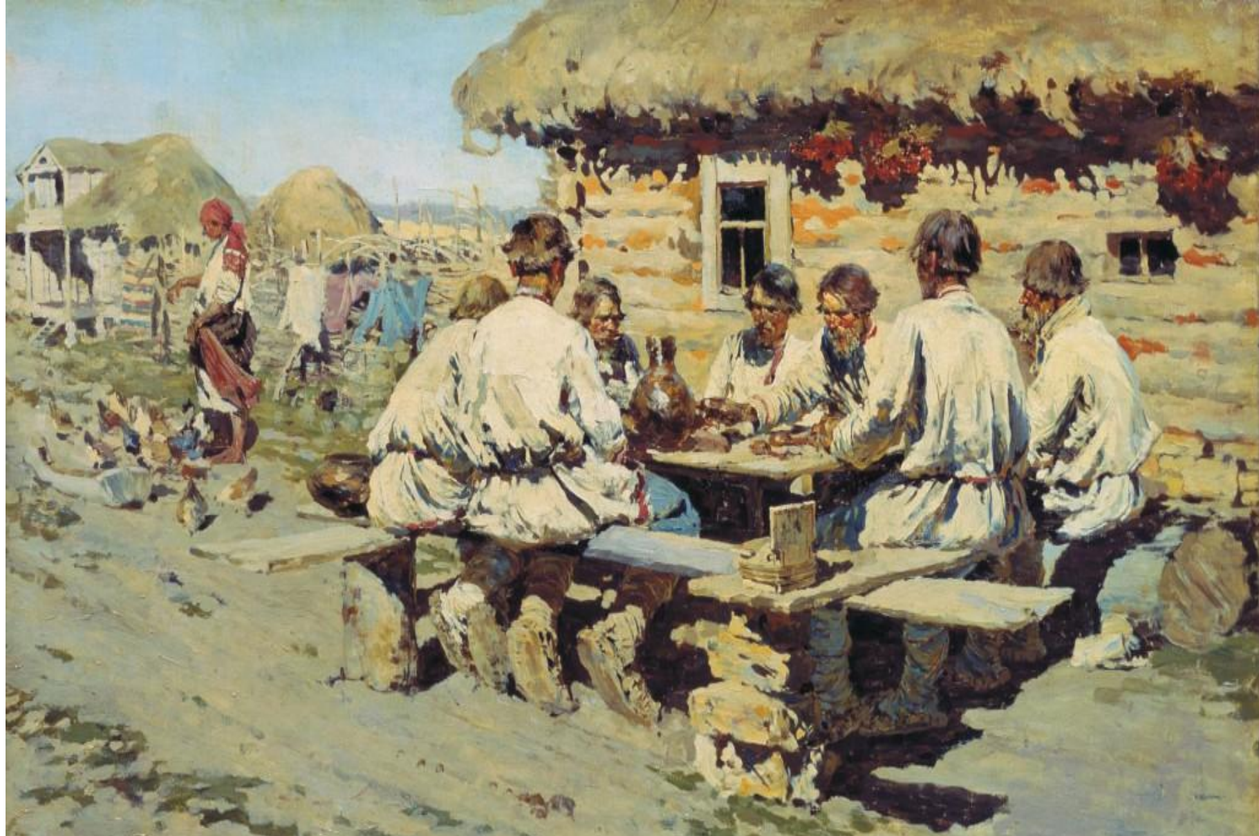
Отдых крестьян Худ. Виноградов С.А.