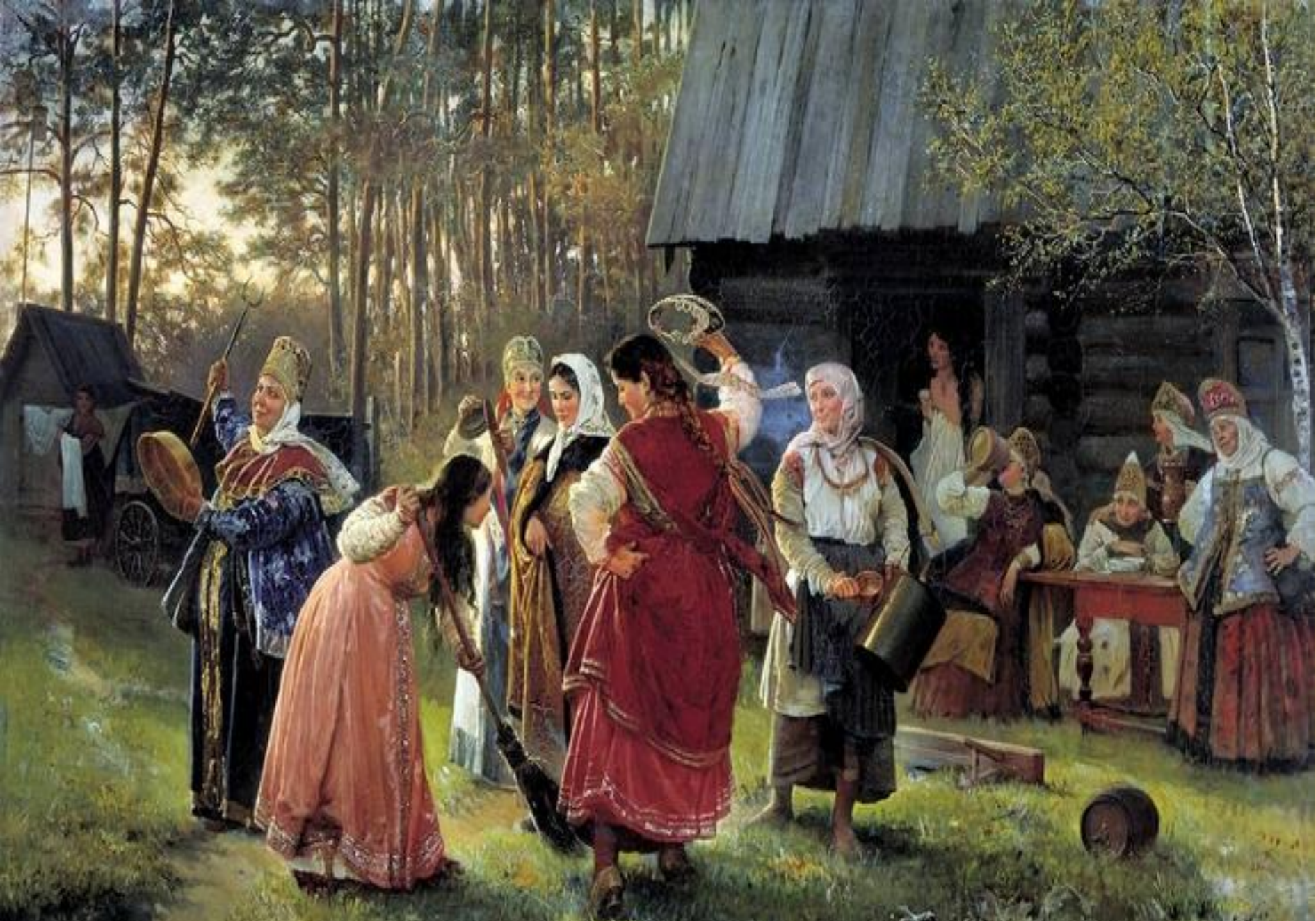
Девичник 1889г. Худ. Корзухин