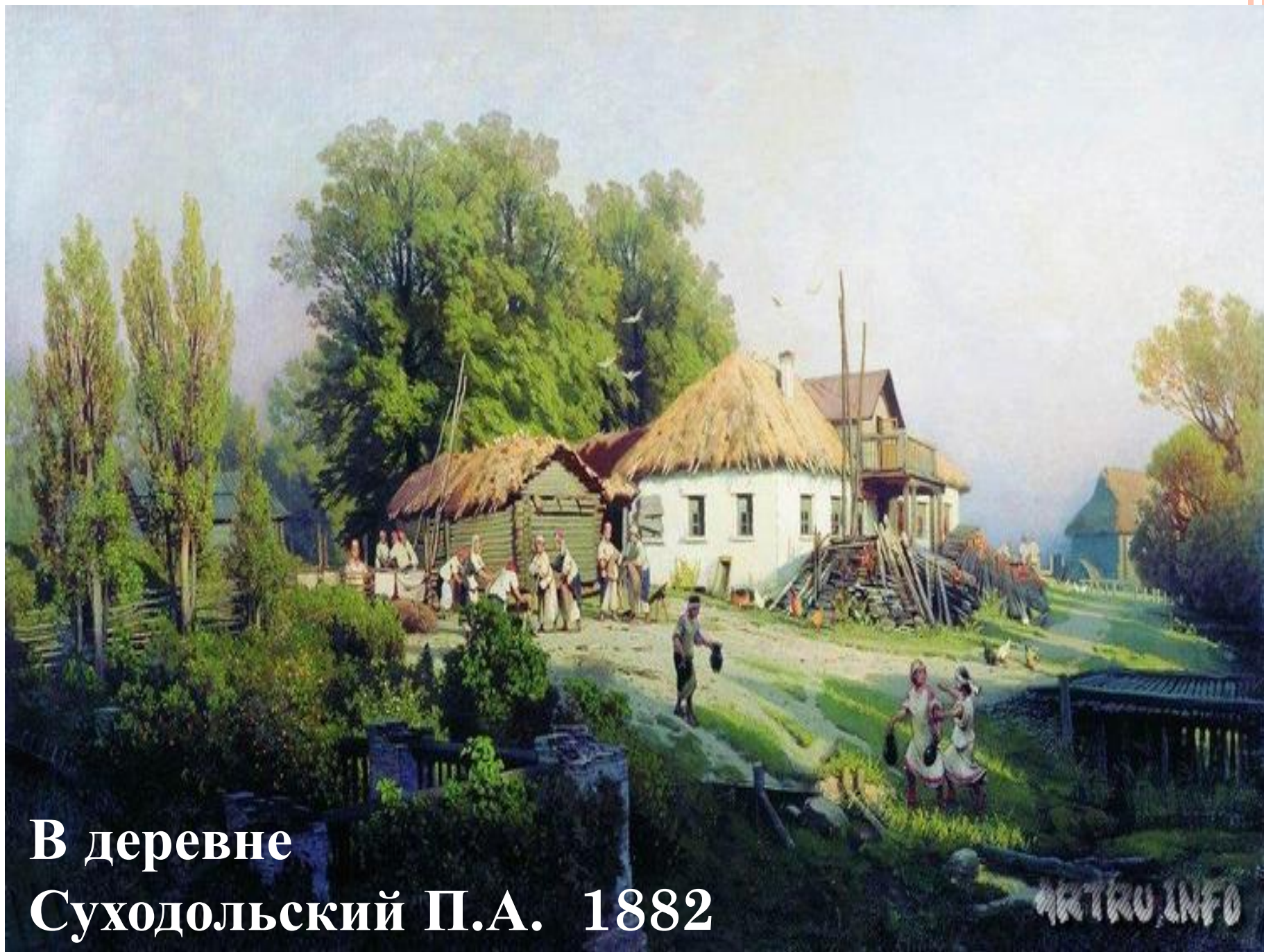
В деревне Суходольский П.А. 1882