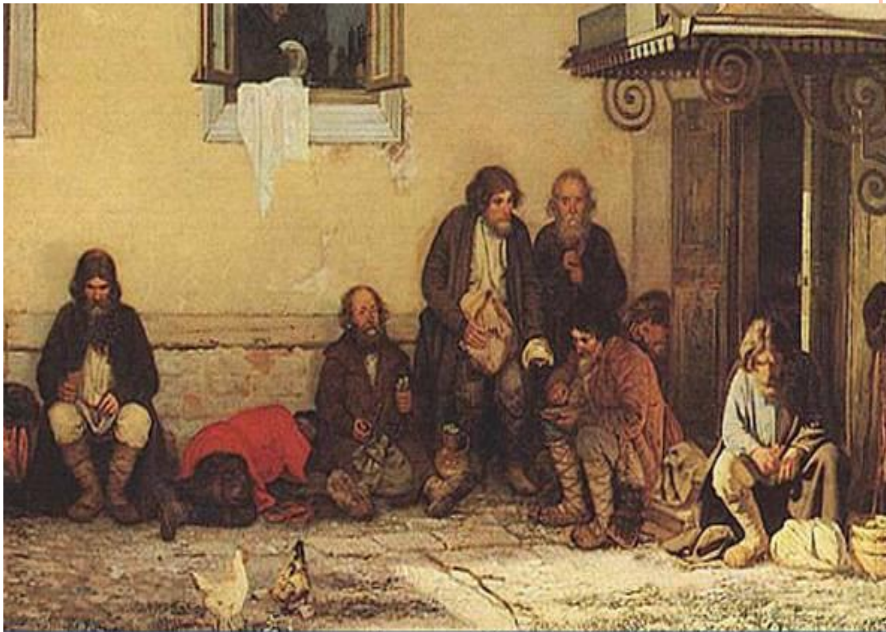
Г. Г. Мясоедов. «Земство обедает», 1872 год. Третьяковская галерея.