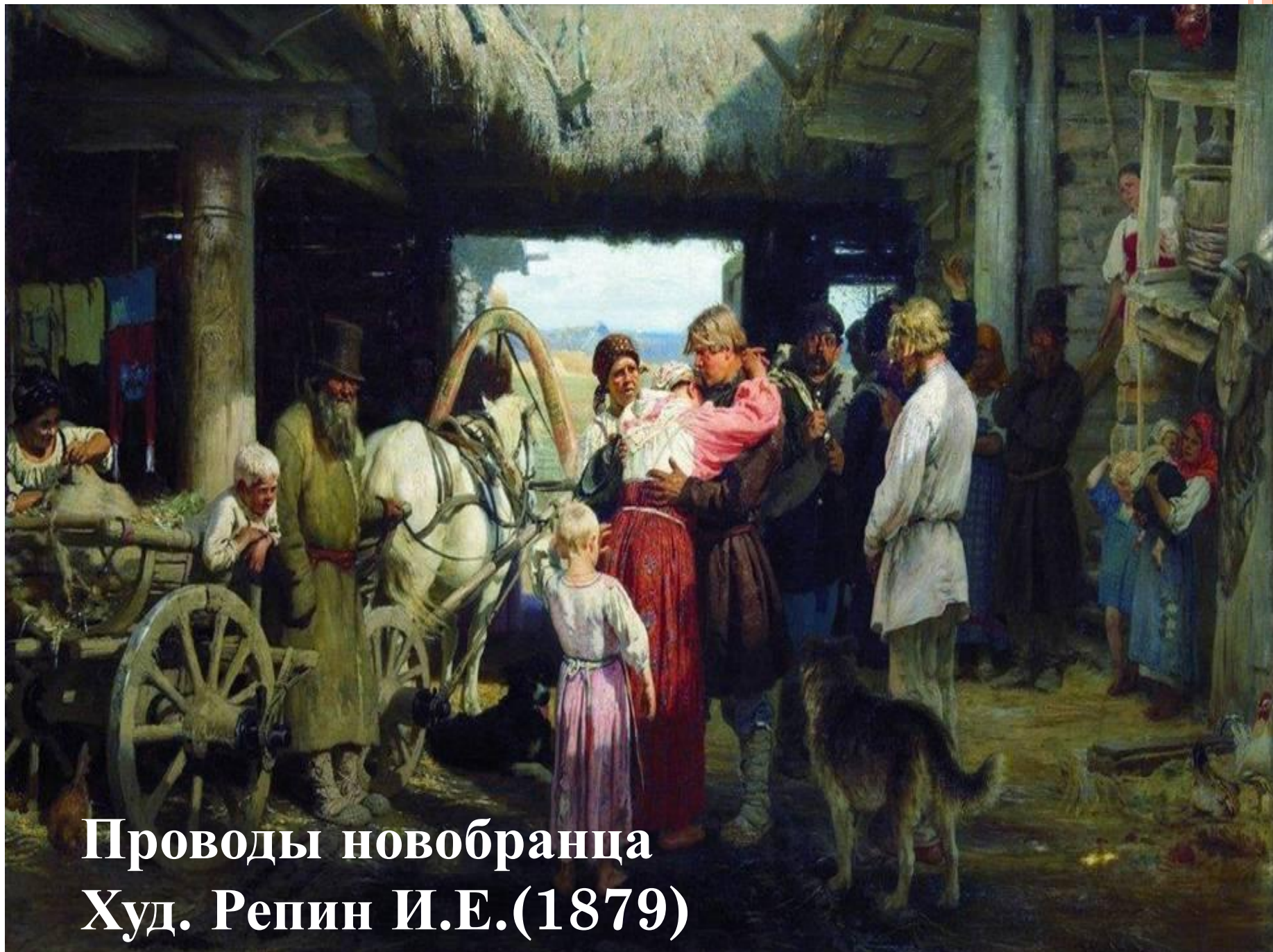
Проводы новобранца Худ. Репин И.Е.(1879)