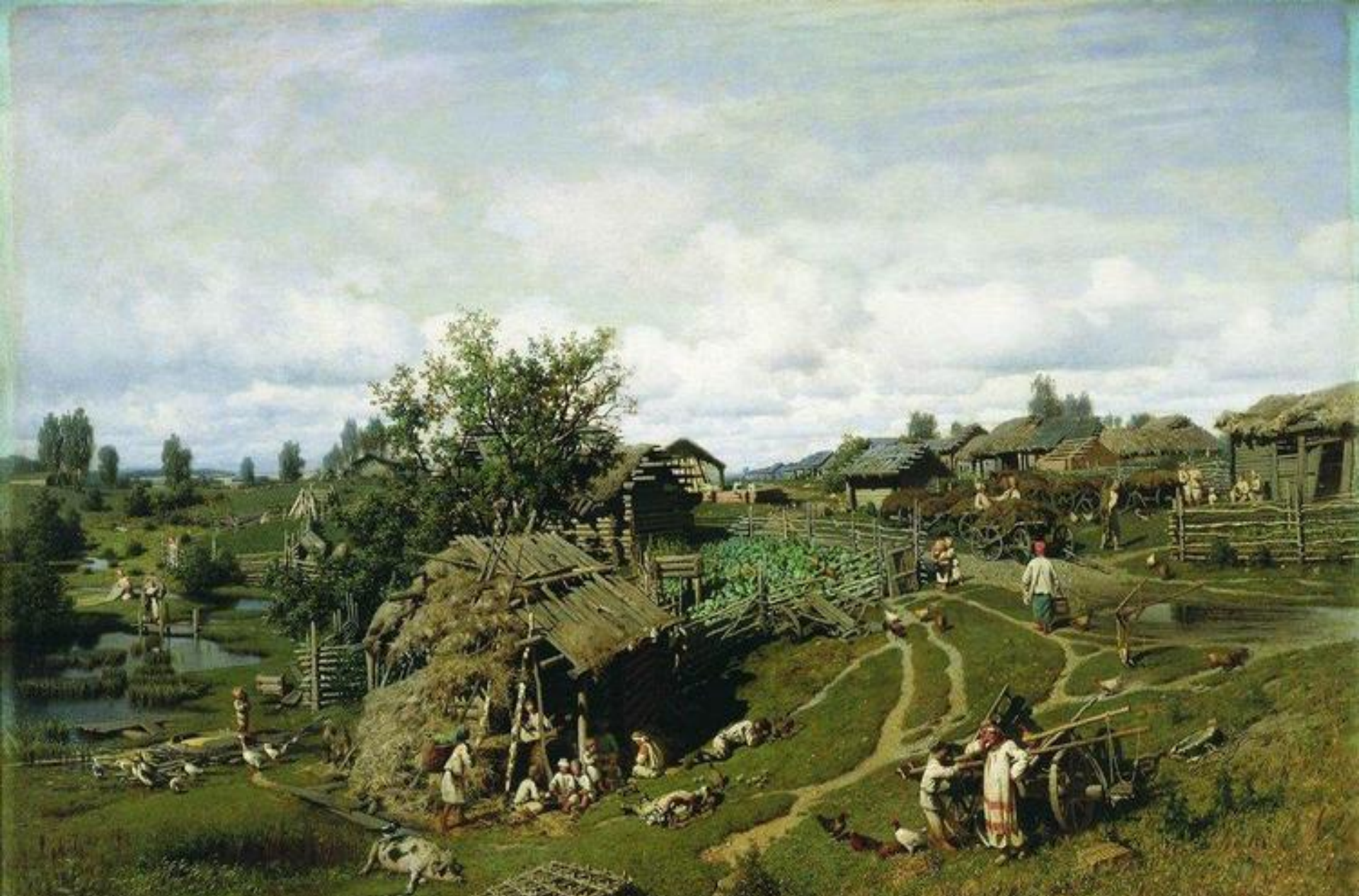
Полдень в деревне (Деревня Желны Калужской губернии Масальского уезда) 1864 Суходольский П.А.