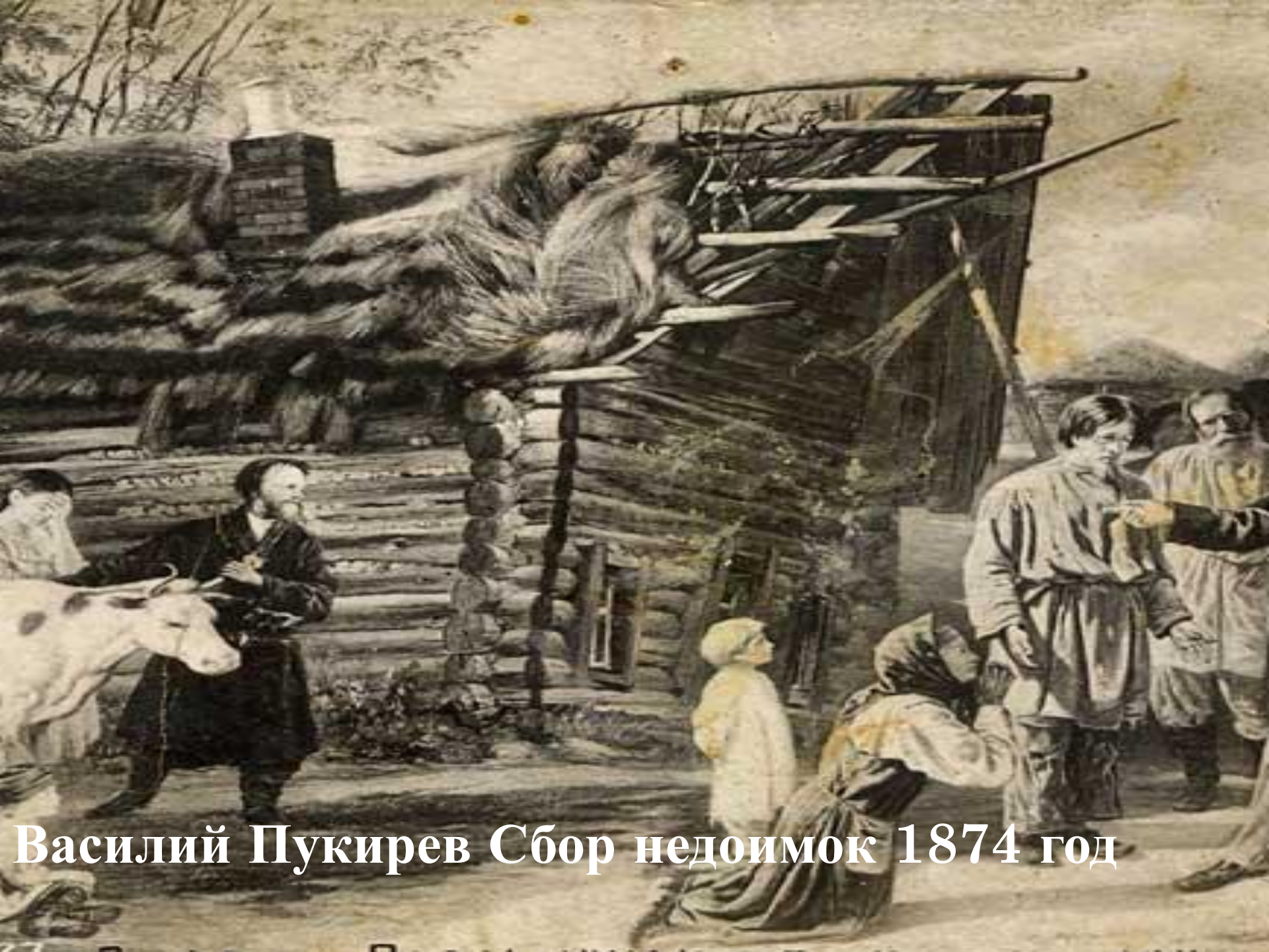
Василий Пукирев Сбор недоимок 1874 год