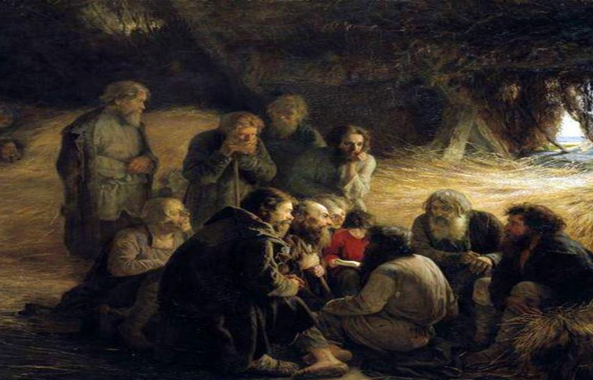
Чтение Положения 19 Февраля 1861 года. Худ. Мясоедов Г.Г.