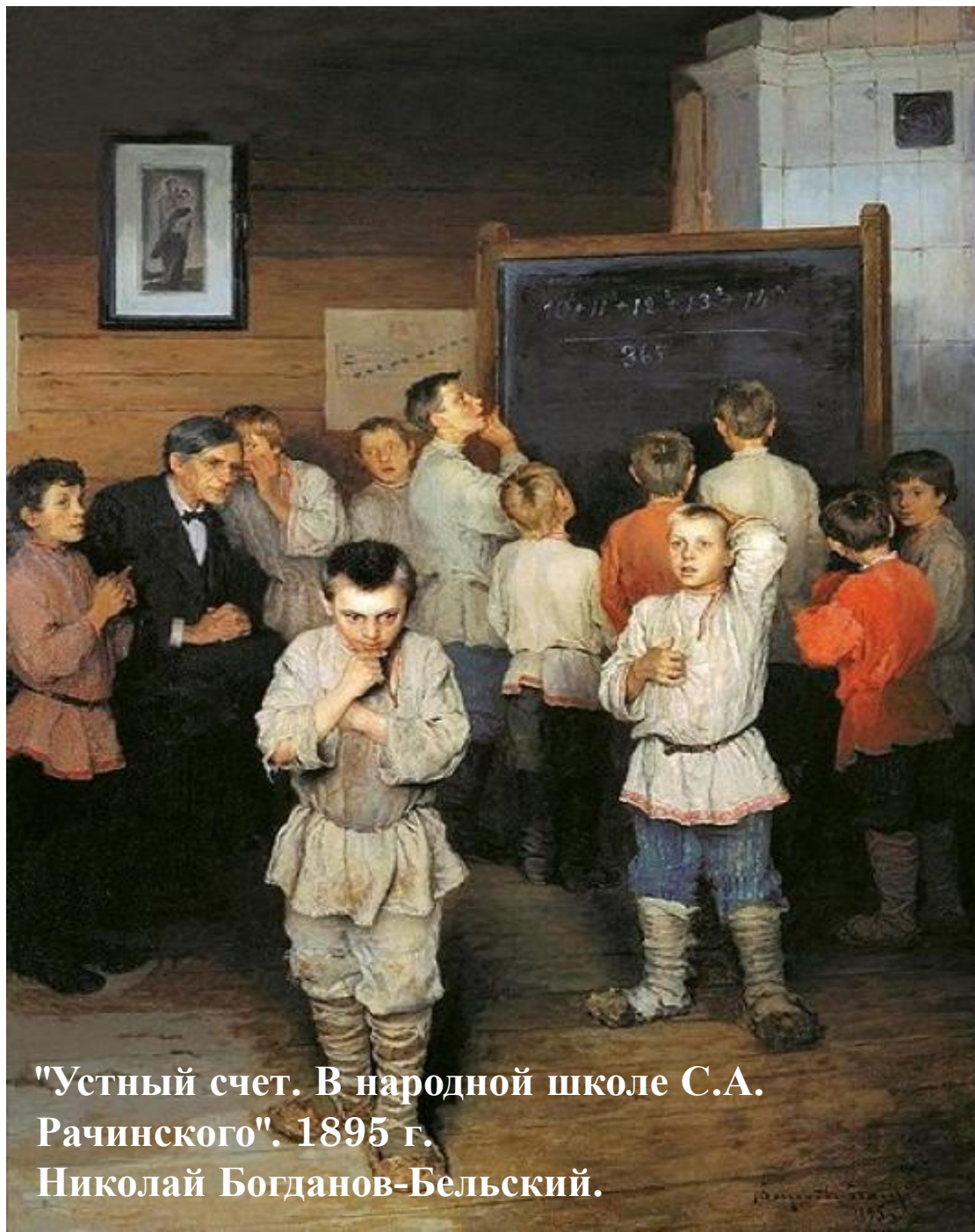
"Устный счет. В народной школе С.А. Рачинского". 1895 г. Николай Богданов-Бельский.