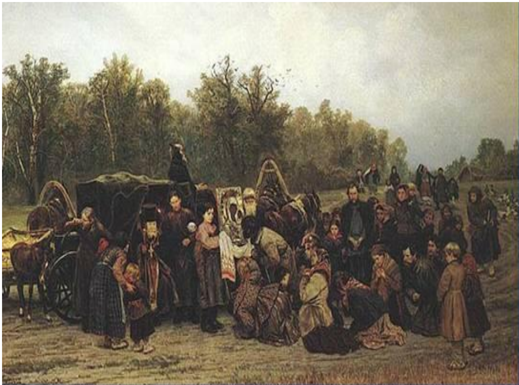
К. А. Савицкий, «Встреча иконы». 1878 год. Третьяковская галерея.