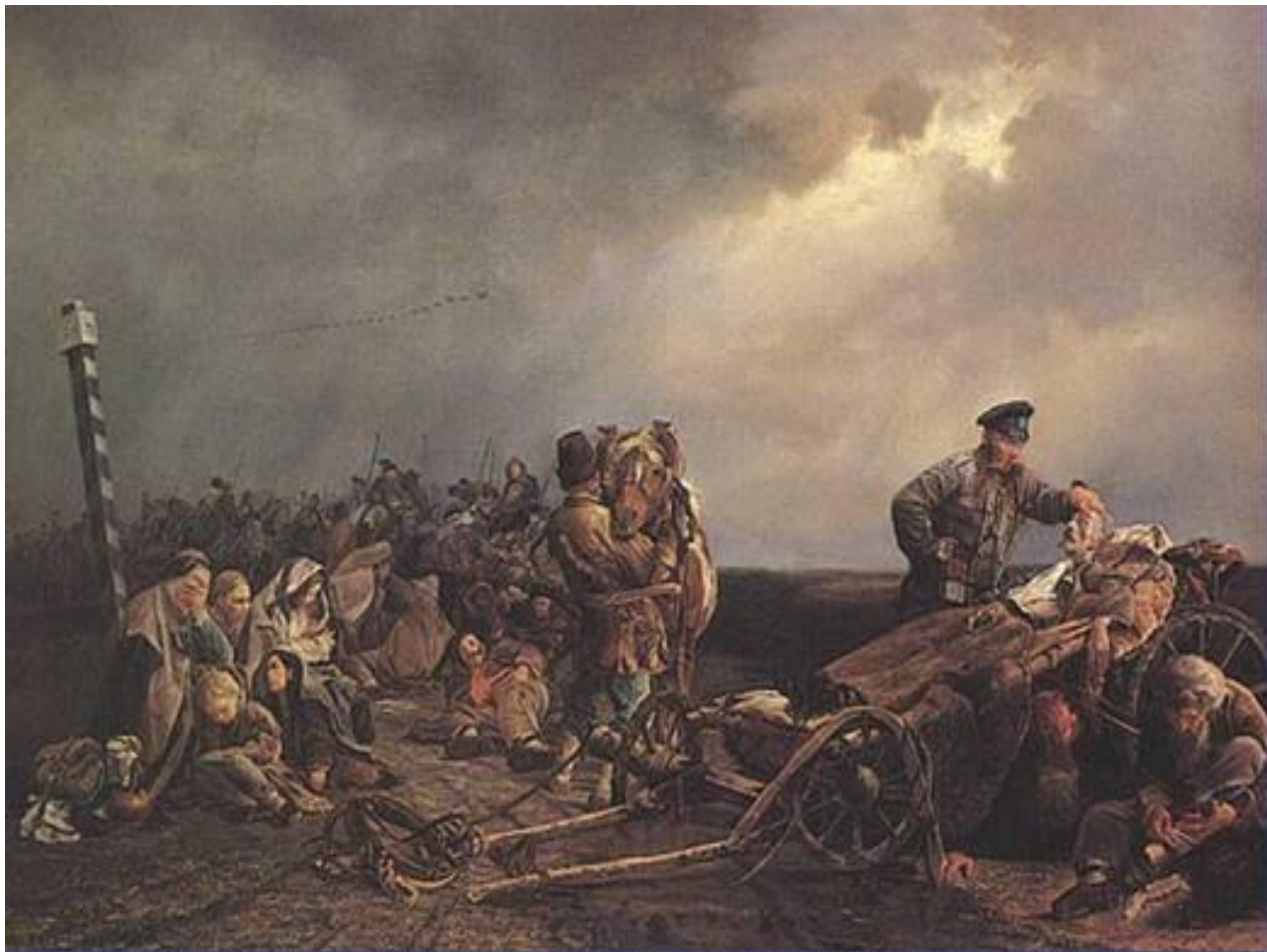
В. И. Якоби. «Привал арестантов». 1861 год. Третьяковская галерея.