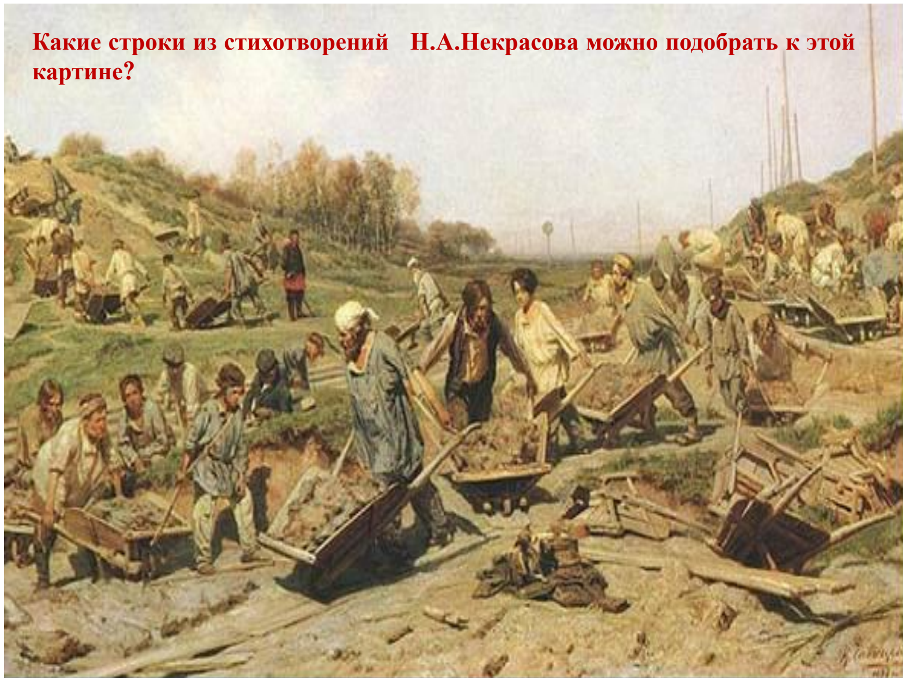
С. А. Савицкий. «Ремонтные работы на железной дороге». 1874 год. Третьяковская галерея.

Какие строки из стихотворений Н.А.Некрасова можно подобрать к этой картине?