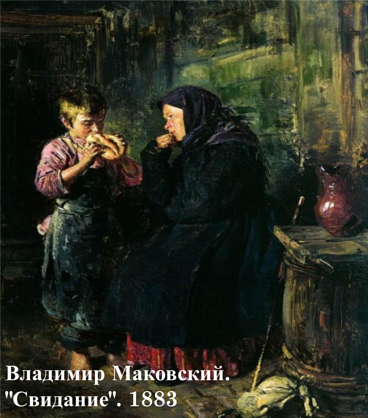
Владимир Маковский. "Свидание". 1883

В деревне нищета. Мальчика отдали "в люди".