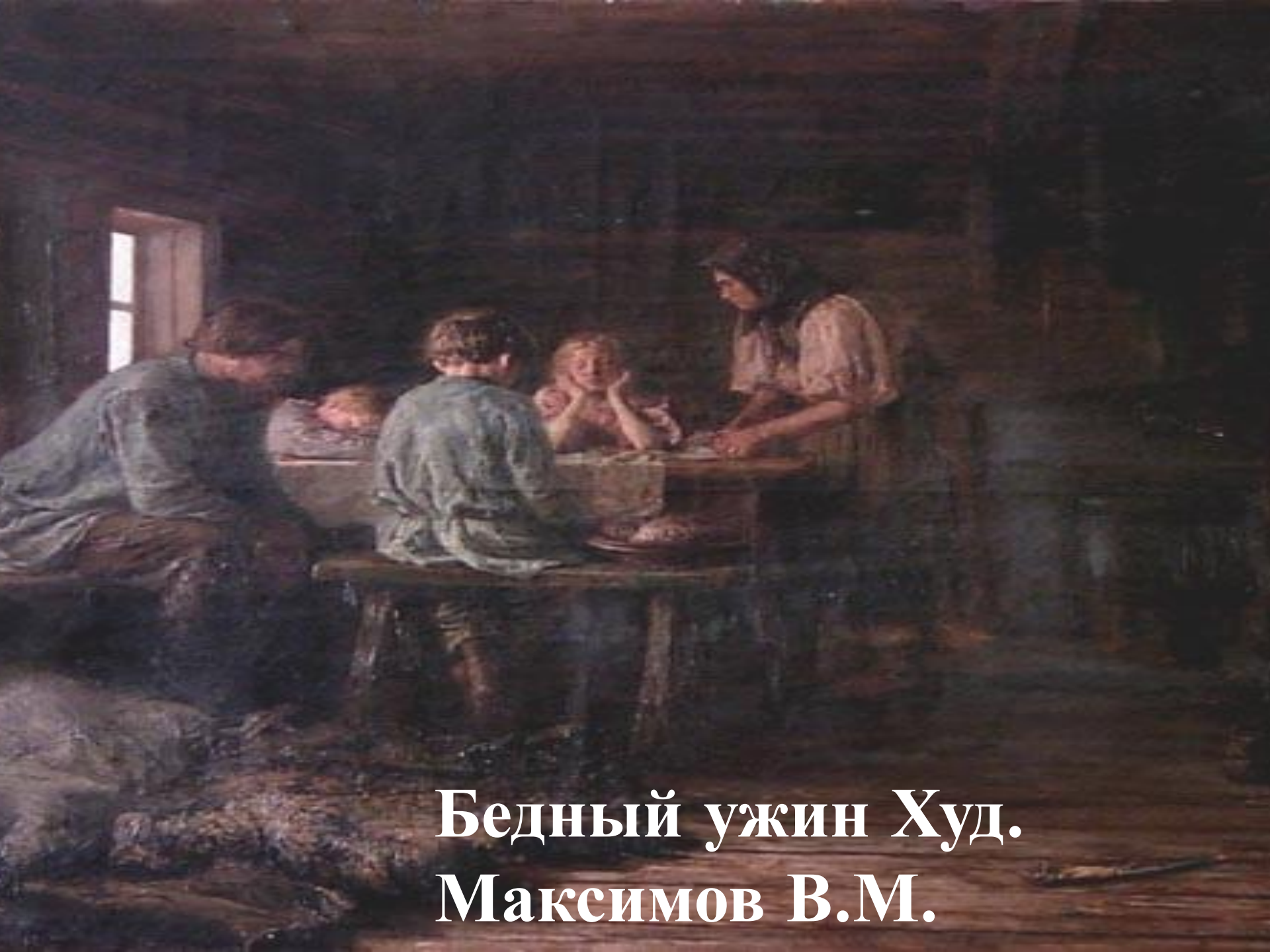
Бедный ужин Худ. Максимов В.М.