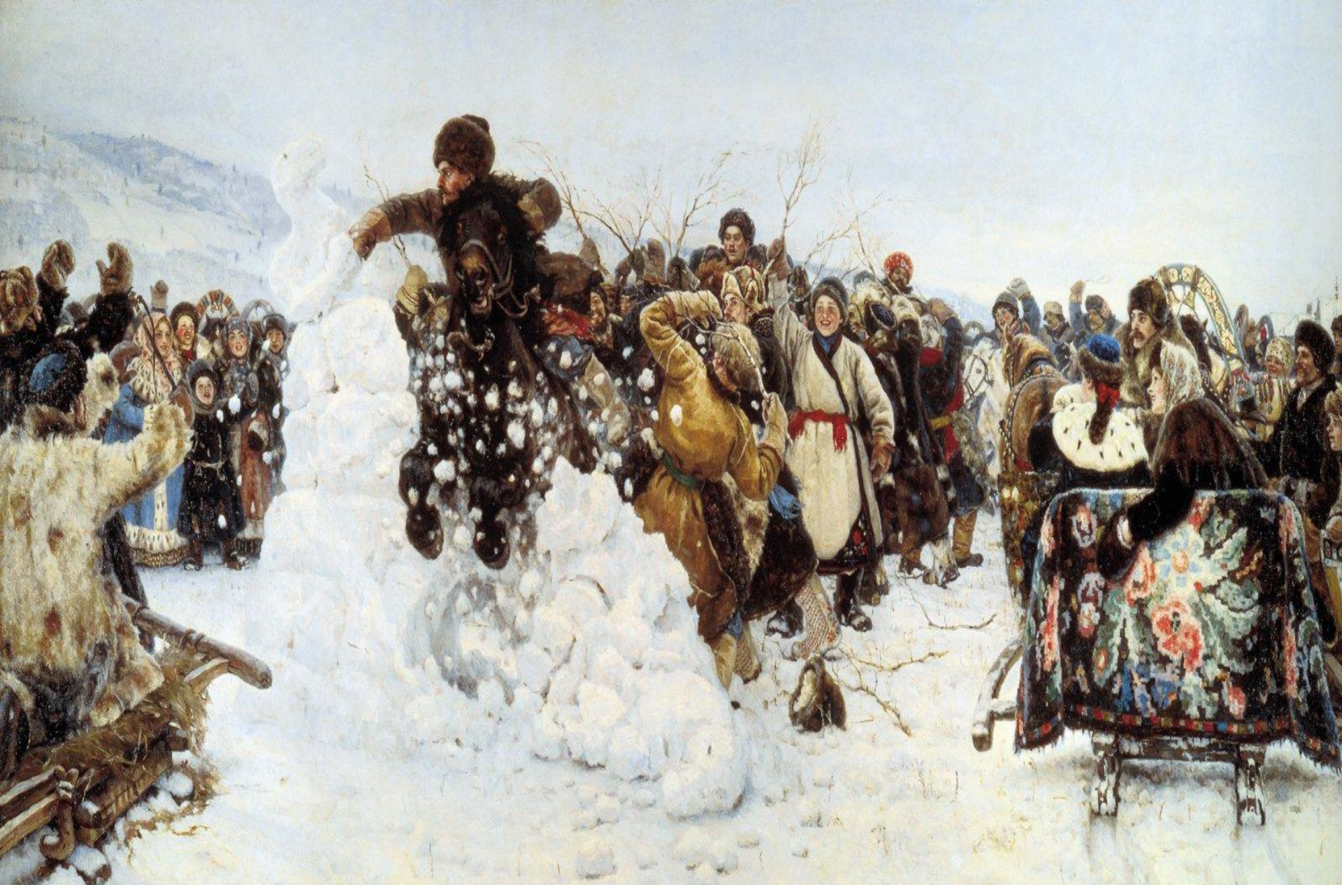
Василий Суриков «Взятие снежного городка»