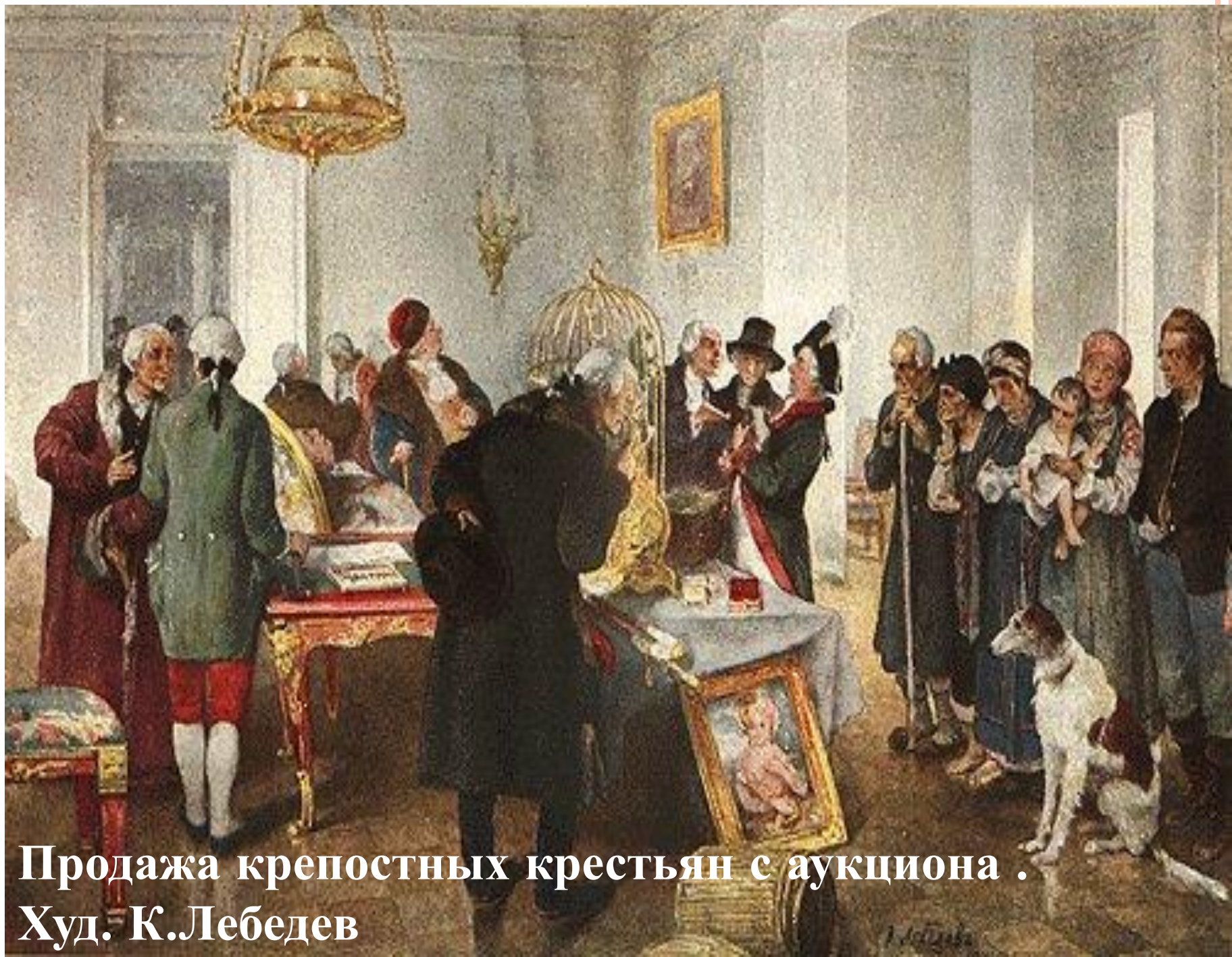
Продажа крепостных крестьян с аукциона . Худ. К.Лебедев