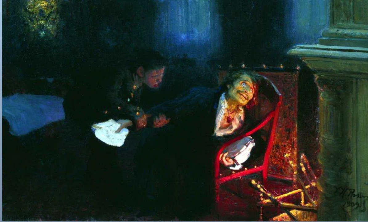
И.Е. Репин, «Самосожжение Гоголя»

Существует несколько версий о судьбе второго тома: