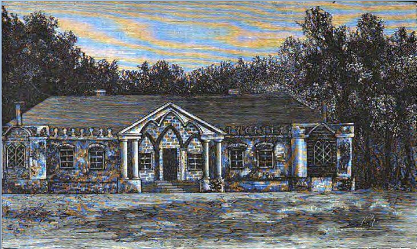
Старый деревенский домъ, въ селѣ Васильевкѣ, Полтавской губерніи, впоследствии сломанный, въ которомъ Н. В. Гоголь провелъ свои дѣтскіе годы.

В возрасте десяти лет Гоголя отвезли в Полтаву к одному из местных учителей, для подготовки к обучению в местной гимназии; затем он поступил в Гимназию высших наук в Нежине (с мая 1821 по июнь 1828). Гоголь не был прилежным учеником, но обладал прекрасной памятью; он был очень слаб в языках и делал успехи только в рисовании и русской словесности. В плохом обучении была отчасти виновата и сама гимназия высших наук, в первые годы своего существования не слишком хорошо организованная. Недостатки школы восполнялись самообразованием в кружке товарищей, где нашлись люди, разделявшие с Гоголем литературные интересы.