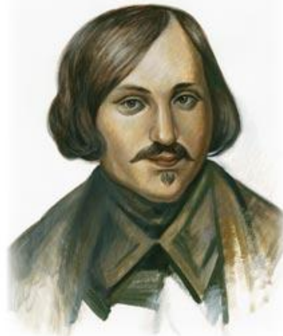
Гоголь Николай Васильевич (01.04.1809-04.03.1852)

Литературный критик В.Г. Белинский обозначает новое реалистическое направление в литературе. Его позицию развивают Н.А. Добролюбов, Н.Г. Чернышевский. Возникает спор между западниками и славянофилами о путях исторического развития России.