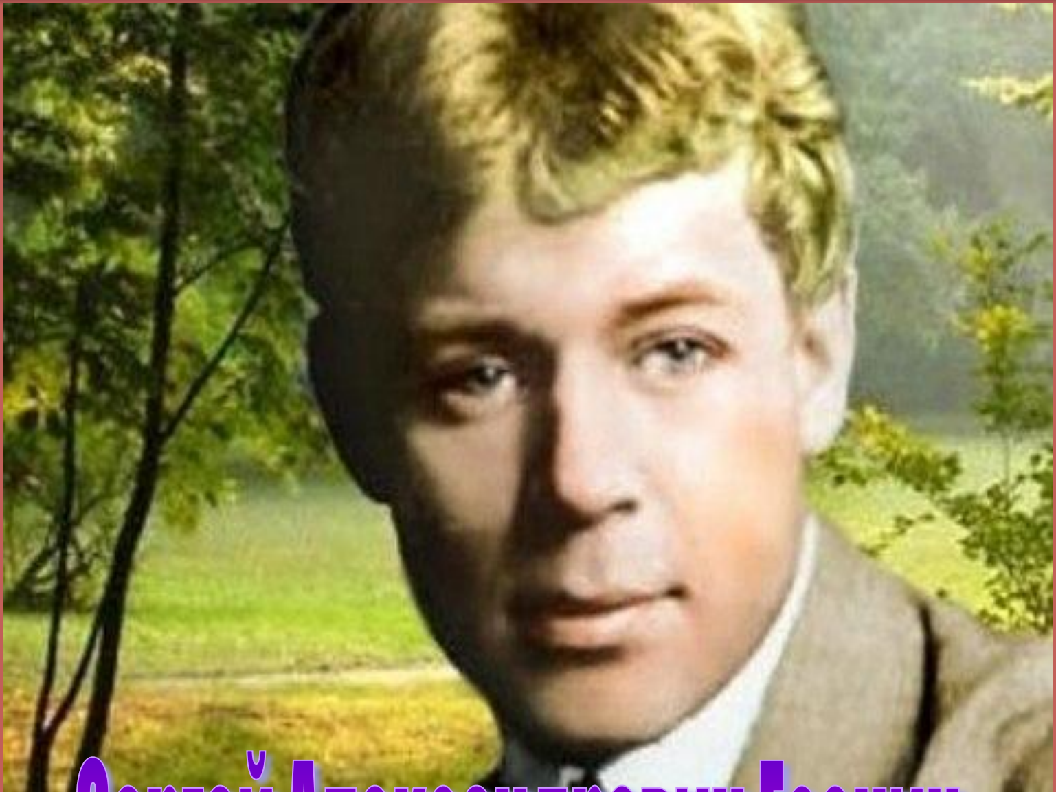
Сергей Александрович Есенин