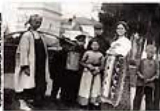
Классы в годы революции, 1918-1919