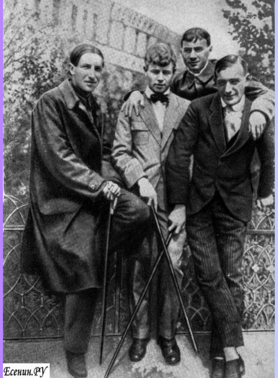
Мариенгоф, Есенин, Шершеневич, Кусиков ИМАЖИНИСТЫ