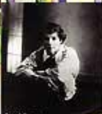
Сергей Есенин, 1914