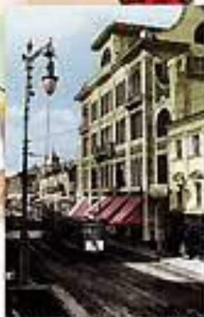
Салтыковский типография на Гусевской, фото начала XX в.