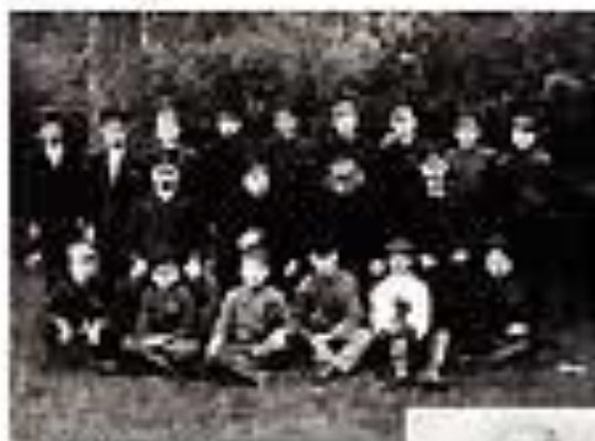
Выпускной класс 1911 года школы в Спасско-Сенном (класс в первом ряду, справа направо)