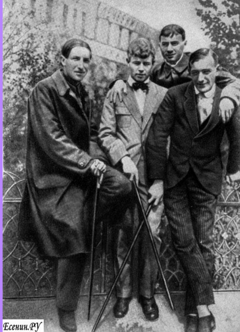
Мариенгоф, Есенин, Шершеневич, Кусиков ИМАЖИНИСТЫ