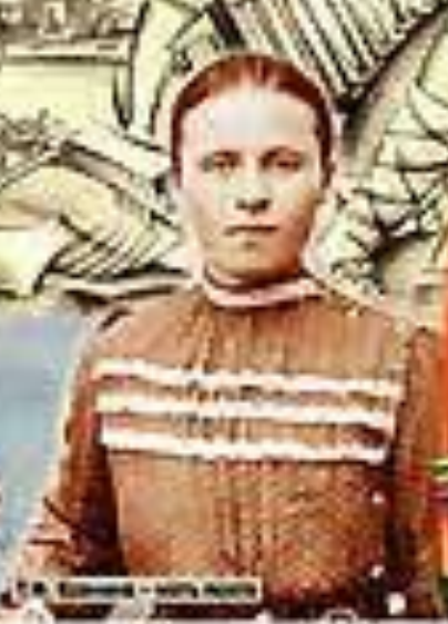
В. В. Маяковский — 1928