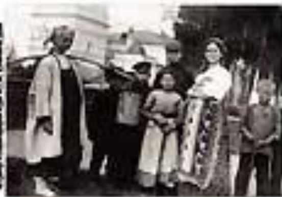
Классный вечер в училище, 1906-1910

Пытка, когда нам выдавали записки, мы читали стихи Пушкина, Лермонтова и других поэтов, а затем Леонов читал свои небольшие стихи. Его стихи по сравнению со стихами других учащихся были отличными по стилю.