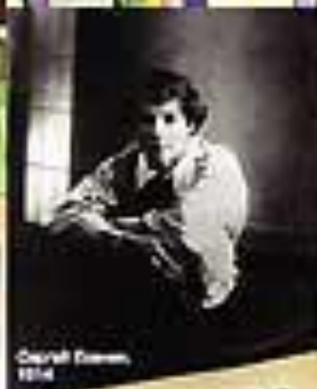
Сергей Есенин, 1914