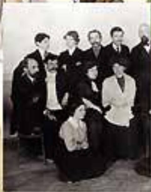
Сергей Есенин среди работников типграфической заводской Литва (Литва-Литва), 1914