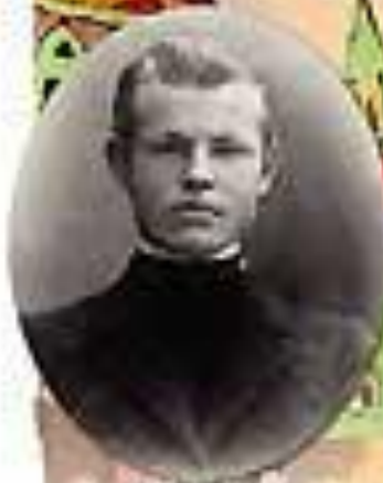
Геннадий Гинзбург, 1914