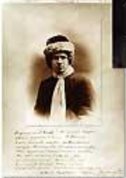
С. Вайс. Фото с фотографией И. Копенки. 1914

Воскресенье дни и был таклань, разорвал свои очки по журнадам, тем, что их не печатают, и аномалии, лично Грину в Петербурге. Первый, кого и увидел, был Шенк, второй - Горюцкий. Горюцкий жена шла с Копенкой, в котором и разговаривал сзади их слова. С Копенкой у вас находится большая дружба... С. Вайс. На Автографы 1922 год