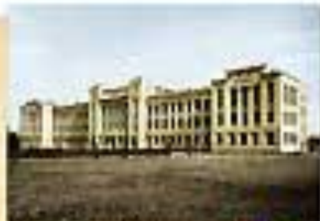
Факультет филологии им. А.С. Пушкина, начало 20-х гг.

В 1913 году Есенин поступил в Московский университет Шанявского и пробыл там полтора года.