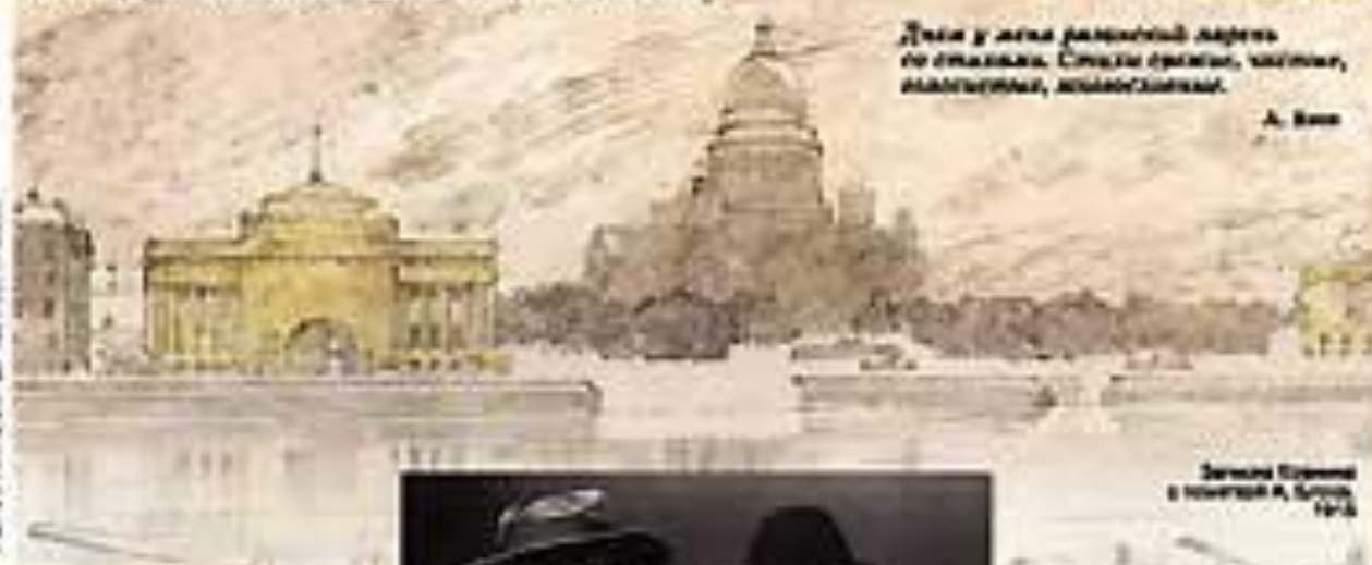
А.С. Сопроунов-Павлов. Мраморный собор в Троицкий день. 1922

Колода и скрипка на Пскове, с меня выдал пот, потому что в первый раз видел живого поэта.