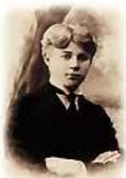
Сергей Есенин, 1914

Белая береза Под моим окном Проплывала вышам, Тучам серебряна.