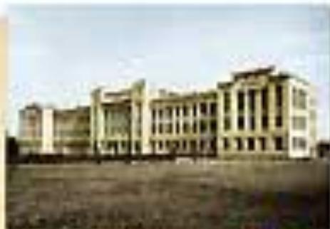
Факульте́т Восто́чных Училищ на У.Ш. Шанхай. Фот. начала XX в.

В 1913 году Евгений построил малолетствующий в Универ- ситету Шанхайского и пробыл там полтора года.