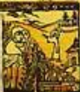
Религия на обложке книжки Исусъ Наденецъ, Хрущев С. Тушин. 1914