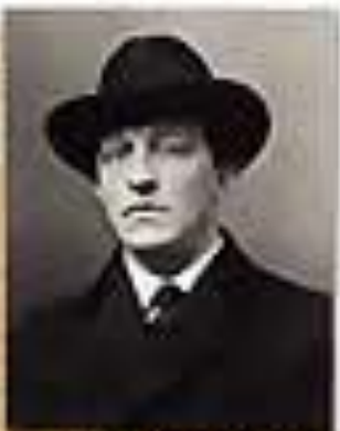
А. Вайс. Фото. 1912