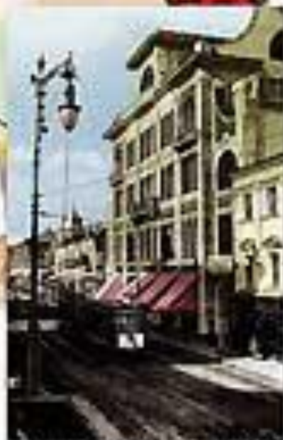
Семейная типография на Герасимов, Фот. начала XX в.