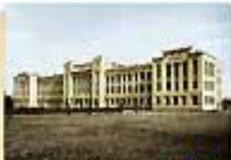
Факультет юридического университета им. А.Д. Шанявского. Фото начала XX в.

В 1913 году Есенин поступил в Университет Шанявского и пробыл там полтора года.