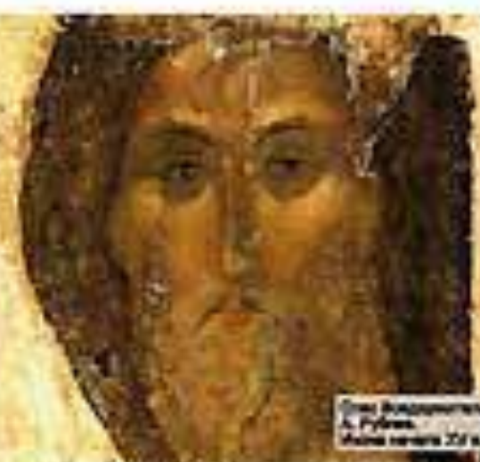
Портрет Владимира А. Рубина. Автоматический 2018 г.