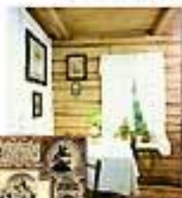
Составительница от школьного учителя, 1906