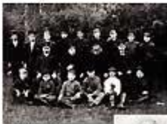
Выпускной класс 1911 года школы в Спасско-Самарском (класс и педагогический совет школы)

Учебный день в училище начинался в «Отеч. школе». Ветер Божий приносил запахники Жана Скверина. Он начал родившейся шить, крепил его самодель, и ему не пришлось через много лет служить швейцаром на яву Вокана Серено.