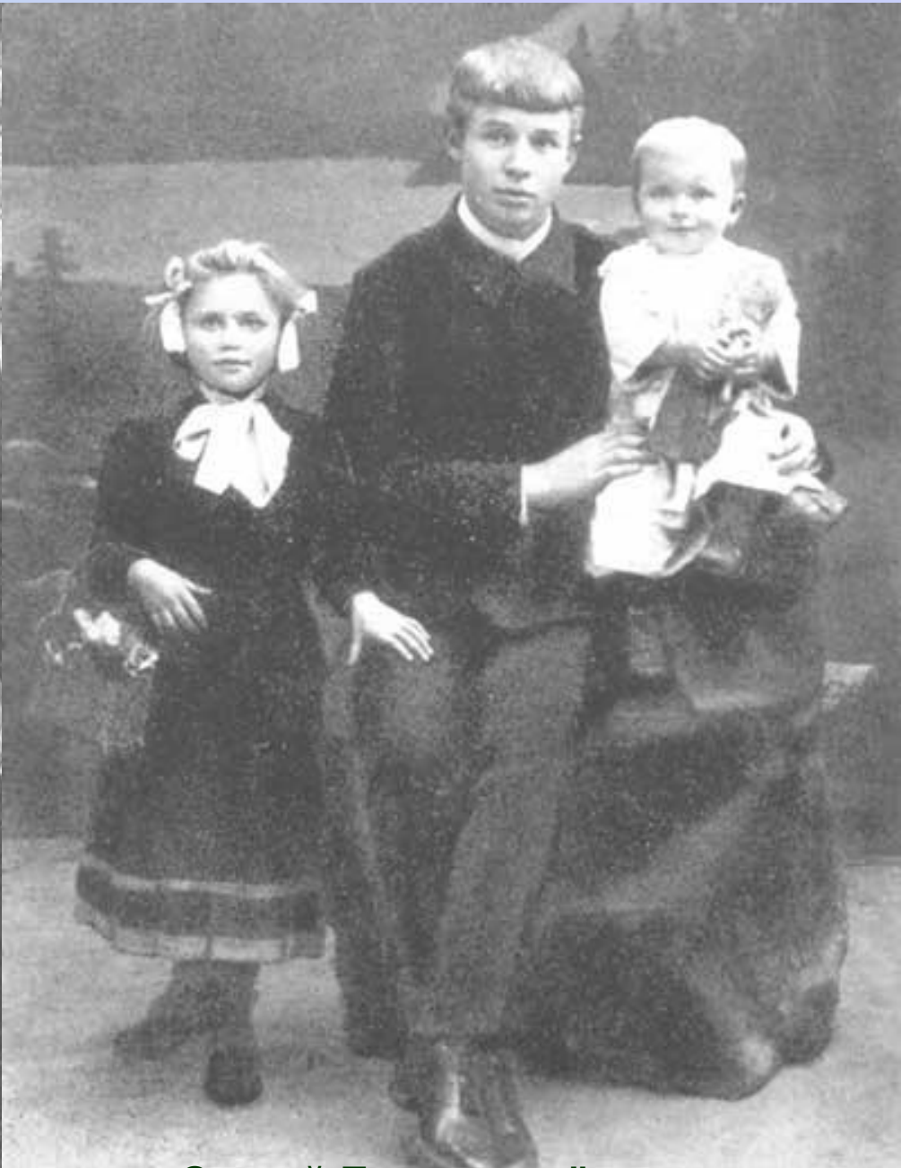
Сергей Есенин с сёстрами