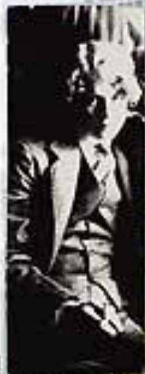
С. Есенин, фото. 1917

ИЗВЕСТИЯ Центрального Исполнительного и Временного Советов Рабочих и Солдатских Депутатов