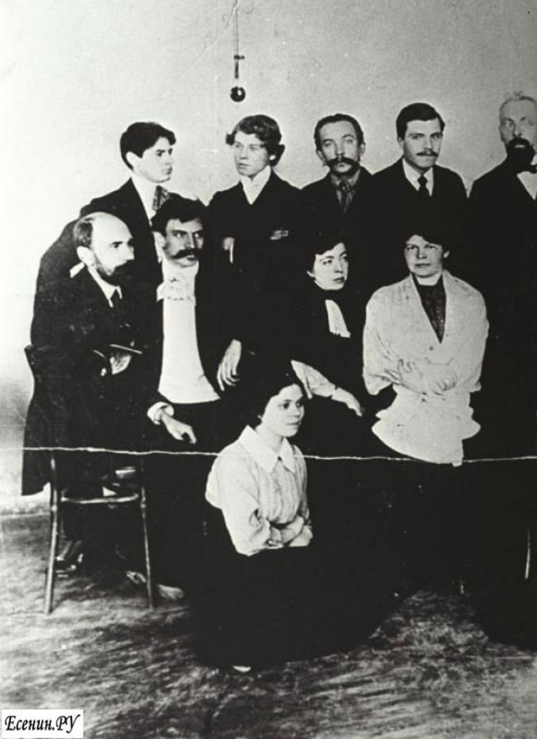
Сергей Есенин с рабочими типографии Сытина 1914 г.