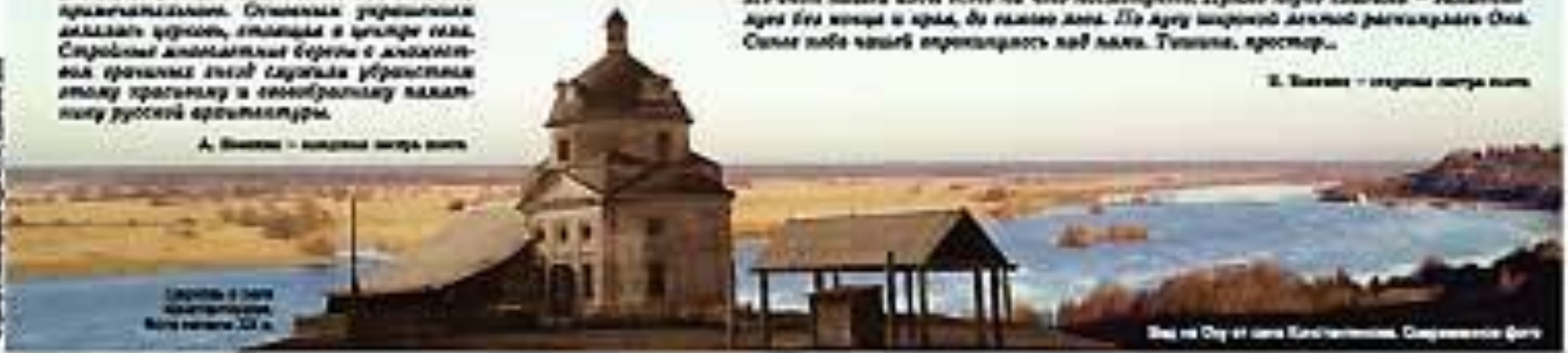
Церковь в селе Константиново, фото начала XX в.