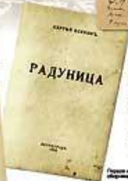
Первое издание повести «Радунца». 1914

Воскресенье дни и был таклань, разохла свои очки по журнадам, тем, что их не печатают, и аномалии, дико грежу в Петербурге. Первый, кого и увидел, был Вайс, второй - Горюхиный. Горюхиный жила сего с Копыткин, в котором и разила не слезла их слова. С Копыткин у вас кандавать большая дружба... С. Вайс. На Автографы 1911 год