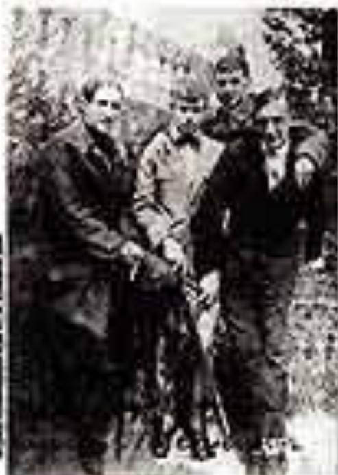
Левинсты, А. Воронцов, С. Есенин, В. Маяковский Москва, апрель 1917

Русские поэты в начале 1920-х годов «Современная поэзия» (Москва, 1920)