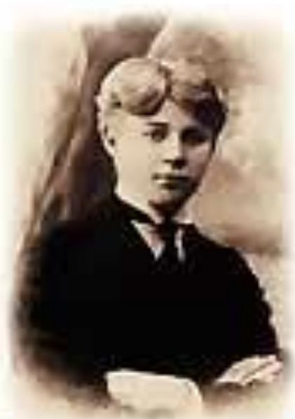
Сергей Есенин, 1914

Белая береза Под моим окном Проплывала вышном, Тучки перебрала.