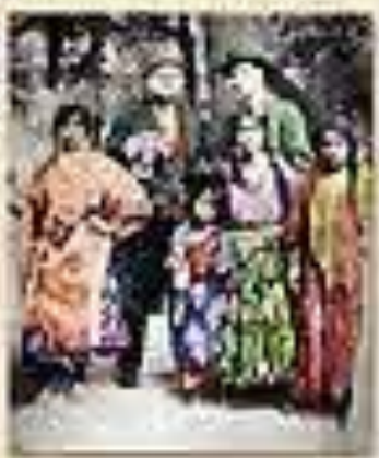
С. Есенин и А. Саввин в саду (1925) Фото 1925