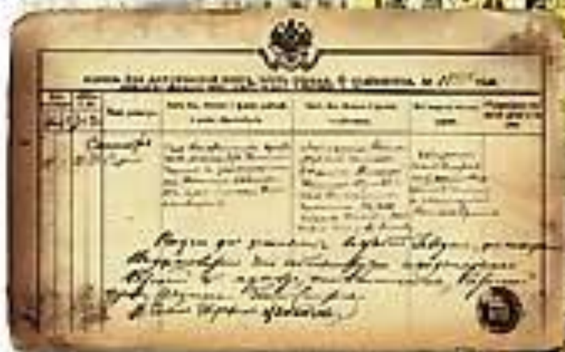
Выписка из метрической книги в роддоме С. Есенина

Роснула я с дождиком в утробе, сошла, Зорю жилам зносивши в залуду сиваха, «Матушка в Хрустальну на воду взошла...» - 1911