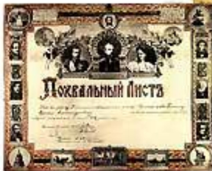
Докладный лист от школьного учителя, 1906

И как мой класс горит, Но тускло светится в тумане, И как северной звездой лежит, Но он заросший лесом и бурьяном.