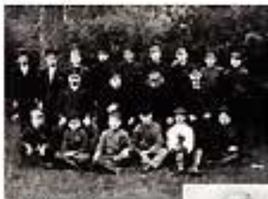
Выпускной класс 1911 года школы в Спасско-Сайбеевском (класс и педагогический совет школы)