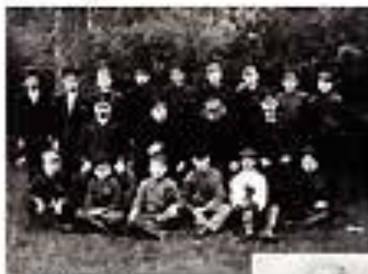
Выпускной класс 1911 года учебы в Спасско-Сенной (класс и педагогический совет школы)