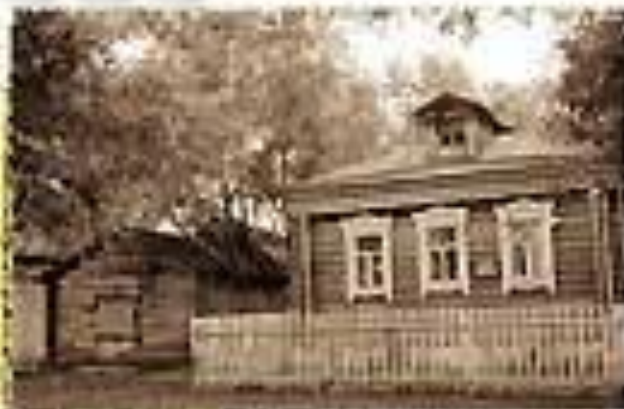
Дом Есенина в Константиново, фото начала XX в.

Паклету ушлякши драбнишка; У порога в лавочке лежи, Под четверками точильные Тарелочки лежат в ряд.