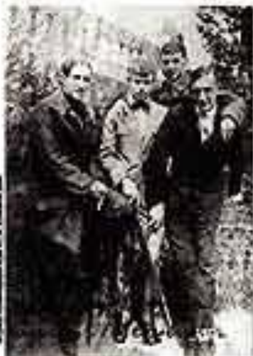
Лермонтов, А. Блок, С. Есенин, В. Маяковский, Москва, фев. 1917

Русские поэты в начале 1920-х в парке «Садик» в Ленинграде (Старина, 87)