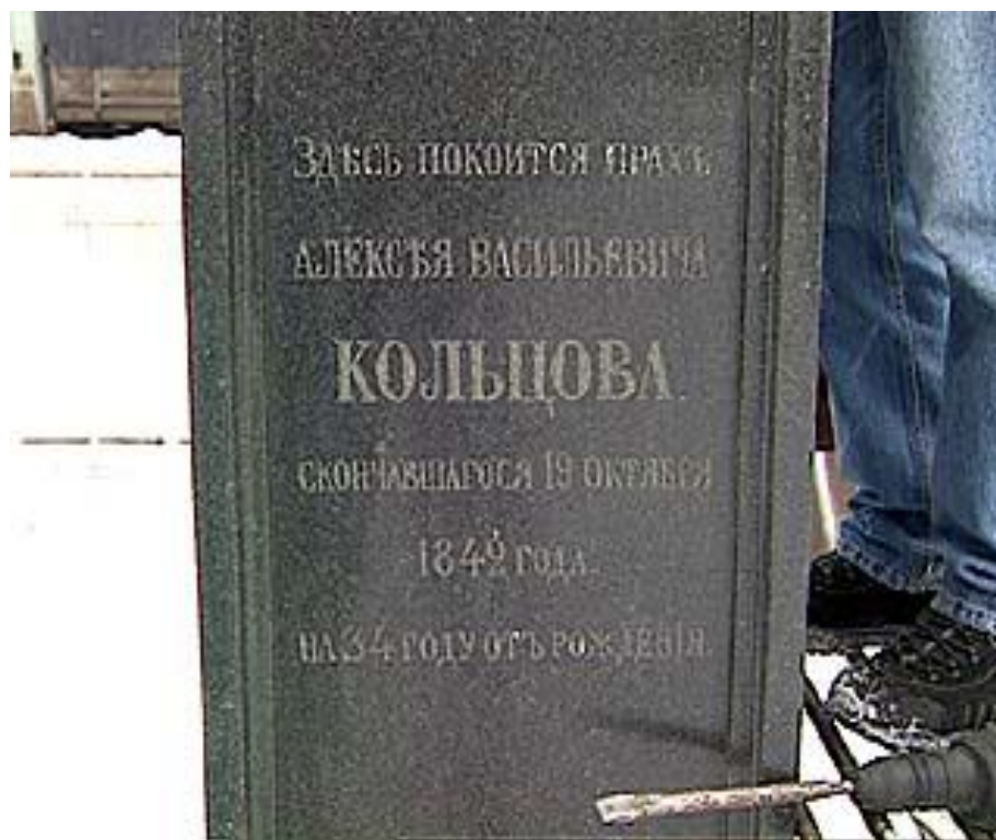
Памятник на могиле А. В. Кольцова