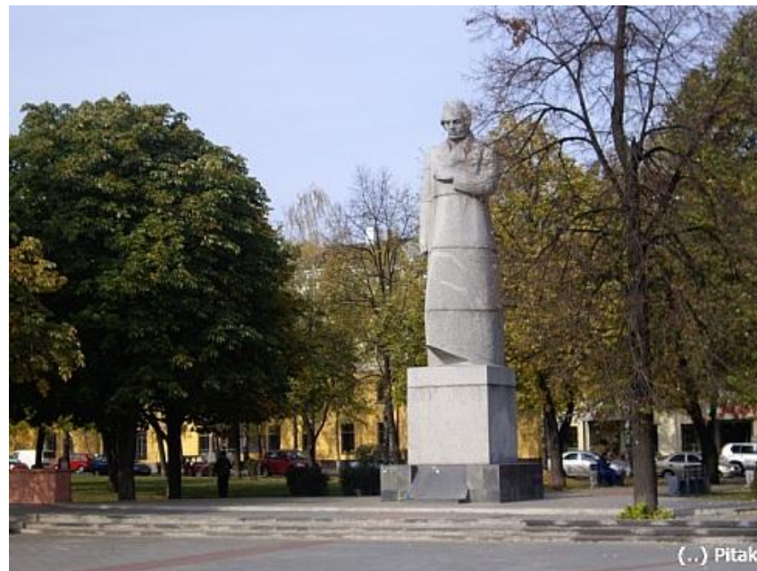
Памятник А.В. Кольцову на Советской площади.