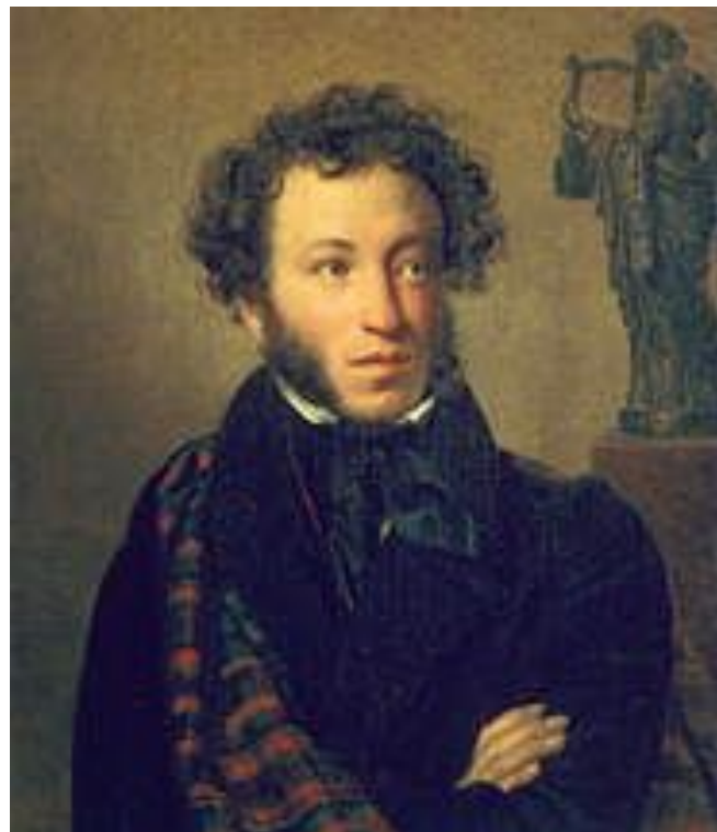
Кольцов и Пушкин