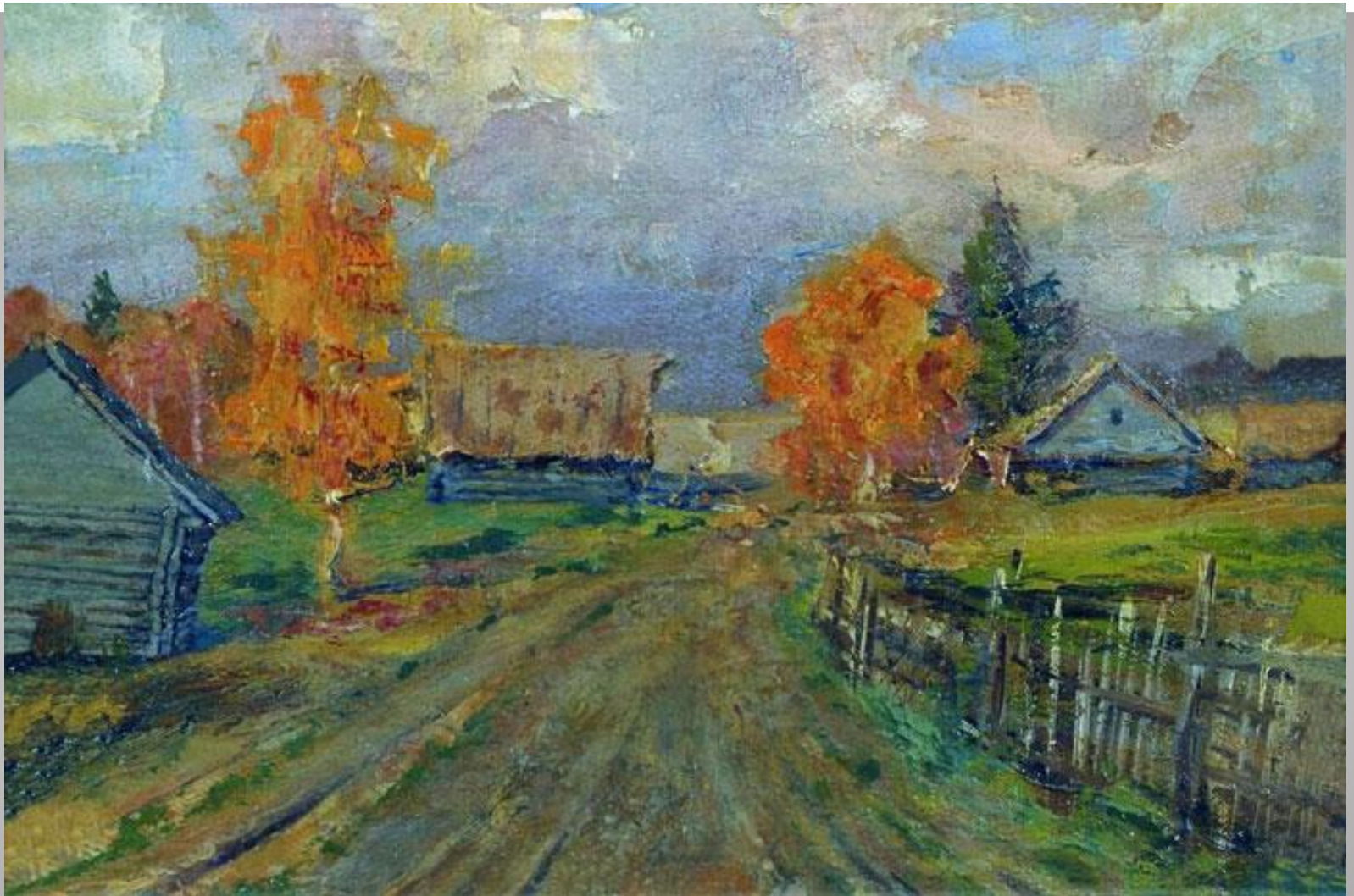
И.И. Левитан. Осень