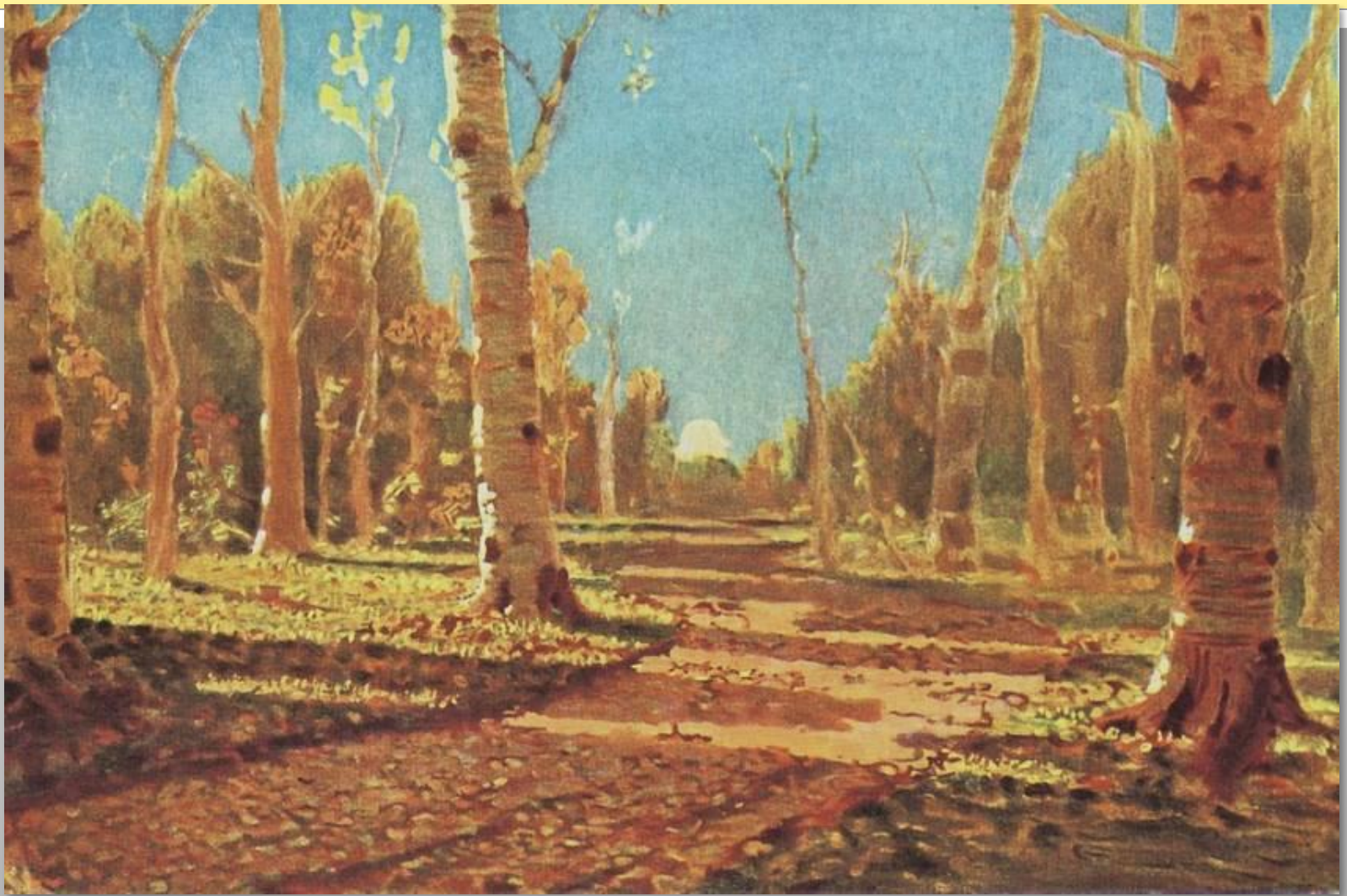
А.И. Куинджи. Берёзовая роща