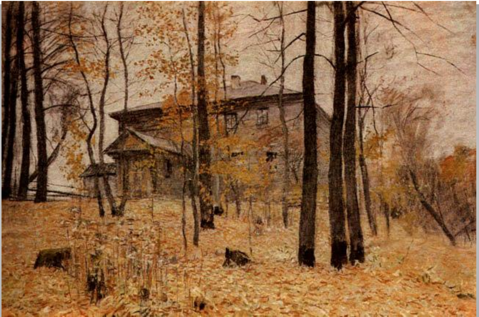
И.И. Левитан. Усадьба