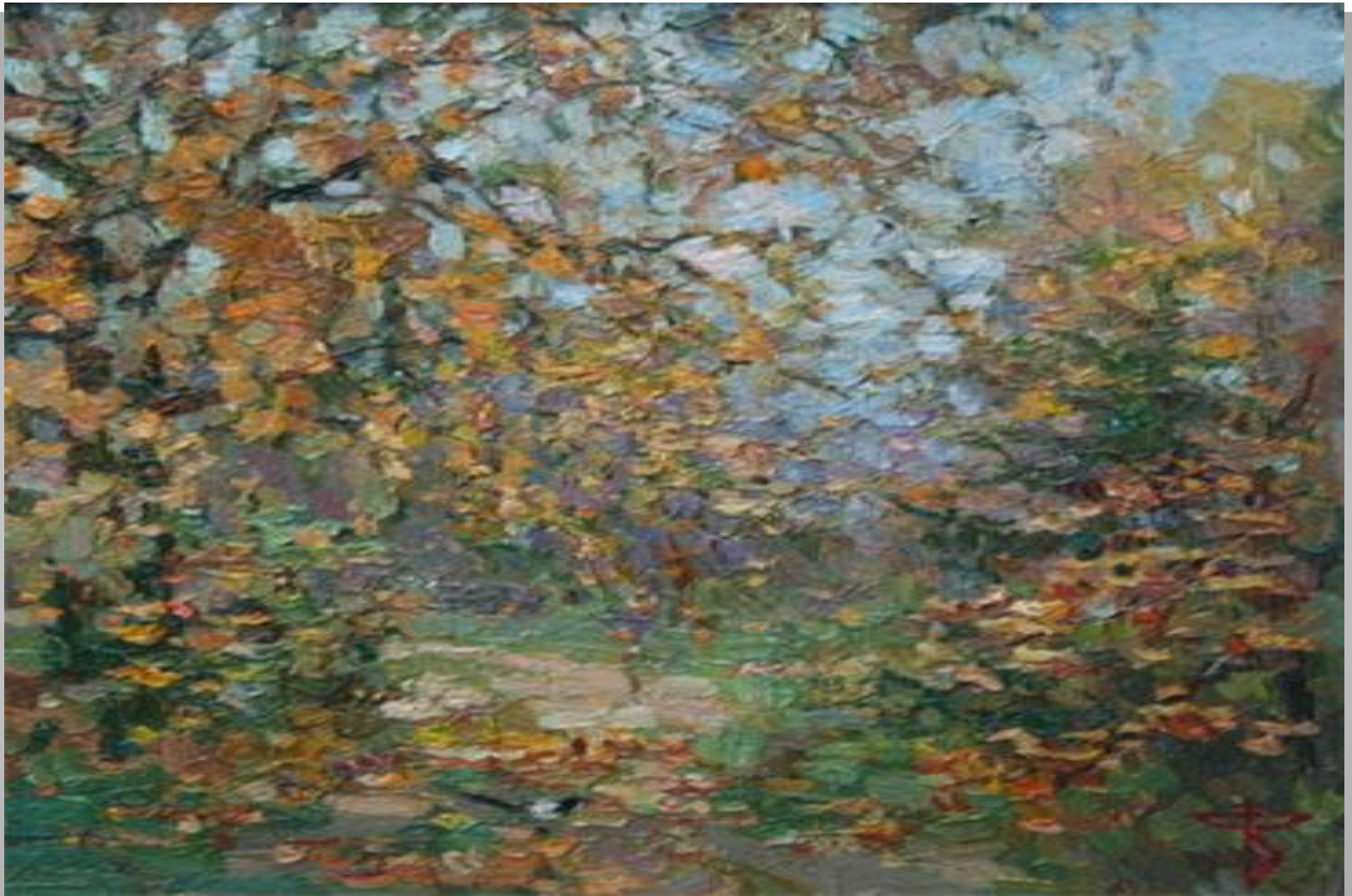
В. А. Федулов. Осенние листья