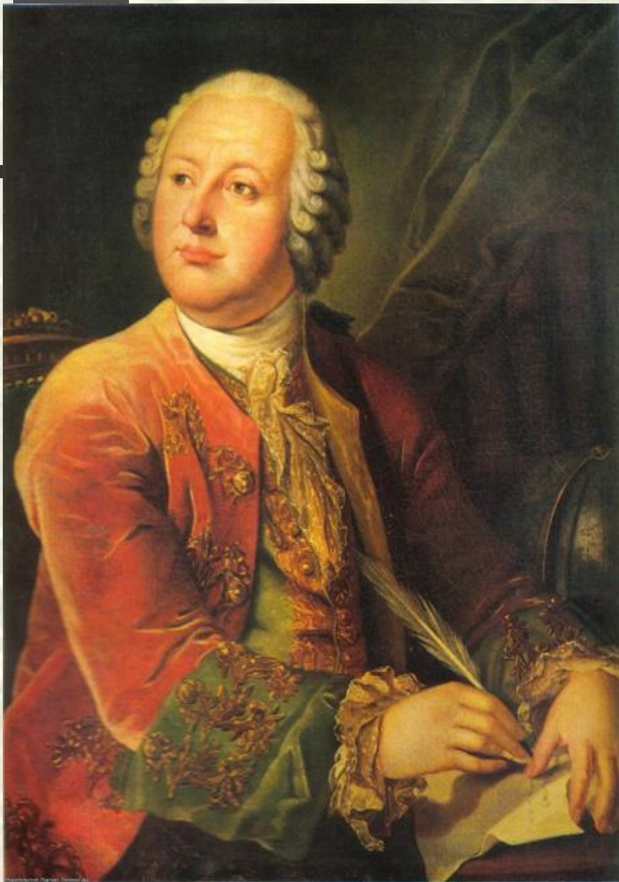
Л.С.Митропольский. Портрет М.В.Ломоносова (1787).