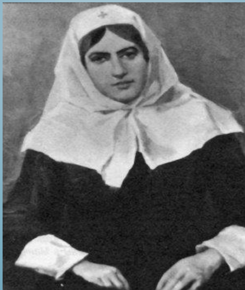
Баронесса Юлия Вревская