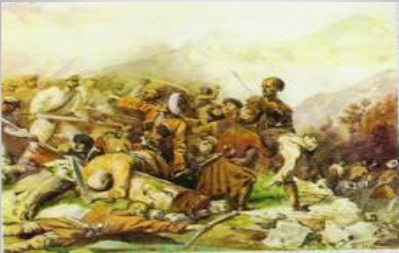
Битва при реке Валерик