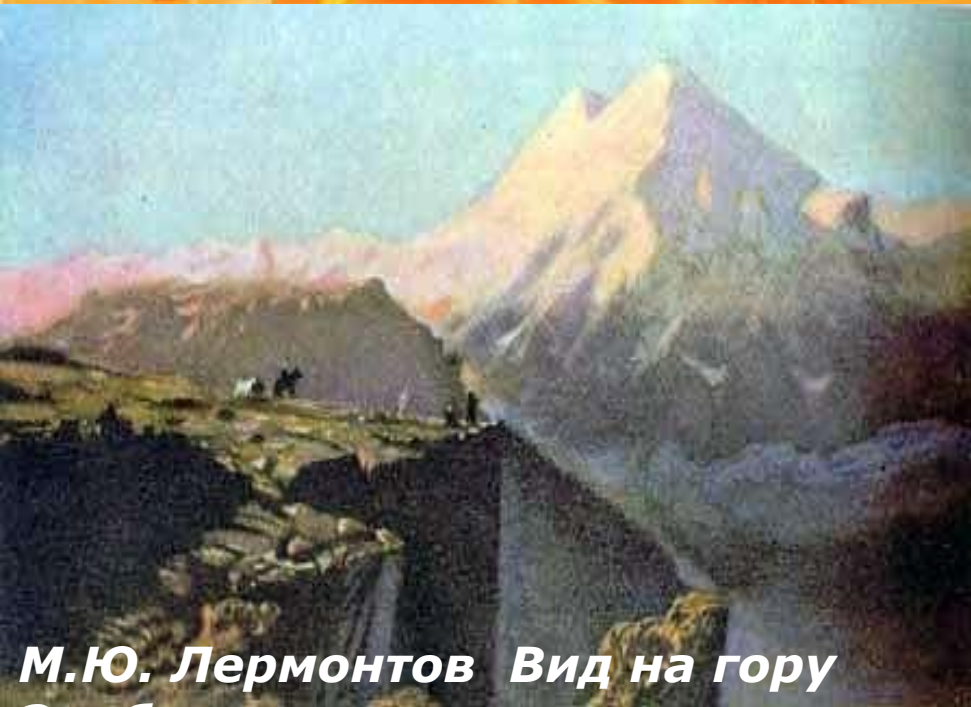
М.Ю. Лермонтов Вид на гору