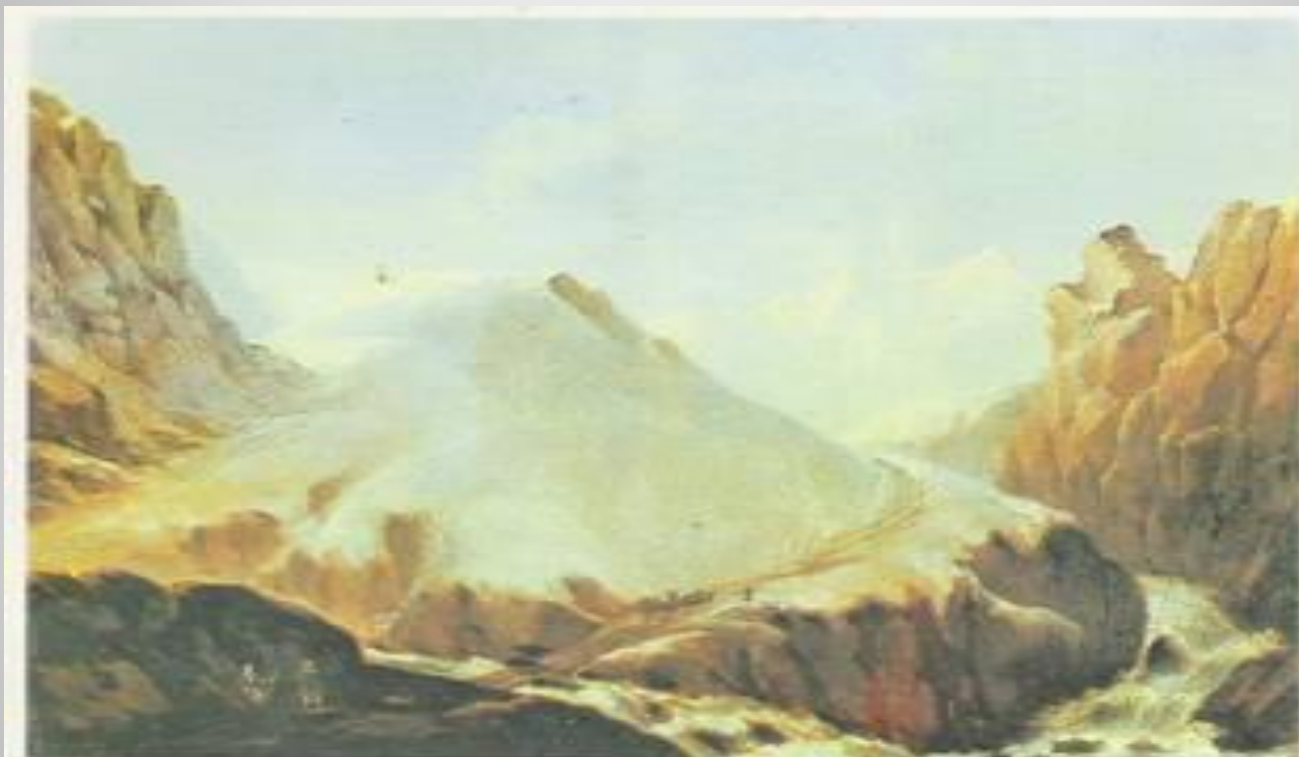
Крестовая гора. Картина М. Ю. Лерокитова. Масло, 1837 г.