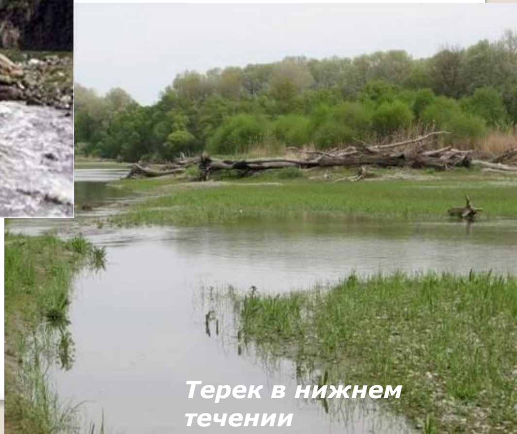
Терек в нижнем течении