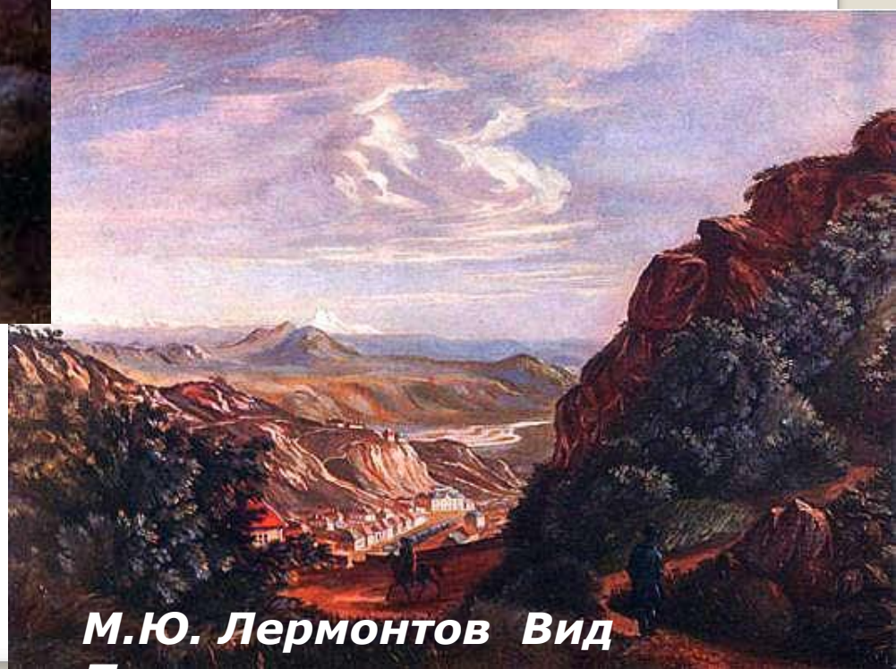
М.Ю. Лермонтов Вид Пятигорска

Горы навсегда покорили сердце поэта своей могучей красотой и величием.