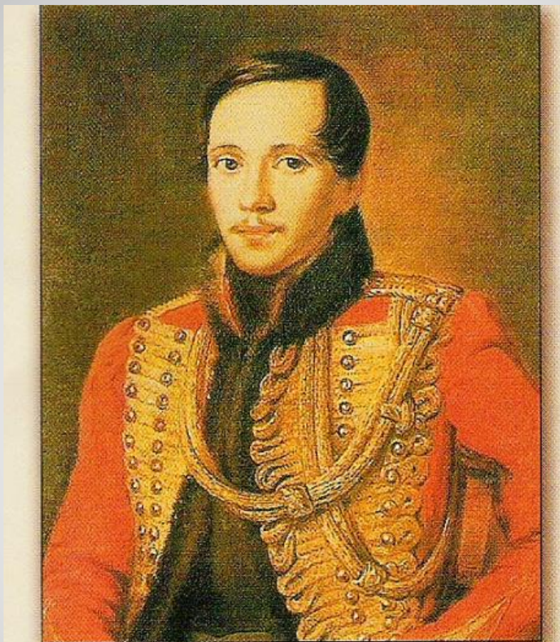
М.Ю. Лермонтов в мундире лейб-