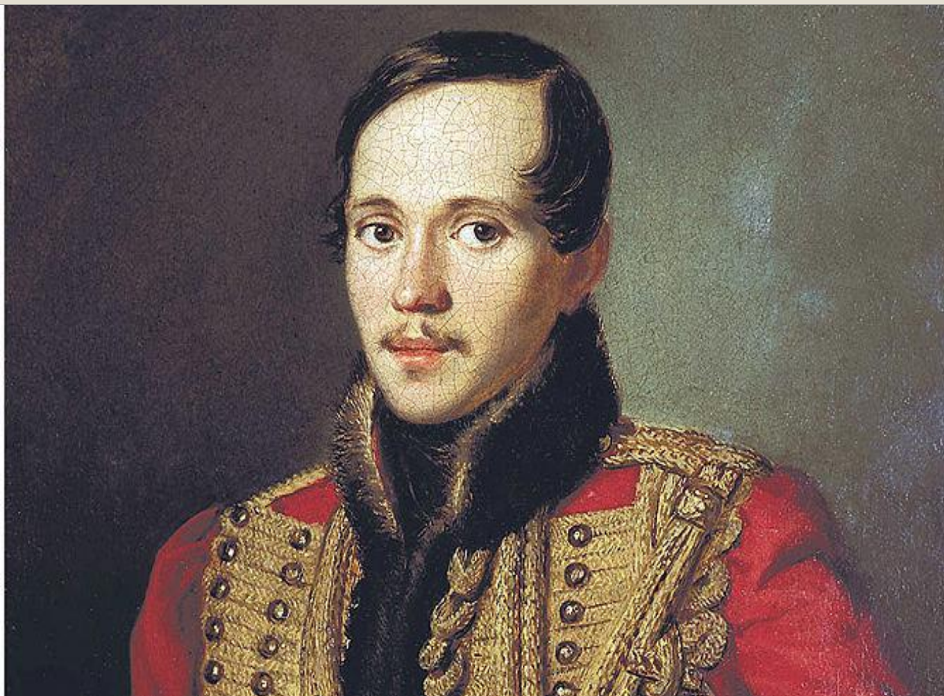
М.Ю. Лермонтов (1814-1841)