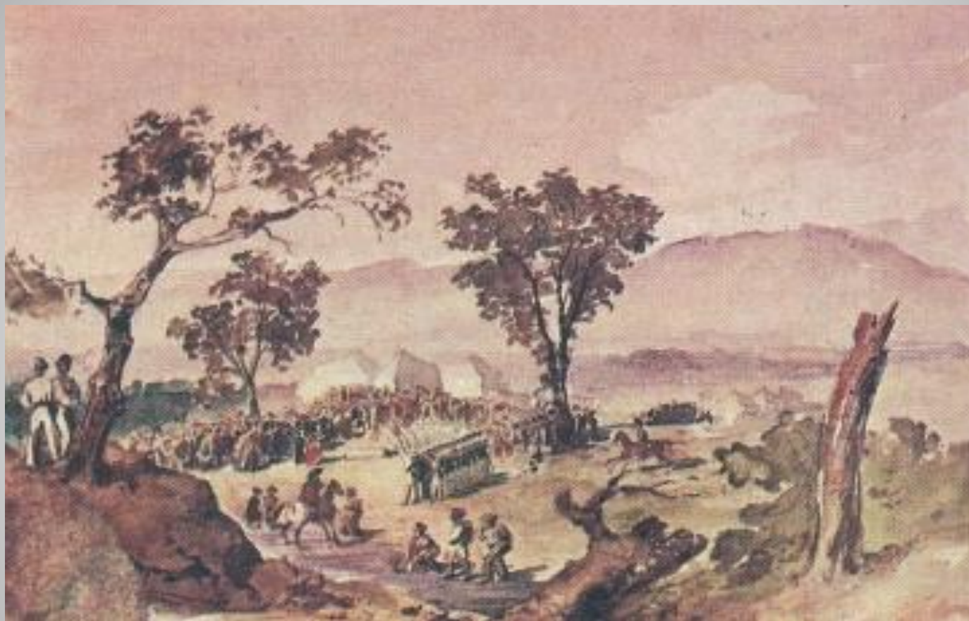
Похороны убитых («Валерик»)