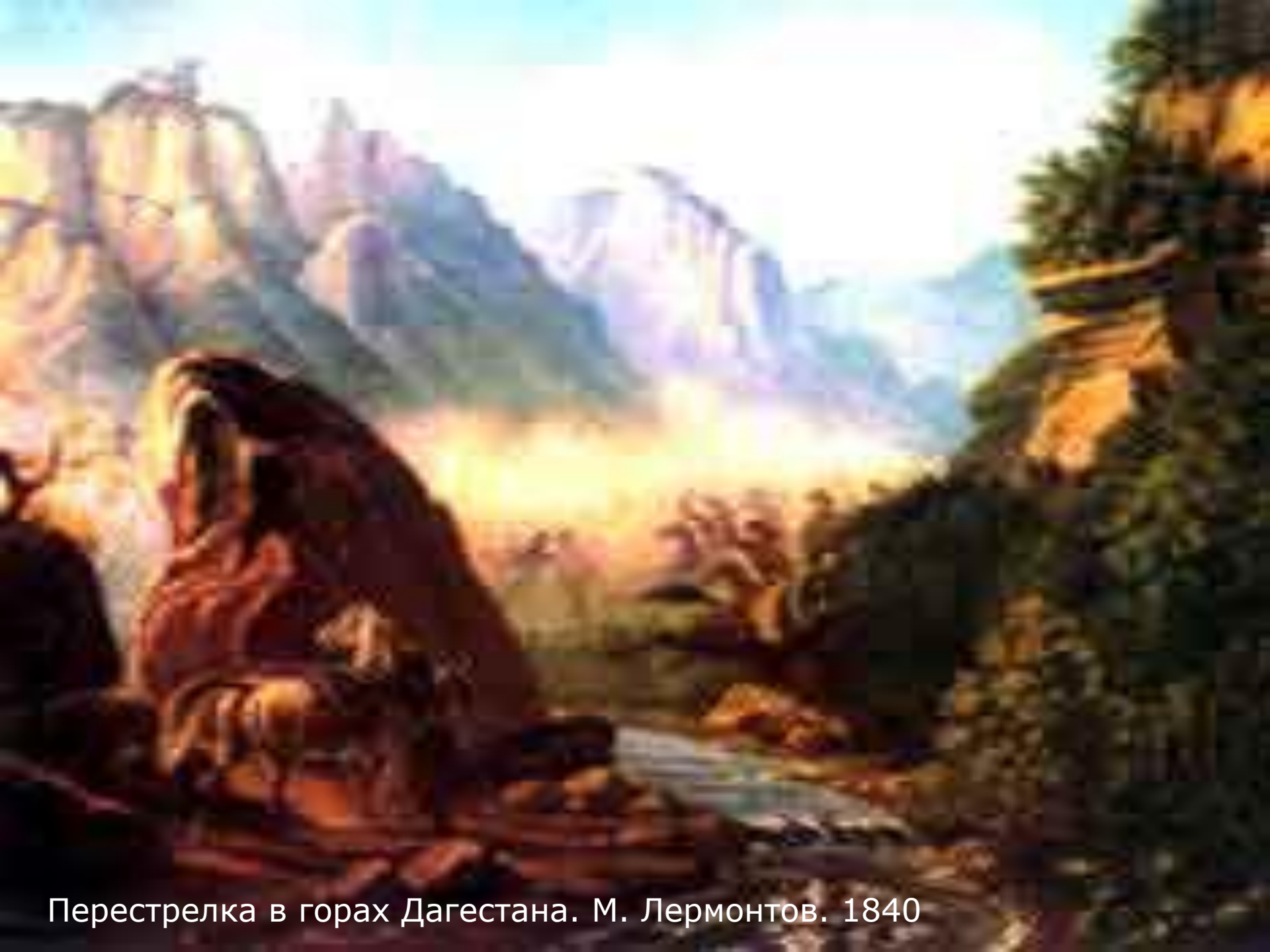
Перестрелка в горах Дагестана. М. Лермонтов. 1840