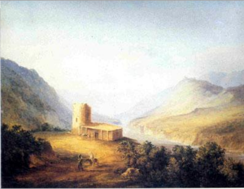
Военно-грузинская дорога близ Мцхета