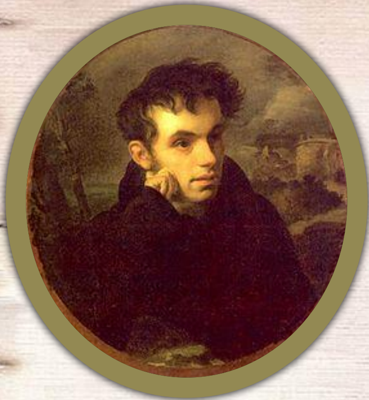
Василий Андреевич Жуковский (1783-1852)