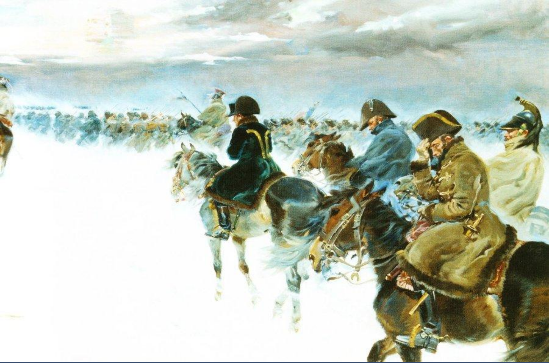
Е. Коссак. Отступление армии Наполеона из России. 1927.