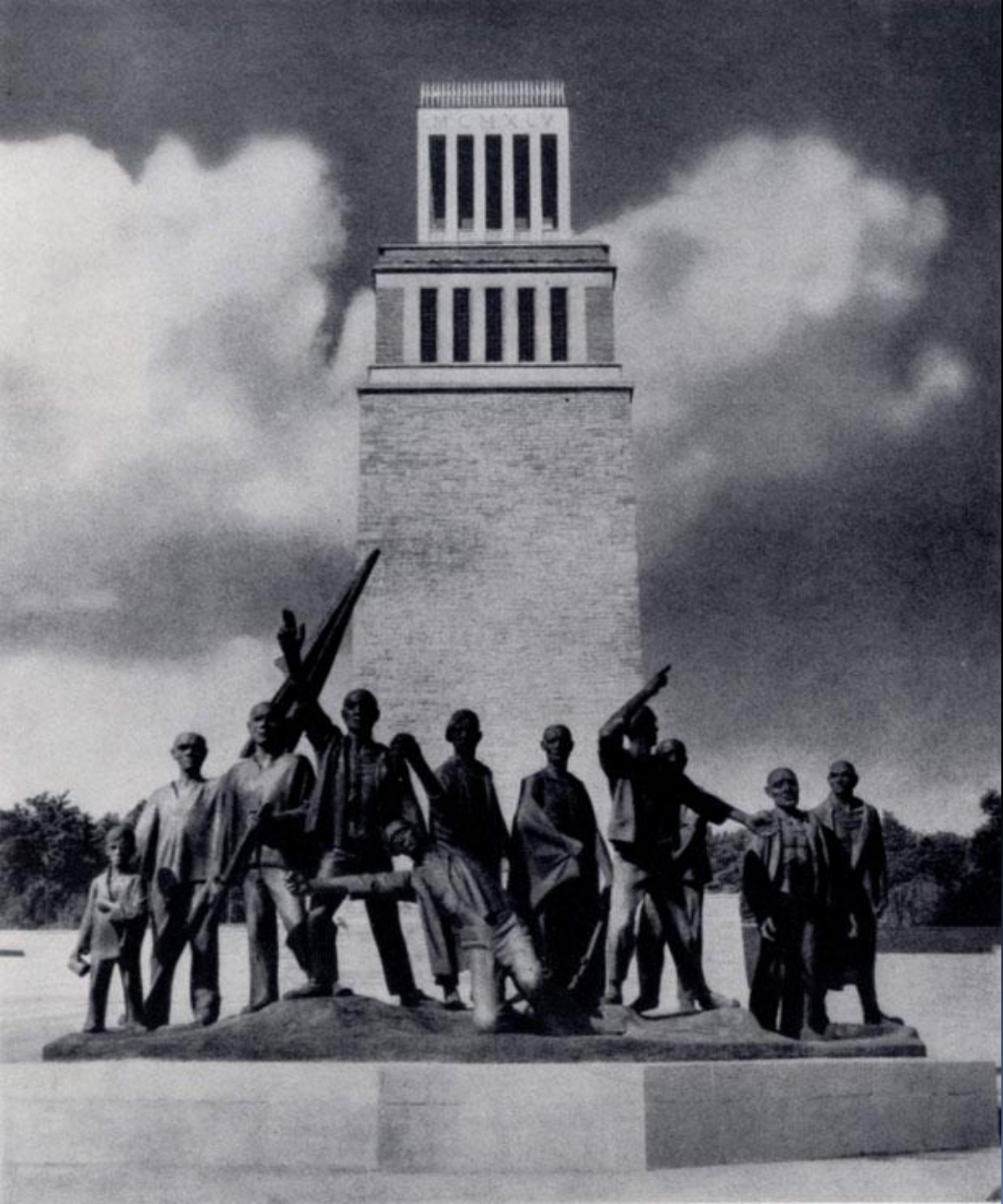
Ф.Кремер. Памятник борцам сопротивления фашизму в Бухенвальде.