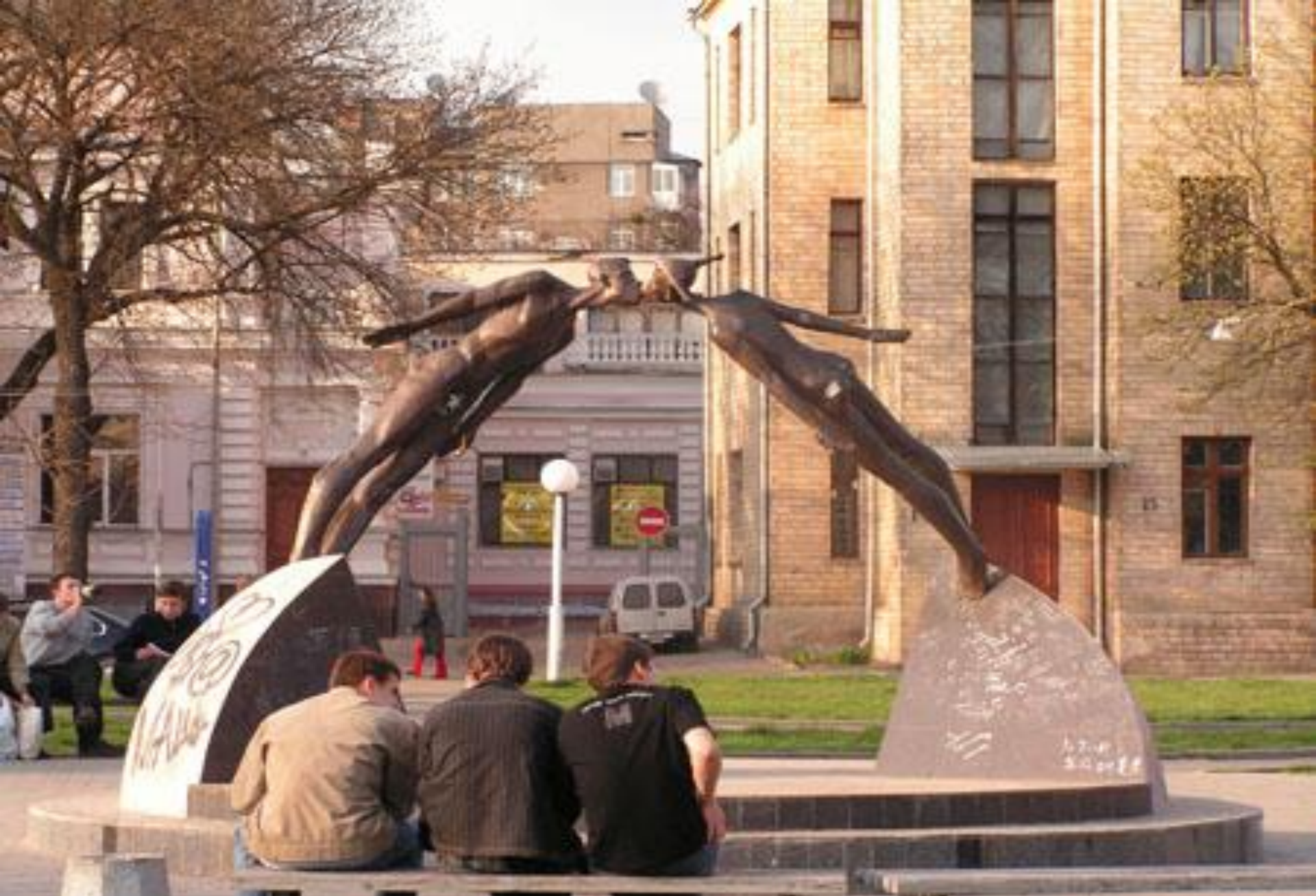
Памятник Поцелую (он же - 'Памятник жертвам Бухенвальда')