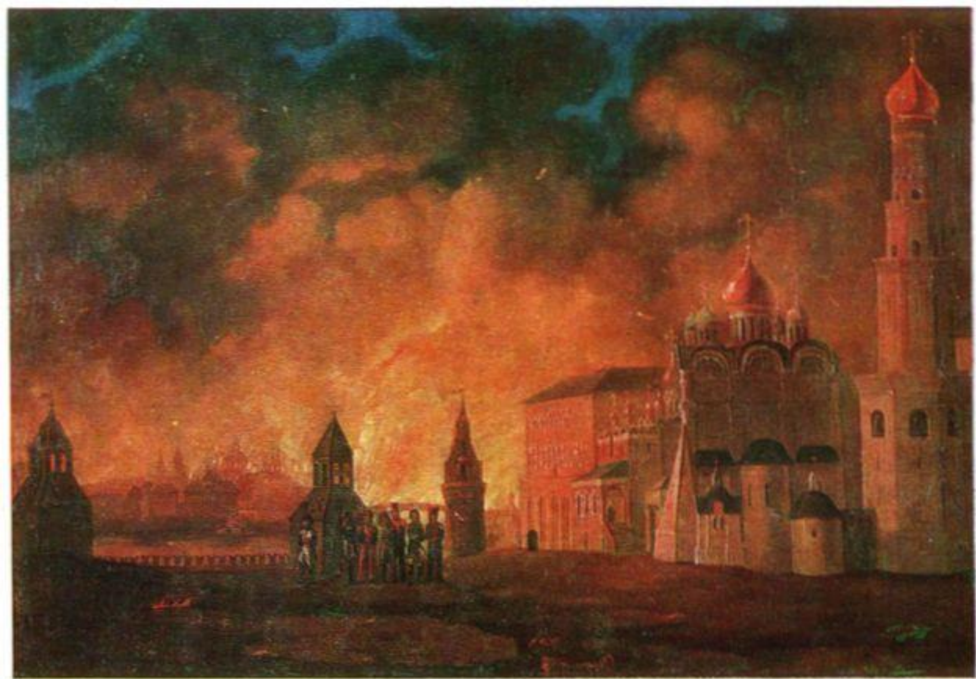
А.Ф. Смирнов. Пожар Москвы. 1810-е гг. Музей-панорама «Бородинская битва»