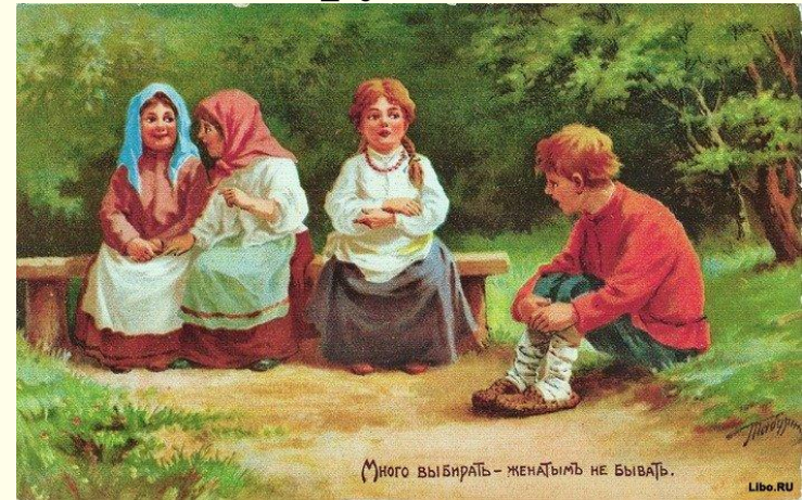
Много выбирать - женатым не бывать.

«Да! такая есть девица. Но .....: С ..... Да .....».