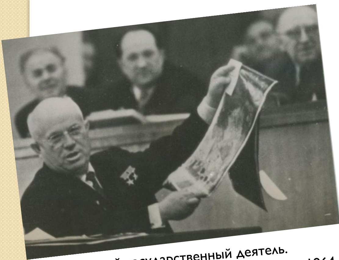
Советский государственный деятель. Первый секретарь ЦК КПСС с 1953 по 1964 годы

На праздновании 75-летия Чуковского к юбилюру подошел Хрущев и сказал: «Вот кого я ненавижу! Придешь с работы усталый, а внуки с вашими книжками: «Дед, читай!».