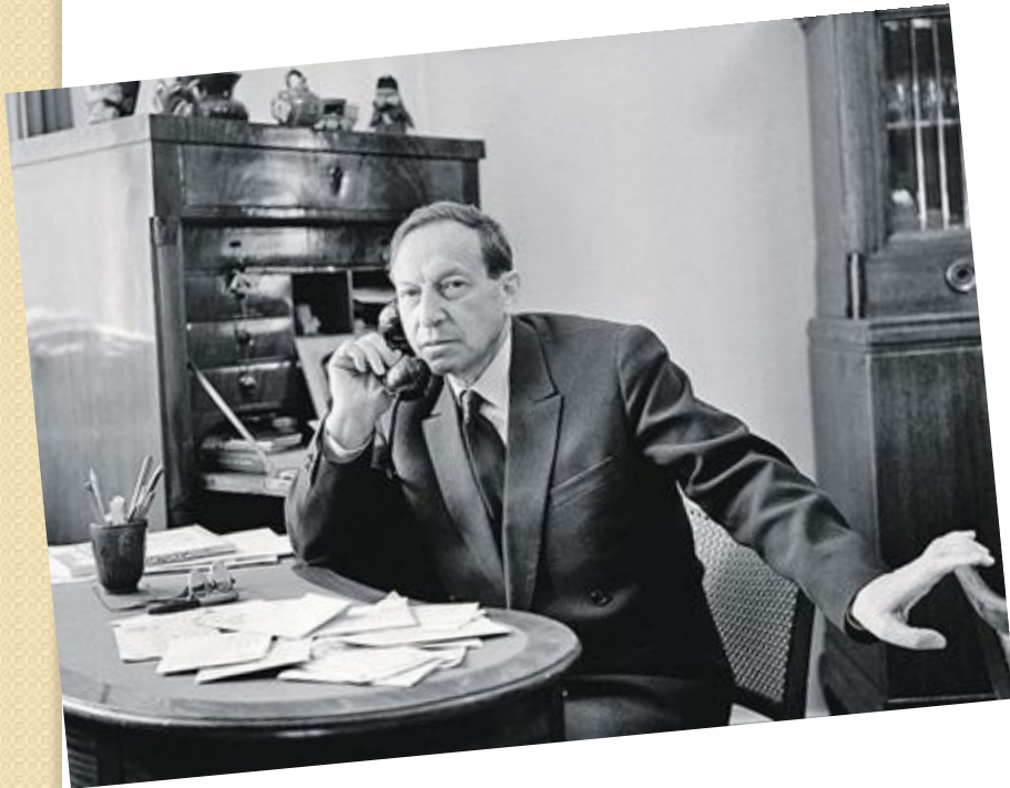
Русский советский писатель, драматург и сценарист. (1902-1989г.)

«Можно, но при условии, что в книге этой не будут упоминаться Бог и евреи».