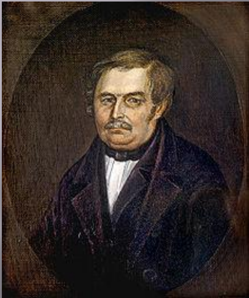
Василий Гоголь-Яновский, отец Николая Гоголя