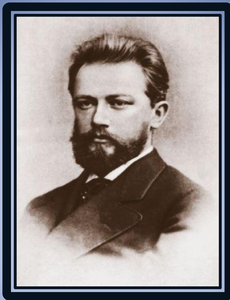
П.И. Чайковский 1795—1880