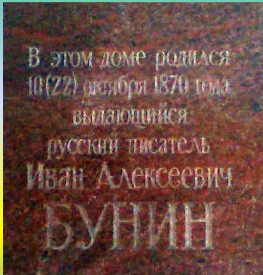
Мемориальная доска на доме Буниных

В этом доме осенью 1870 года родился И.А. Бунин. Дом Буниных – одноэтажный, с флигельными крыльями – стоял в начале Большой Дворянской – главной улицы города. Второй этаж был «поднят» уже после отъезда семьи Буниных. Таким – двухэтажным, кирпично-деревянным – видят его нынешние воронежцы и приезжие почитатели.