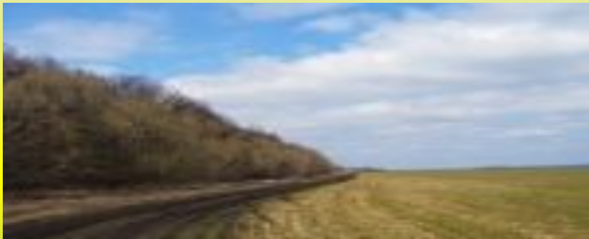
Дорога в Знаменское