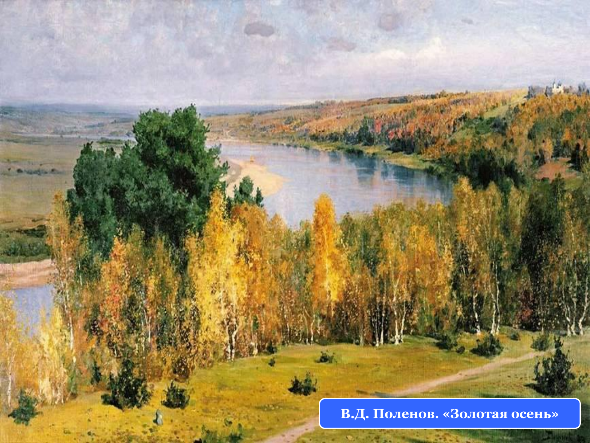
В.Д. Поленов. «Золотая осень»