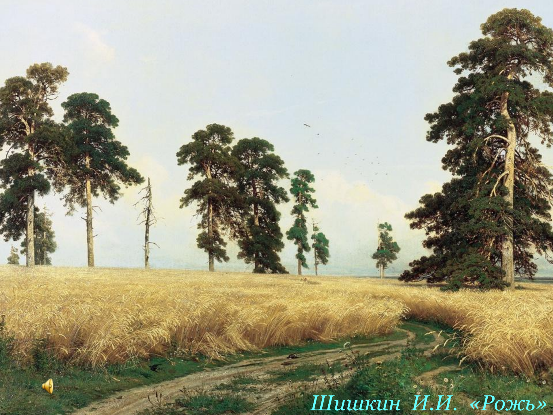
Шишкин И.И. «Рожь»