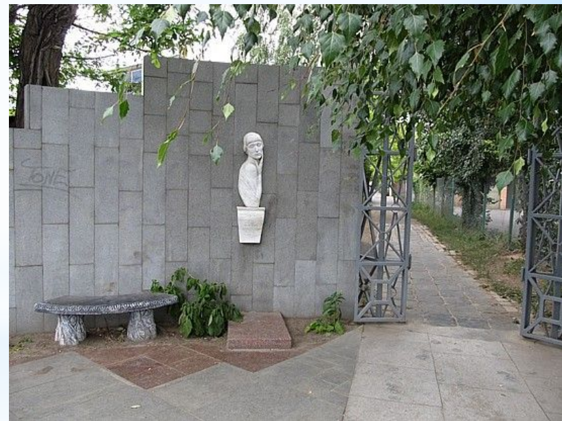
Памятник Анне Ахматовой в Одессе на 11 1/2 станции Большого Фонтана