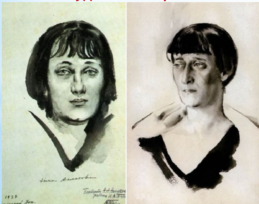
Работа художника Н.Тырса