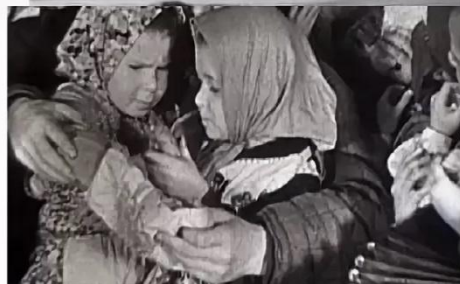
Эвакуация стариков и детей