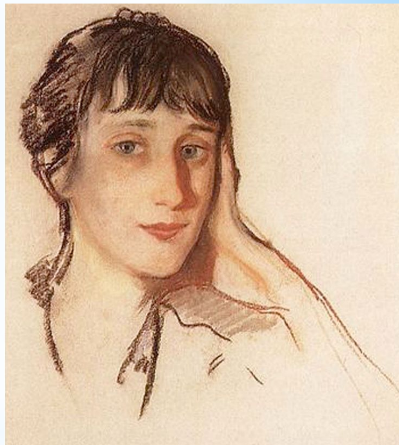
Работа художника Зинаиды Серебряковой