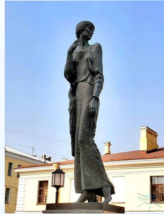
Памятник Анне Ахматовой в Санкт-Петербурге напротив следственного изолятора «Кресты».