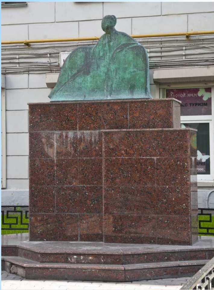
Памятник Анне Ахматовой в Москве во дворе дома № 17 по улице Большая Ордынка