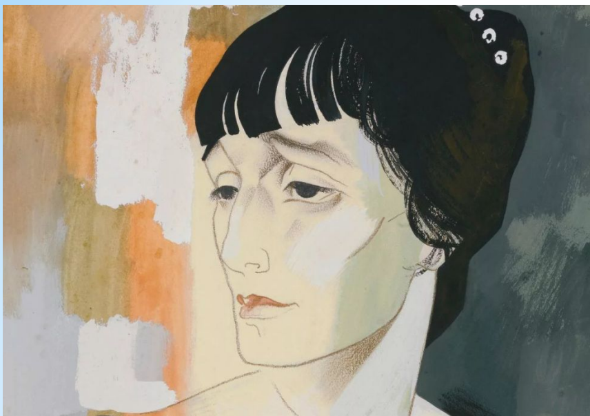
Работа художника Юрия Анненкова