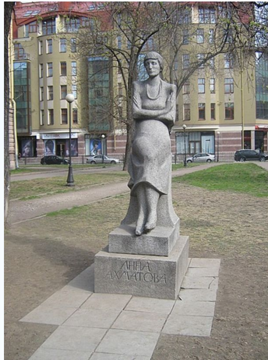
Памятник Анне Ахматовой в саду перед школой на улице Восстания.