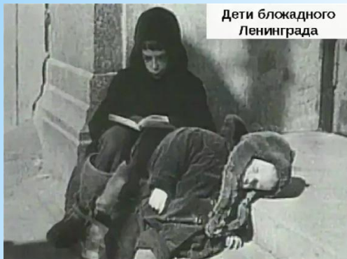
Дети блокадного Ленинграда