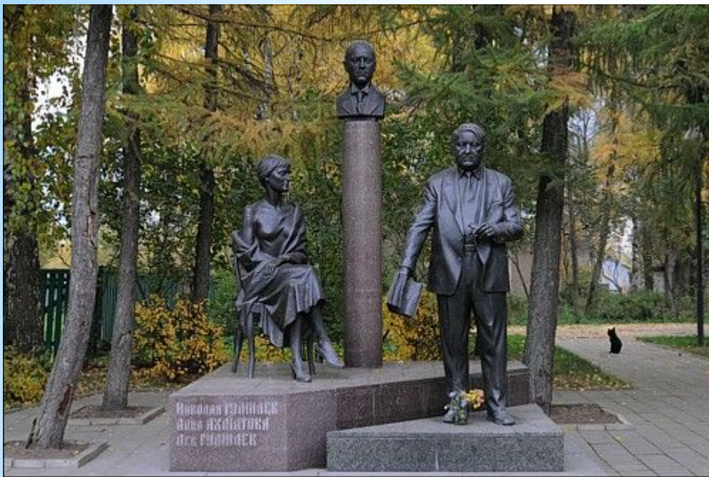
Памятник семье Гумилевых в г. Бежецк