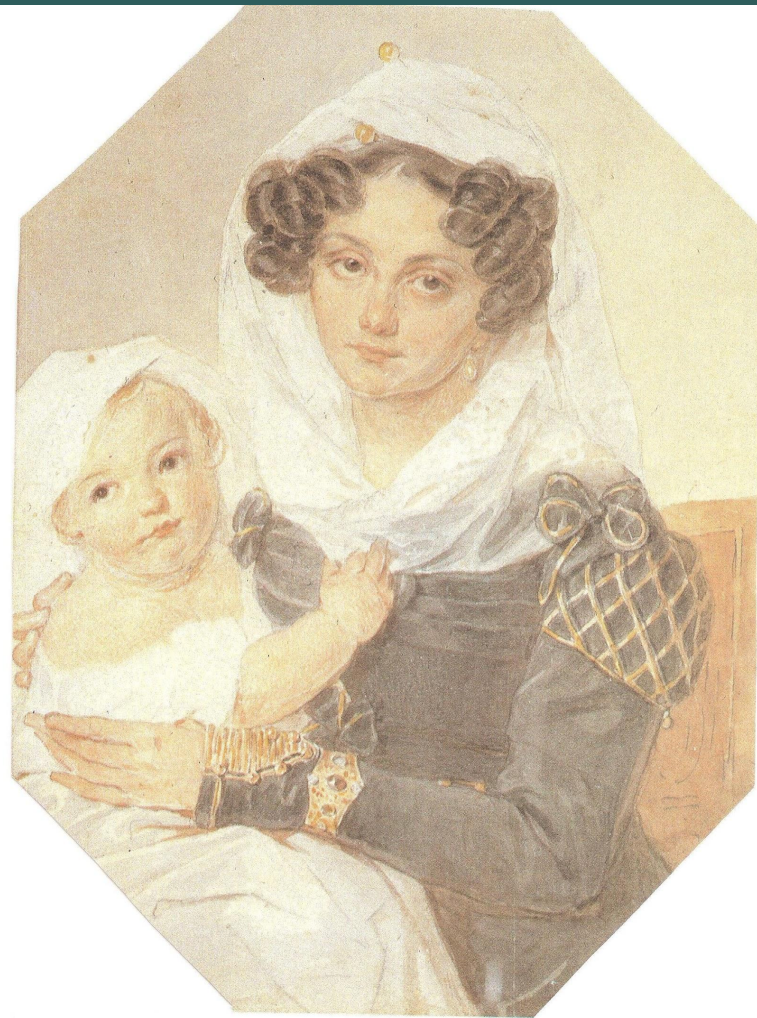
46. Мария Николаевна Волконская с сыном (1805—1863)

Твоя печальная пустыня, Последний звук твоих речей Одно сокровище, святыня. Одна любовь души моей.