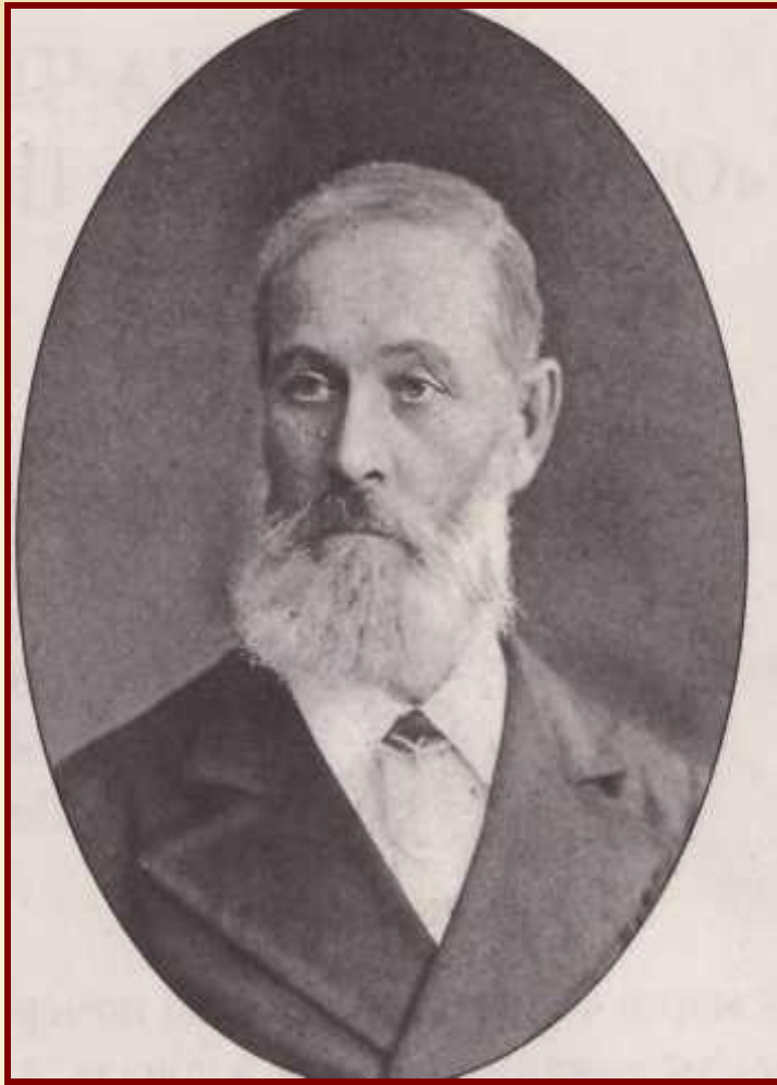
ПАВЕЛ ЕГОРОВИЧ ЧЕХОВ