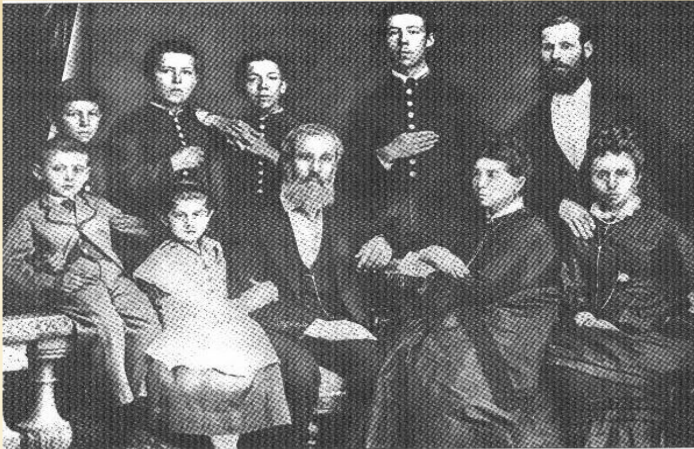
А.П.Чехов в кругу семьи.