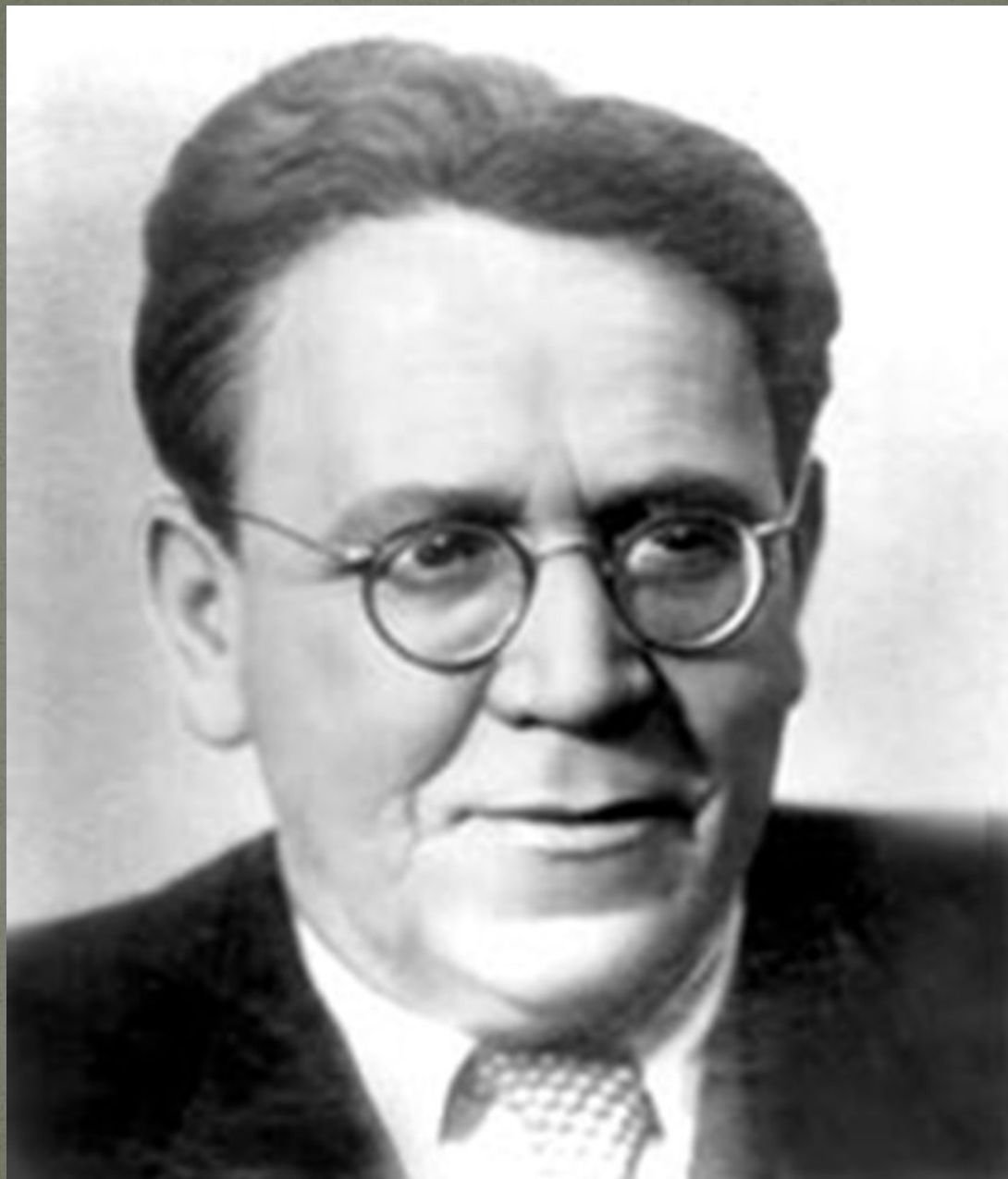
Самуил Яковлевич Маршак (1887—1964)