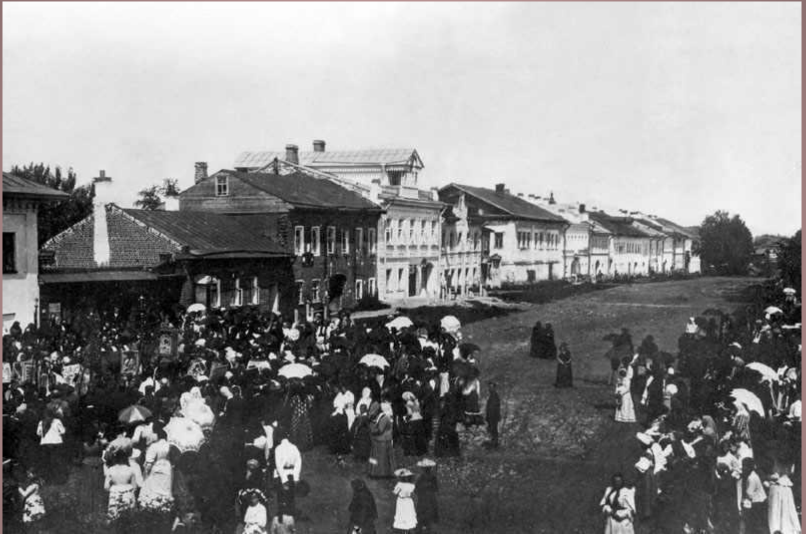
с. Вятское. Урлов посад. Крестный ход