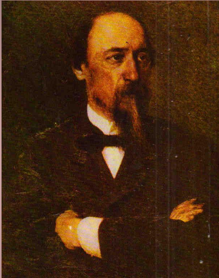
Н.А. Некрасов Портрет работы И.Н. Крамского. 1877