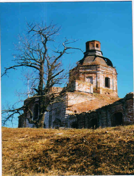
Церковь Успения Пресвятой Богородицы (1780г.)