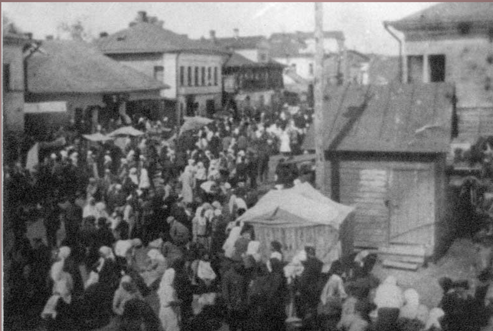
с. Вятское. Базарный день